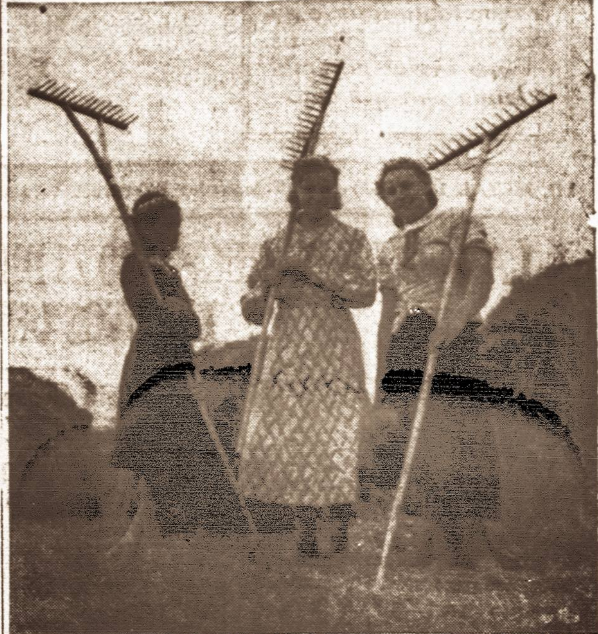
Šienapiūtė Lietuvoje. — Lietuvaitės grėbėjos, linksmos suspėjusios sugrėbti ir sukrauti į kūgius kvepiantį sieną dar nesupėjus sulyti.

Todėl tautinė visuomenė, jos veikėjai ir draugijos, yra išsemta jėgomis ir pinigais bendriems tautos ir Lietuvos valstybės reikalams.