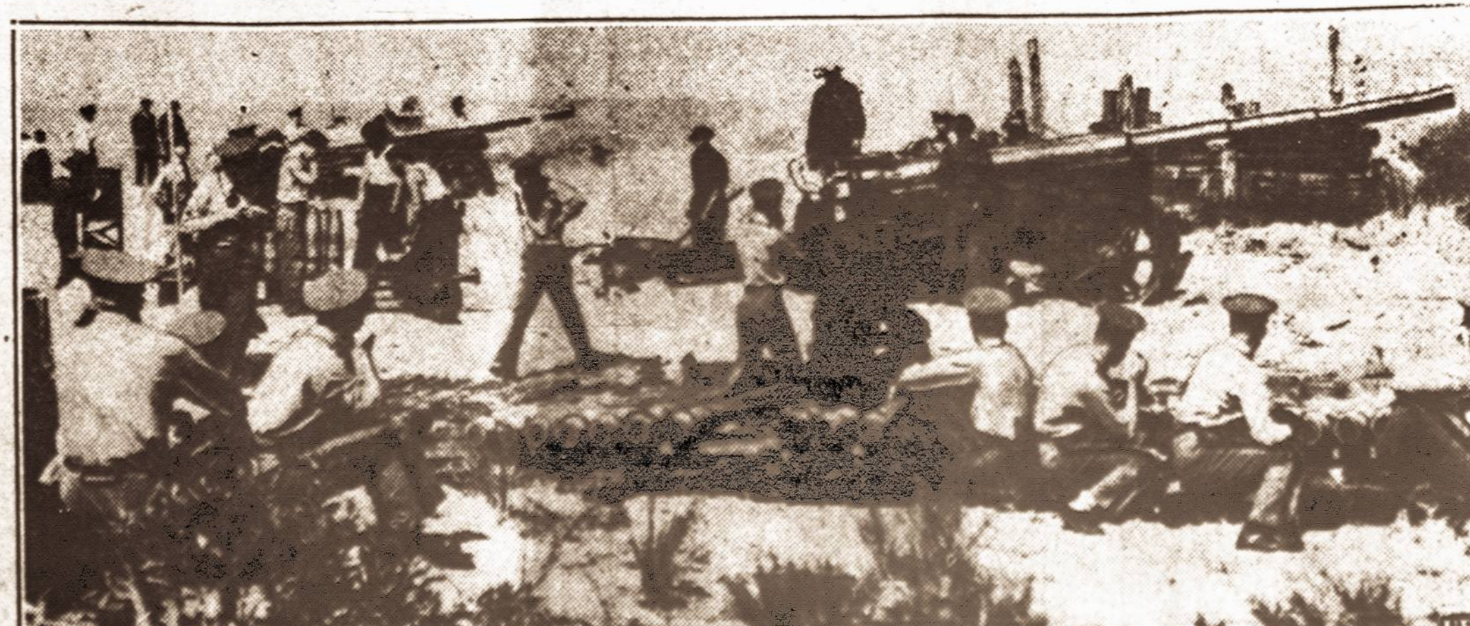
Būsimieji generolai mokosi. — Jungtinių Amerikos Valstybių West Point karo akademijos auklėtiniai, ties Fort Hancock, N. J. mokosi šaudyti iš didžiųjų ar motų.

KAUNAS. — Liepos 6 d. įvyko Lietuvos karo mokyklos ir pirmosios karininkų laidos 20 metų sukaktuvių iškilmingas minėjimas Karo Muziejuje, dalyvaujant Respublikos Prezidentui, ministrui pirmininkui, kariuomenės vadui, krašto apsaugos ministrui ir kt. aukštesiems karininkams, kurių nemaža dalis buvo pirmosios karo mokyklos laidos auklėtiniai. Kadangi pirmosios laidos karininkai buvo visi savanoriai, kurie vos tik mokyklą baigė išėjo į frontą ginti Lietuvos nepriklausomybę, todėl Respublikos Prezidentui leidus pirmoji karininkų laida pavadinta Kūrėjų-Savanorių laida. Po Respublikos Prezidento, ministro pirmininko ir krašto apsaugos ministro kalbų įvyko apeigos prie Nežinomojo Kareivio kapo.