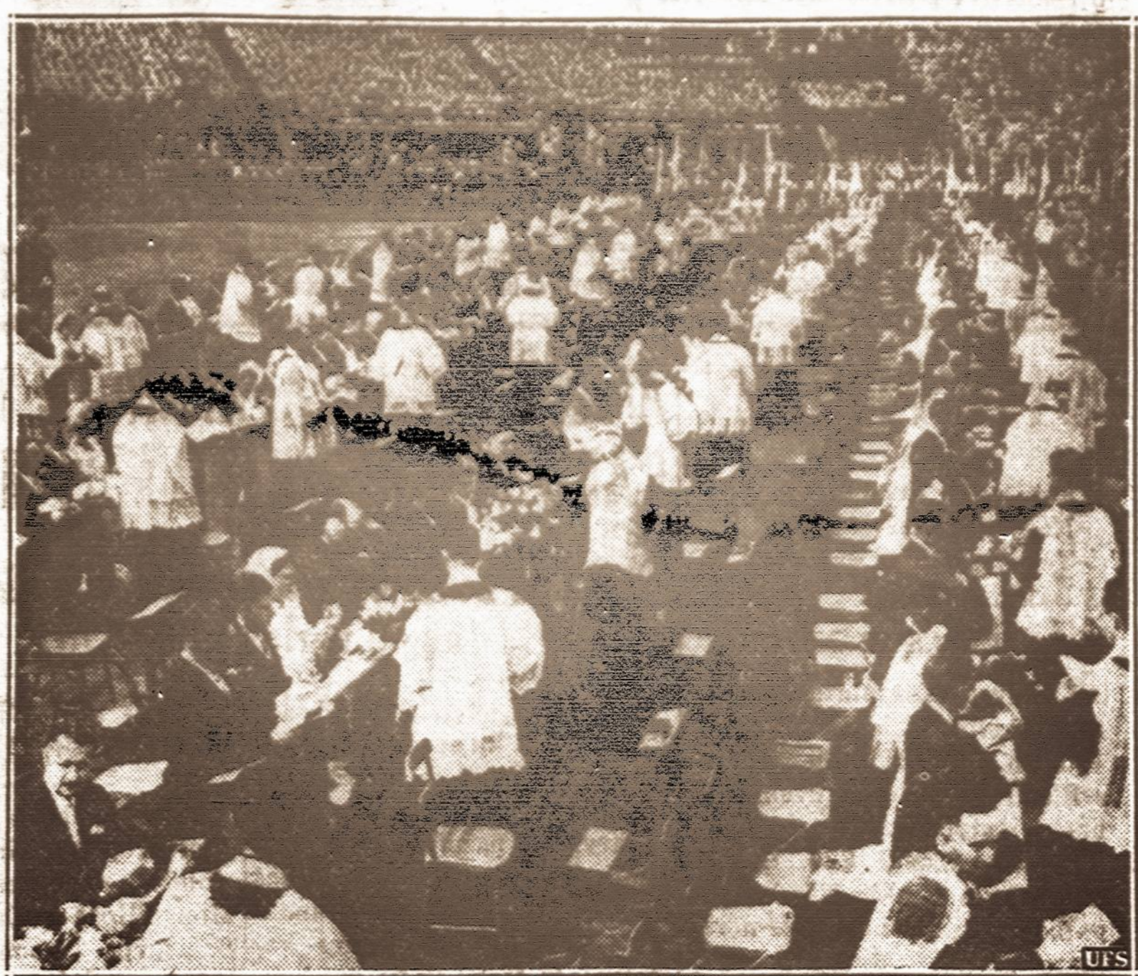
Masinės vestuvės Kanadoje. — Šiomis dienomis Montreale, Kanadoje 105 Kanados prancūzų poros bendrai iškėlė milžiniškas vestuves Montrealo sporto stadione.

— Čekijoje uždrausta dėvėti sakalų organizacijos uniformą. — Britų karinė vadovybė netrukus Turkijoje įsteigs lėktuvams statyti fabrikus. — Vokiečiai reikalauja, kad angliai iš Vienos atšauktų savo generalinį konsulą. — Nauju prancūzų akademijos nariu priimtas rašytojas Andre Maurois.