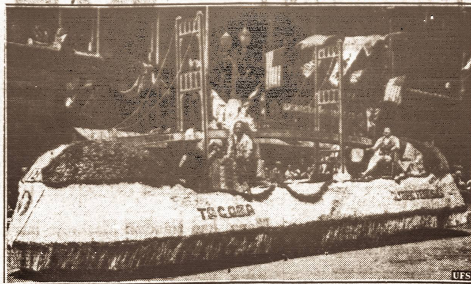
Karnivale. — Šiomis dienomis Tacoma, Washington valstybėje šis Tacomos flotas laimėjo pirmą prizą, kaip gražiausias parado flotas. Karnivolas įvyko miesto 50 metų sukaktuvių minėjimo proga.