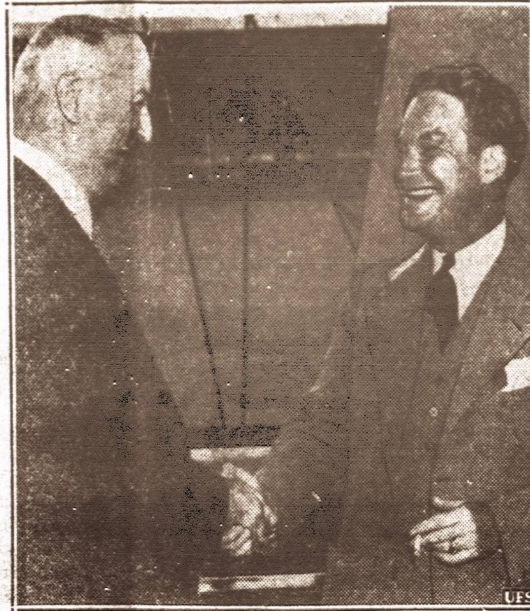
Republikonas ir demokratas. — Vykstančiųjų Oslo Amerikos kongresmenų tarpe yra ir demokratų partijos pirmininkas Jim Farley ir republikonų partijos pirmininkas John D. M. Hamilton.

KAUNAS. — Iš 100 automobiliukų atimti leidimai važiuoti. Didėjant susisiekimo nelaimių skaičiui, policija sustiprino autovežimį tikrinimą ir šiomis dienomis 100 vairuotojų atėmė leidimus.