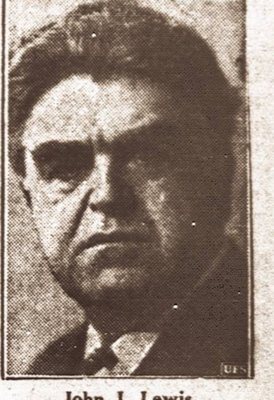
John L. Lewis

— Birželio 29 d. Lietuvoje degė Kulių miestelis. Sudegė 20 trobesių, nuostolių padaryta 125,000 litų.