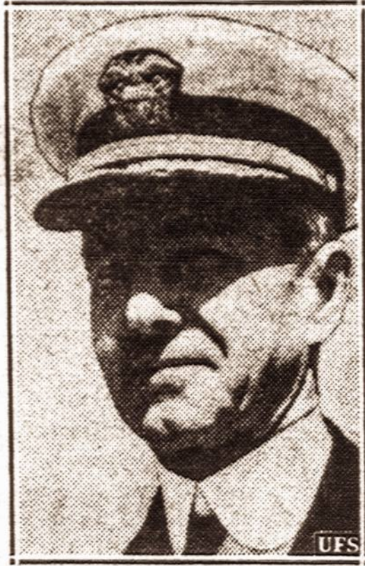
Laivyno vadas. — Admirolas Thomas C. Hart, naujasis J.A.V. karo laivyno vadas Azijos vandenynėse. Jis šiomis dienomis buvo paskirtas vietoj Admirolo Yarnello.

Jungtinės Valstybės neatnaujinys prekybos sutarties iki nebus pasiekta politinio susitarimo