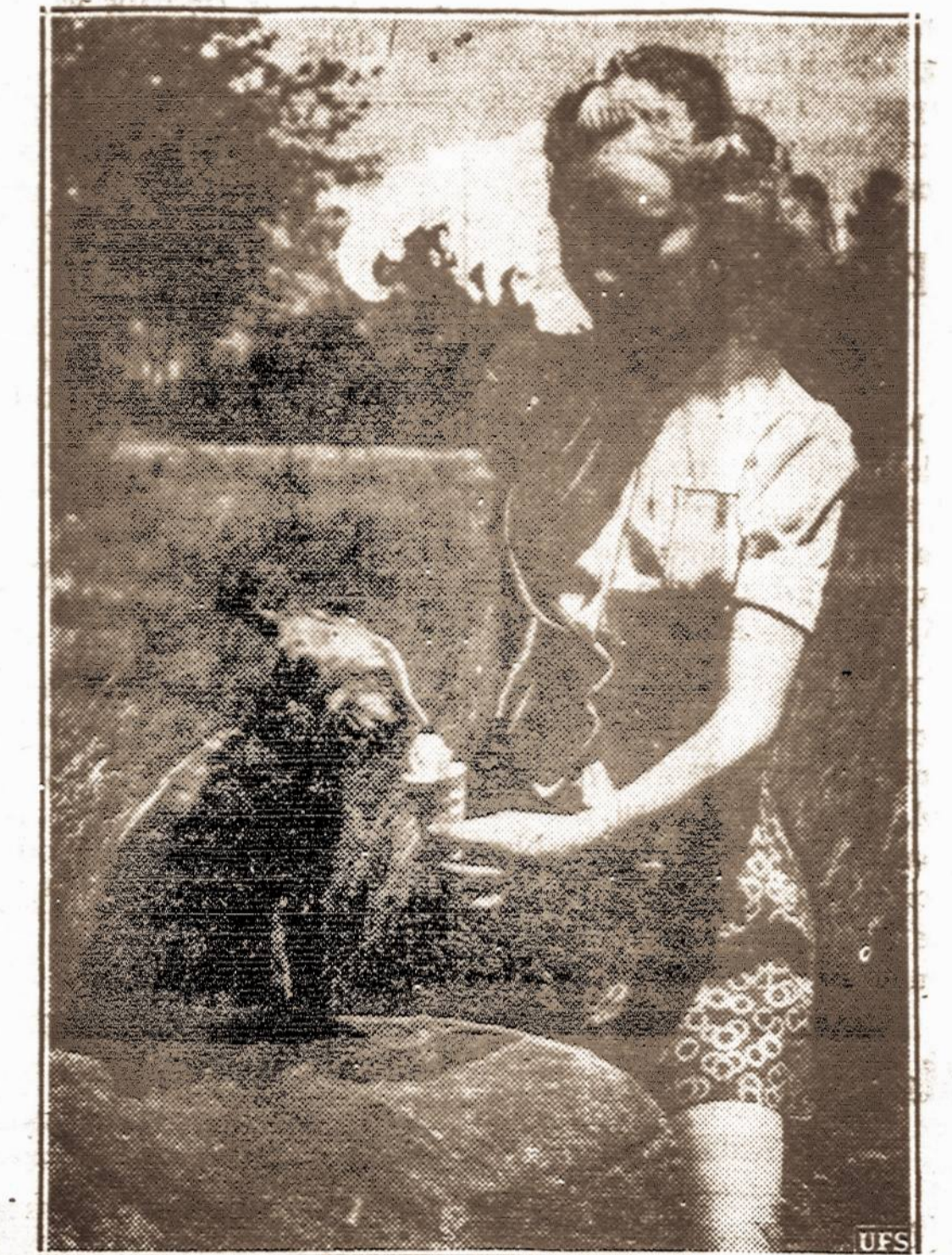
Laputė mėgsta ledus. — Kai siaučia dideli karščiai tai ir lapės Amerikoje mėgsta saldžius ledus.