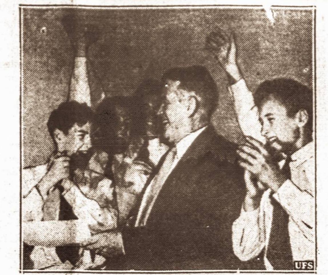
Kongresui pasibaigus. — Senatorius Alban W. Barkley, Senato didumos vadas, pasibaigus Kongreso sesijai, kartu su Senato pasiuntiniais berniukais, kelia ovacijas. Visi dabar galės atostogauti.

Andai mes ekelbėme, kad į šventosios uostą atvyko prekybinis laivas, kuris prisikrovęs medžiagos, išplaukė į Baltijos jūrą. Tas laivas atplaukė į šventosios uostą liepos 27 d. Tai buvo Olandijos prekybinis laivas — pirmas svetimos valstybės laivas atplaukęs ir prisikrovęs naujame Lietuvos uoste. Tai istorinis įvykis — naujo laigo į jūras atidarymas.