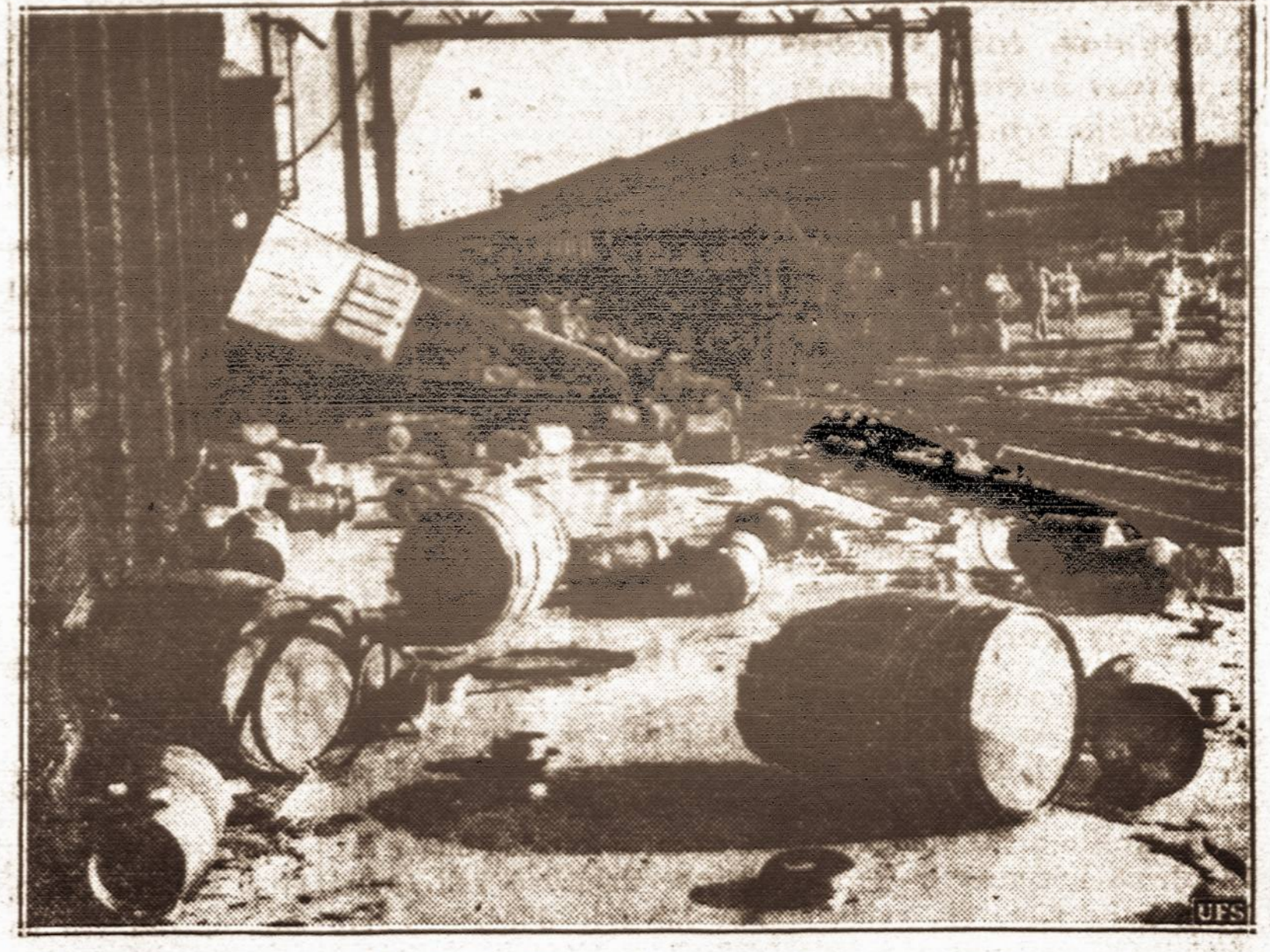
Paliejo piens. — Netoli St. Louis, Mo. prekinis traukinys susidūrė su sunkvežimiu. Po katastrofos piens ir smetoną gatvėmis tekėjo. Sunkvežimio šoferis nesužeistas.