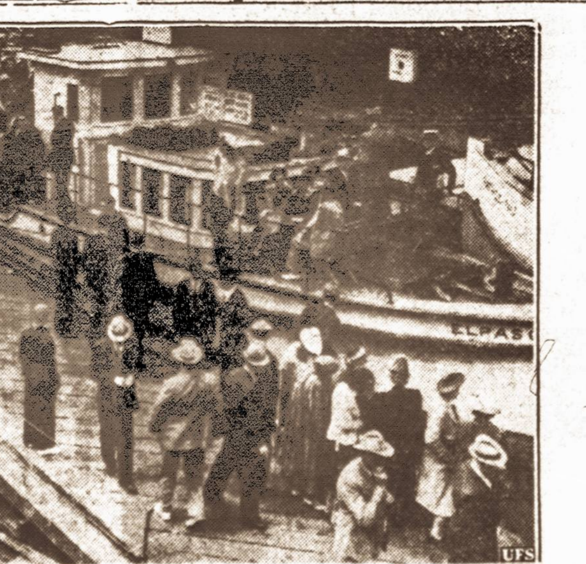
Streikai vakaruose. — Seattle, Washingtono valstybėje vietinio sugusiekimo laivų tarnautojai sustreikavo ir žmonės, kurie užmiestyje dirba, negali susisiekti su namais. Kai kurie buvo priversti samdyti privatinę jachtą, kad juos parvežtų namo.

VILNIUS. — Iki šiol dar tebėra uždarytos šios Vilniaus krašto lietuvių draugijos: 1) Tautinis Lietuvių Komitetas, 2) Lietuvių ūkio Draugija, 3) Vilniaus Lietuvių Mokytojų Sąjunga, 4) Lietuvių Švietimo Draugija "Rytas" Švenčionyse, 5) Lietuvių šv. Kazimiero Draugija, 6) Liet. Labdarybės Draugija. Pastaroji yra likvidavimo stadijoje. Šių visų uždaryto draugijų turtą dar tebedalyv lenkų administracijos įstaigų paskirti valdiniai kurtoriai.