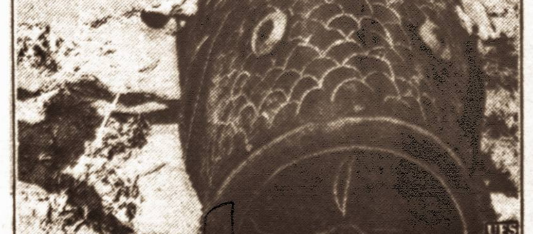
Mardis Gras. — Venice, Kalifornijoje šiomis dienomis įvyko vidurdvasarinis vandens karnavalas, kuriame pirmą kartą laimėjo šį žuvis su trimis karnavalais.