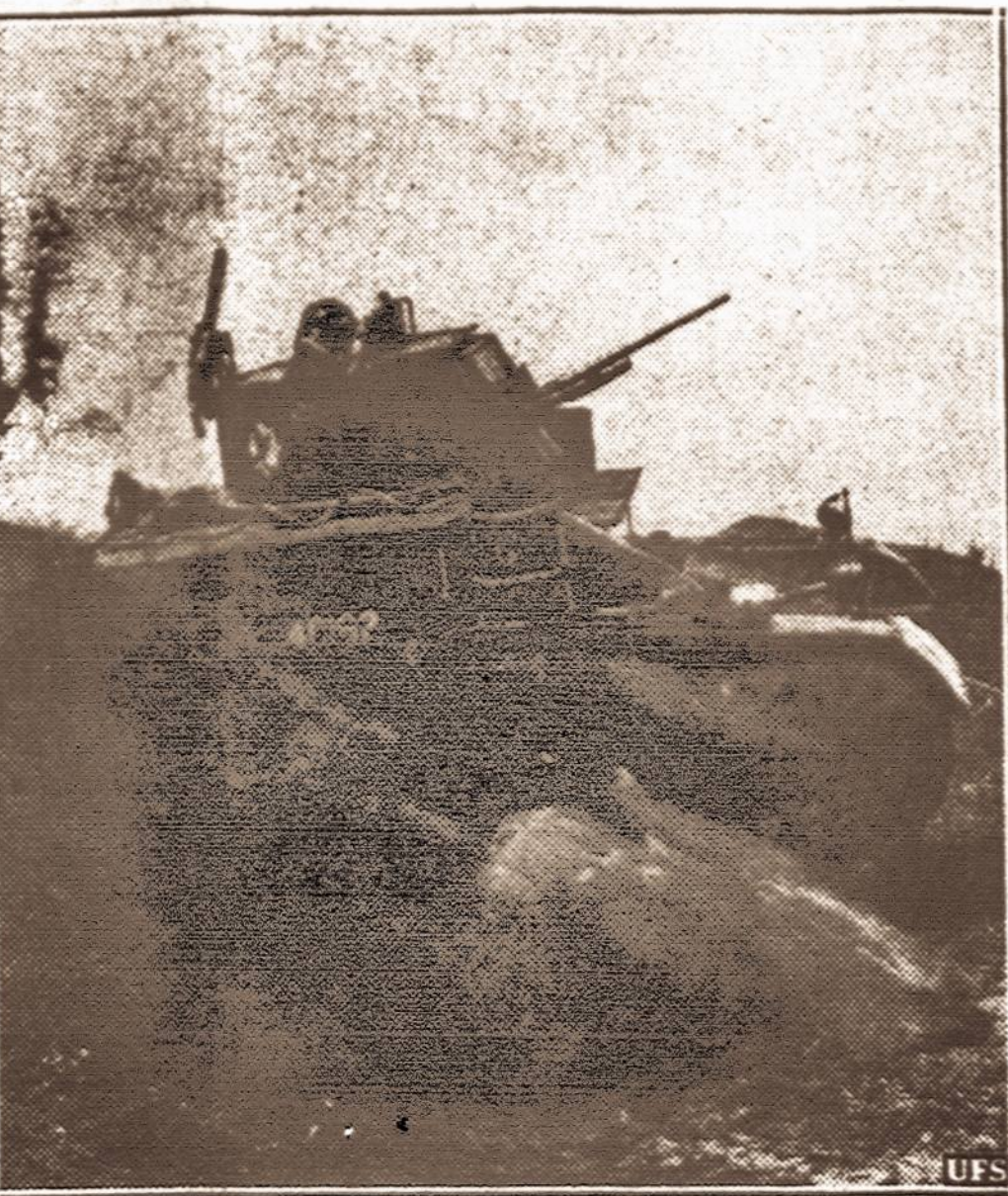
Manevruose. — J.A.V. kariuomenės karo tankas eina per kliūtį ties Plattsburgu, kur dabar vyksta dideli kariuomenės manevrai.

KAUNAS. — Teko patirti, kad Geležinkelių Valdyba greitai laiku numato įsigyti šiuos naujus riedmenis: keturis trečios klasės keleivinius vagonus ir keturias automotrisas su prikabinamais vagonais — du platiesiems keliams. Be to du keleivinius vagonus, vieną automotrisą ir tris lokomoturus — siauresiems keliams. Čia nurodytuosius riedmenis Geležinkelių Valdyba numato įsigyti išsimokėjimui ne mažiau kaip 3 metams.