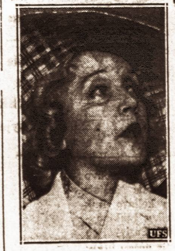
Bankrutavo. — Buvusis filmų artistė Mae Murray, reikalauja $12,000 metams nuo savo buvusio vyro D. Mdvanii.

IŠ NEW YORKO važiuojant reikia imti kelią Nr. 1 iki Trenton. Važiuojasi pro šalį Trenton miestą. Už Trenton pervažiuos senąjį tiltą pasukti į kairę ir imti kelią Nr. 13. Važiuoti iki gatvėkarių bėgių. Paskui sukti po dešinei ir laikytis įžambiai kitų kelių iki prasideda farmos. Ten rasiite ir Mykolaičio farmą.