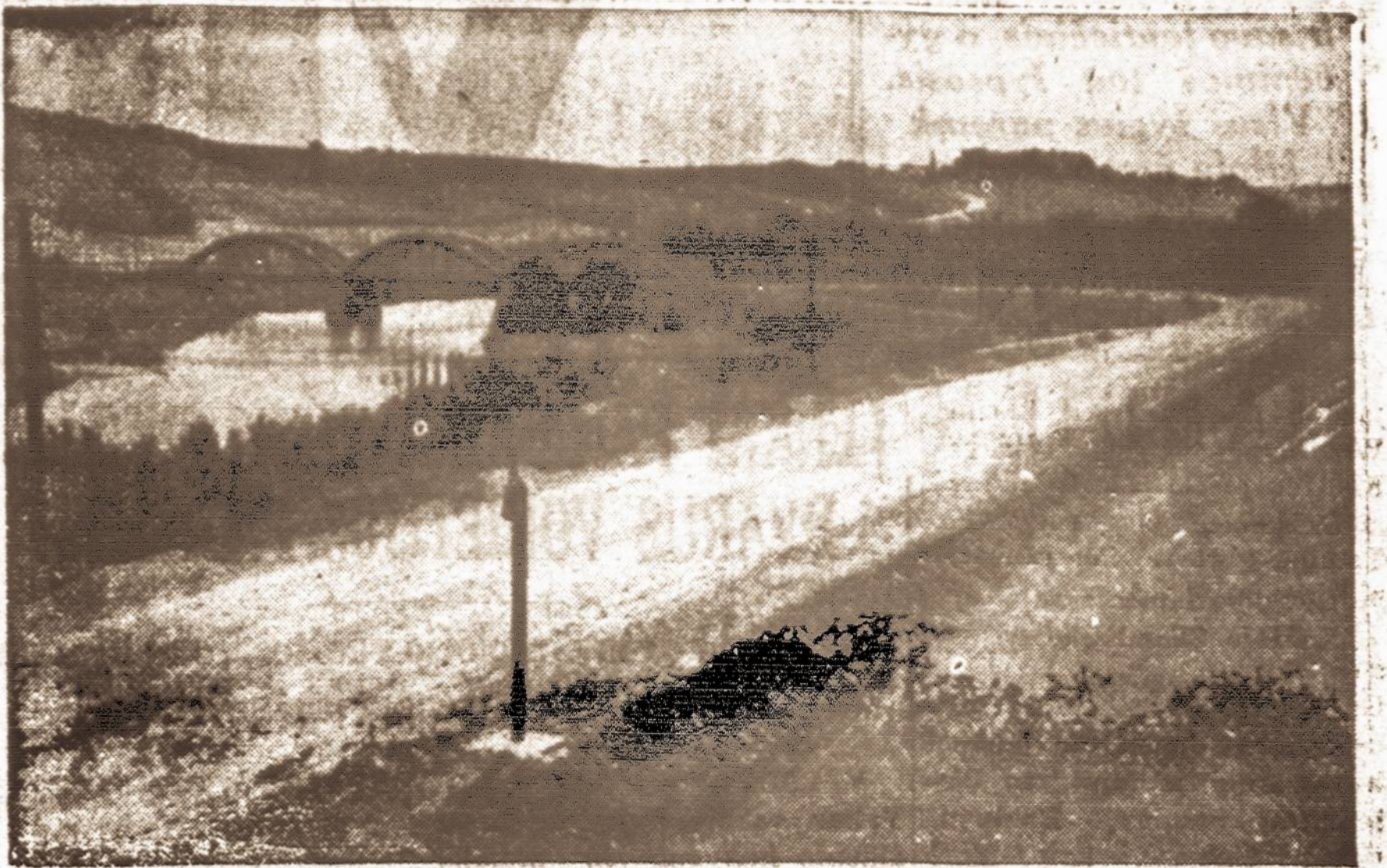
Zemaičių plentas ties Airiogal a. — Vaizdelyje matome Dubysos upę ir gelžbetoninį tiltą.