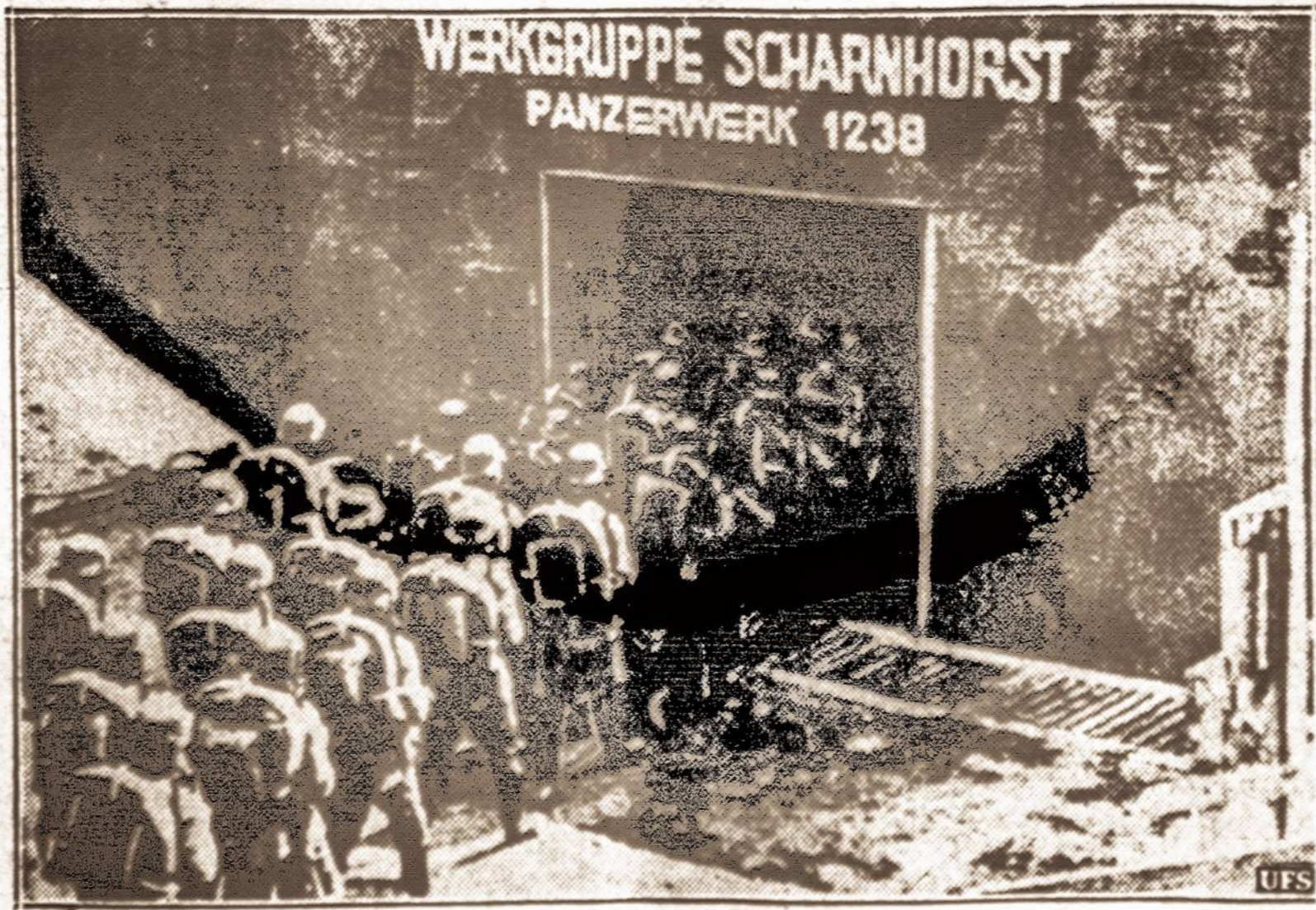
Nacinių tvirtovės. — Prancūzijos pasienyje vokiečių kariuomenė eina į savo tvirtovės. Šis paveikslas paimtas iš Vokietijos filmos, kurioje bandoma įrodyti, kad vokiečių tvirtovės negalima paimti.

Saulė teka 6:08, leidžiasi 7:52. Dienos ilgis 13 val. 43 min.