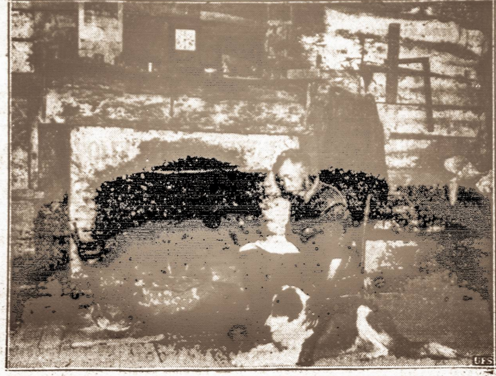
Židinys dega nuo 1789 metų. — 1789 metais Blue Ridge, N. Carolina, vienas pionierius pirmą kartą uždegė ugnį šiame židinyje. Nuo to laiko vienas vietinis gyventojas, pamainomis, nuolat kūrė šią ugnį iki šių dienų. Prie židinio matyti ugnies prižiūrėtojas ir jo šuo.