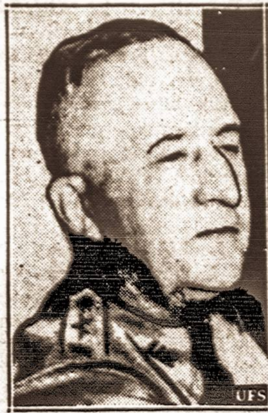
Armijos vadas. — Generolas leitenantas Hugh A. Drum, Pirmosios armijos vadas. Jo armija dabar manevruose Plattsburge, kur dalyvauja apie 52,000 kariuomenės. Jis sako, kad Amerikos kariuomenės dar persilpną.

WASHINGTON, rugp. 23 d. — Spaudos atstovų pasikalbėjime su Lenkijos Pasiuntiniu Washingtono grovu Potockiu, pasiuntinys pareiškė, kad Vokietijos Rusijos susitarimas visai nepakeičia padėties ir Lenkija, jeigu jai net vienai teks su Vokietija kariauti be Anglijos ir Prancūzijos paramos, ji kariaus iki paskutiniųjų. Paklaustas apie kitus Lenkijos kaimynus Lietuvą ir Rumuniją, Potockis pareiškė, kad Lenkijos Lietuvos santykiai dabar laipsniškai gerėja ir jis nemažiau, kad Lietuva išnaudos dabartinę politinę padėtį reikalaujanti gražinti jai Vilnių ir tą dalį teritorijos, kurią Lenkija paėmė po Suvalkų sutarties pasirašymo.