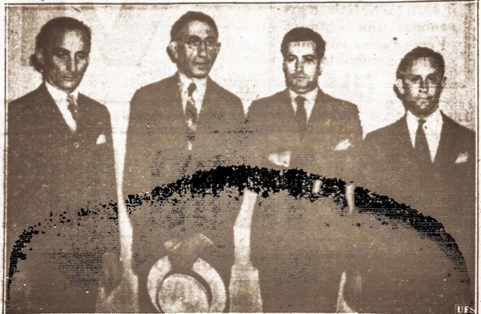
Pasidavė autoritetams. — Moses Annenbergas (antras iš kairės), kuris darė nepaprastai didelį biznį iš slaptų pranešimų apie arklų lenektynes, dabar pasidavė federalinei policijai, kuri jo ieško už nemokėjimą valdžios mokesčių penkių ir pusės milijonų dolerių sumai. Su juo kartu buvo sulaikytas jo sūnus ir bendradarbiai.