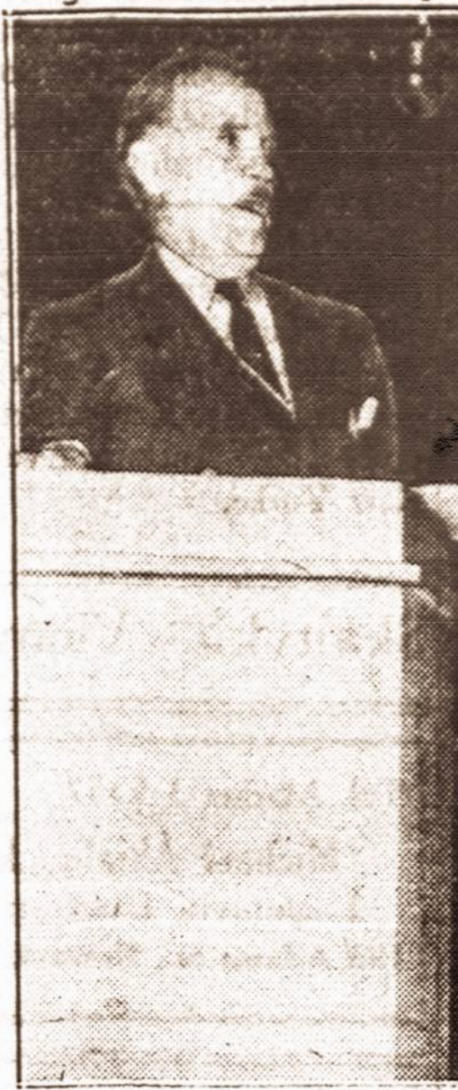
ACTORS FIGHT —Ralph Morgan, Screen Actors' Guild president, speaks at Hollywood meeting, at which charges of "blacklisting methods" were hurled at the Alliance of Theatrical Stage Employees. Adolph Menjou and Laurence Tibbett, who also spoke, at right.

Please address all mail concerning this page to the editor, 103-46-107th St., Richmond Hill, N. Y. Unless otherwise credited, ELTA (the Lithuanian Telegraph Agency) is the source of news dispatches from Lithuania, and LAPS (Lithuanian American Press Service) is the source of all other matter printed in this page. Unsolicited material will not be returned unless accompanied by a stamped, self-addressed envelope. Subscription rate for VIENYBĖ'S Weekly English Page is two dollars annually.