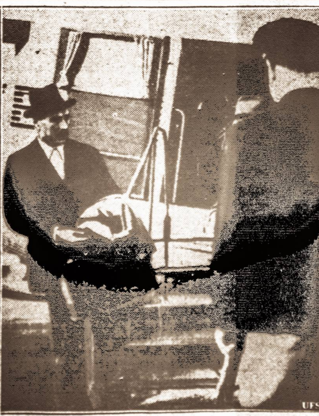
Hendersonas į Berlyną. — Anglijos Pasiuntinys Hendersonas vyksta į Berlyną su Anglijos atsakymu Hitleriui.