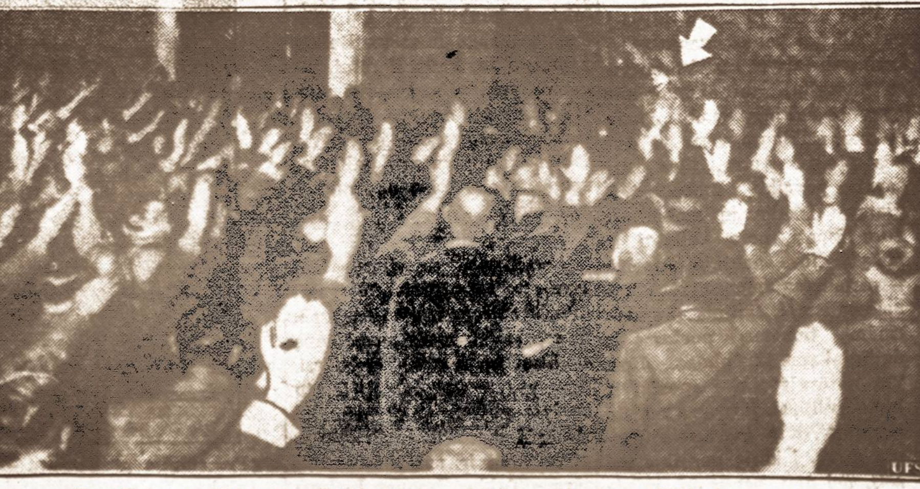
Vokietijos Kongrese. — Paveikslas iš Vokietijos Reichstago susirinkimo, kuriame Hitleris pranešė apie dabar...