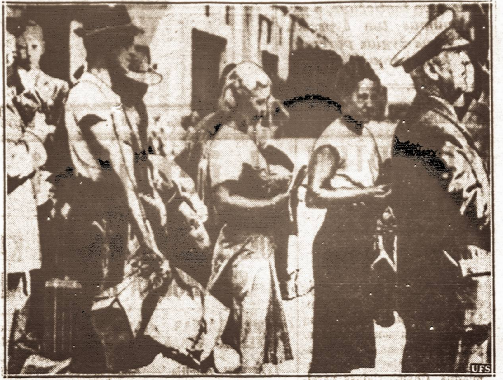
Southampton, Anglijoje amerikiečiai grūdžiasi į laivus, grįžti į Ameriką.