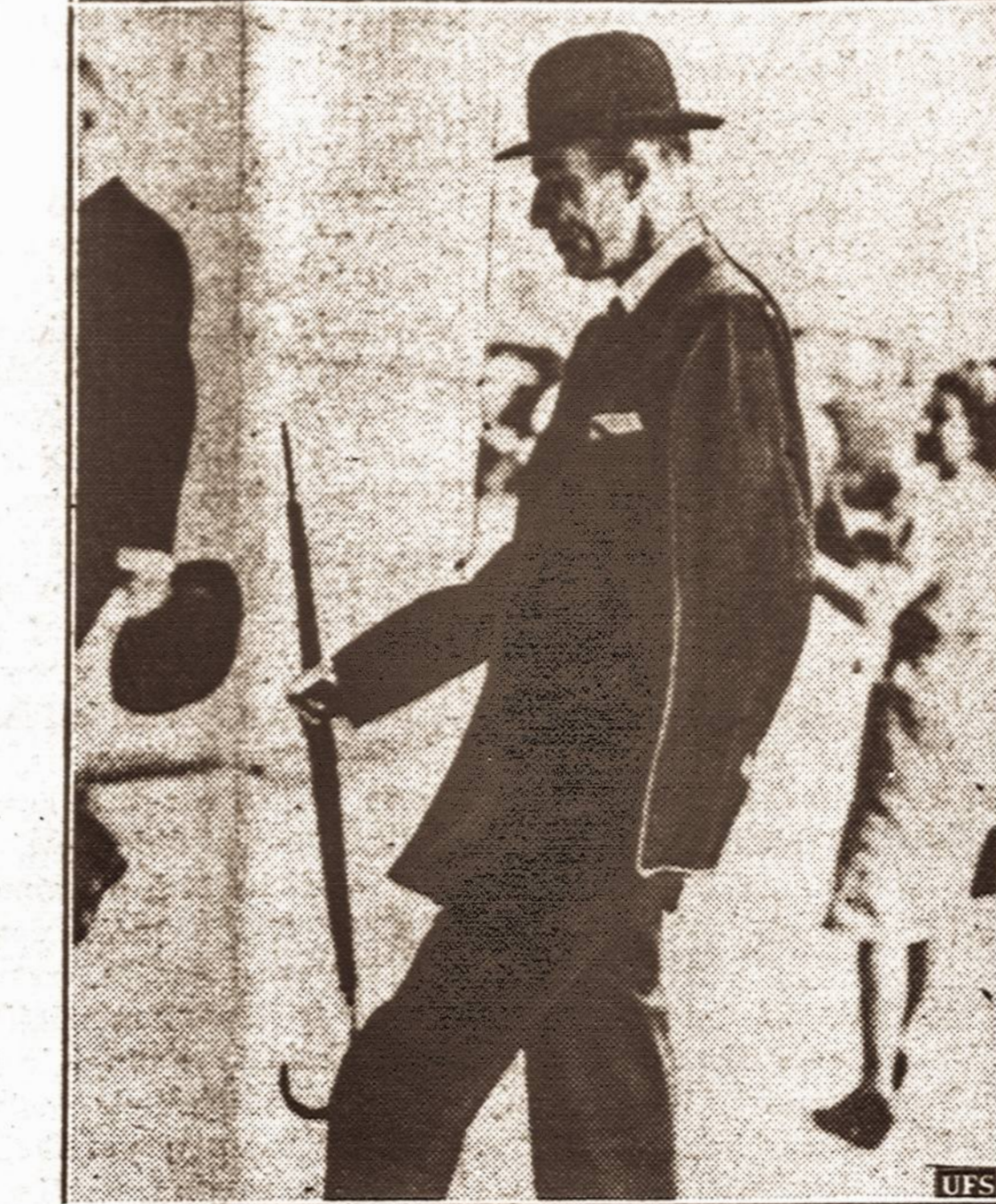
Tempimo momentu. — Anglijos Užsienių Reikalų Ministras Viscount Halifax, ant kurių pečių, šiais neramumų laikais guli didelė atsakomybė.

KLAIPĖDA. — Rytprusių ir Klaipėdos krašto gauleiteris Erich Koch paskelbė straipsnį žurnale „Wille und Macht“ (Valia ir jėga), kuriame rašo, kad artimiausiu laiku reikės kolonizuoti Vokietijos rytų šiaurės pasienį — Rytprūsiose nemažiau 2 milijonų žmonių iš Reicho gilumos.