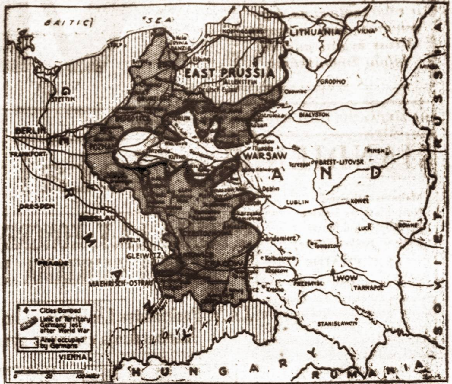
Vokiečiai vakarų Lenkijoje. — Vokiečių kariuomenė užėmė beveik visą vakarų Lenkiją. Tamsiai nubraižyta Lenkijos dalis yra vokiečių rankose, nors vakar vokiečių motorizuotos dalys jau buvo pasiekusios Lvovą ir Balstogę.

Atspėkite, kas taip smarkiai šūkauja Lenkijos užtarnimui? Nagi Chicago komunistų dienraštis! Jis net pabrėždamas smerkia Angliją ir Prancūziją, kad jos nesistengia kiek gali-