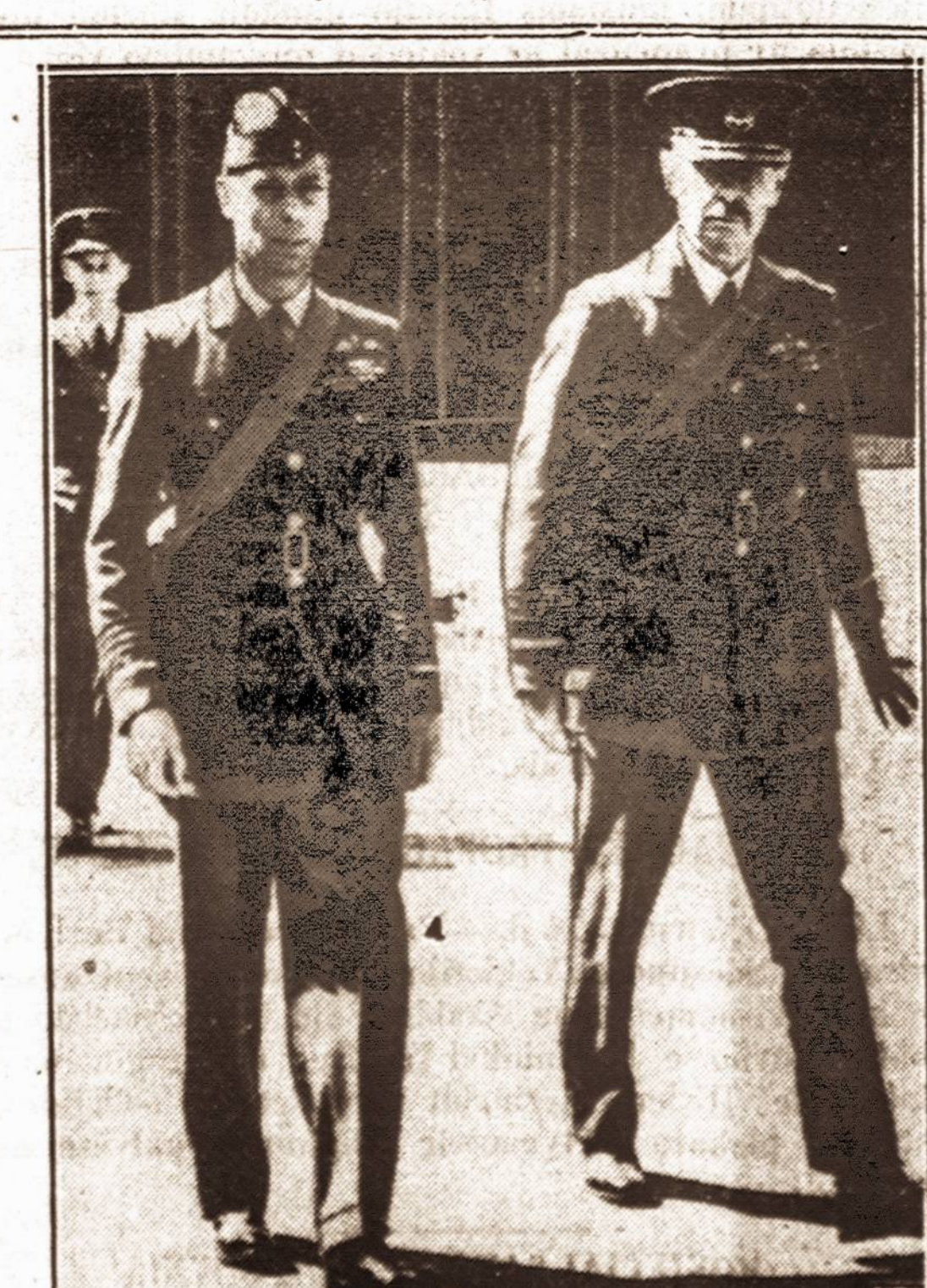
Karalius karininko uniformoje. — Anglijos Karalius Jurgis Anglijos karo aviacijos uniformoje. Jis ypatingai domisi Anglijos karo aviacija, kuri yra viena geriausių Europoje.