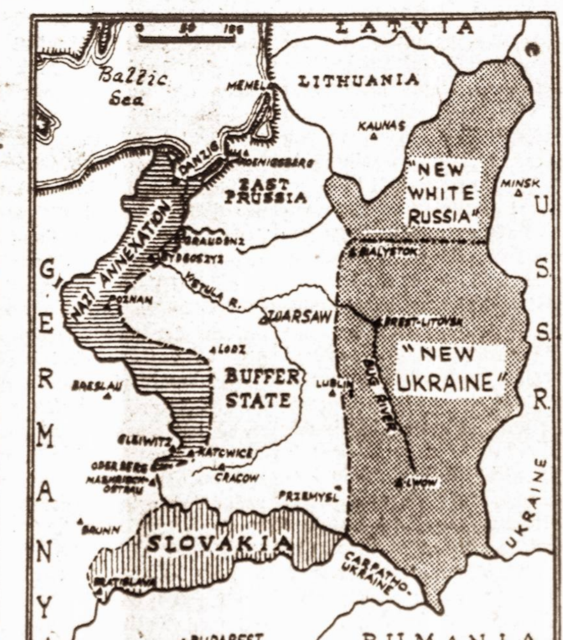
Lenkijos padalinimas. — Brūkneliais pažymėta Lenkijos dalis atiteks naciams. Rytinė Lenkija priklausys sovietams, Centralinė Lenkija "ilks" kaip "bufferinė" valstybė.

BASLE, Šveicarija, rugs. 22 d. — Prancūzų armija baigė užimti suvirš 80 miestų ir didelių kaimų Saar Moselle rajone.