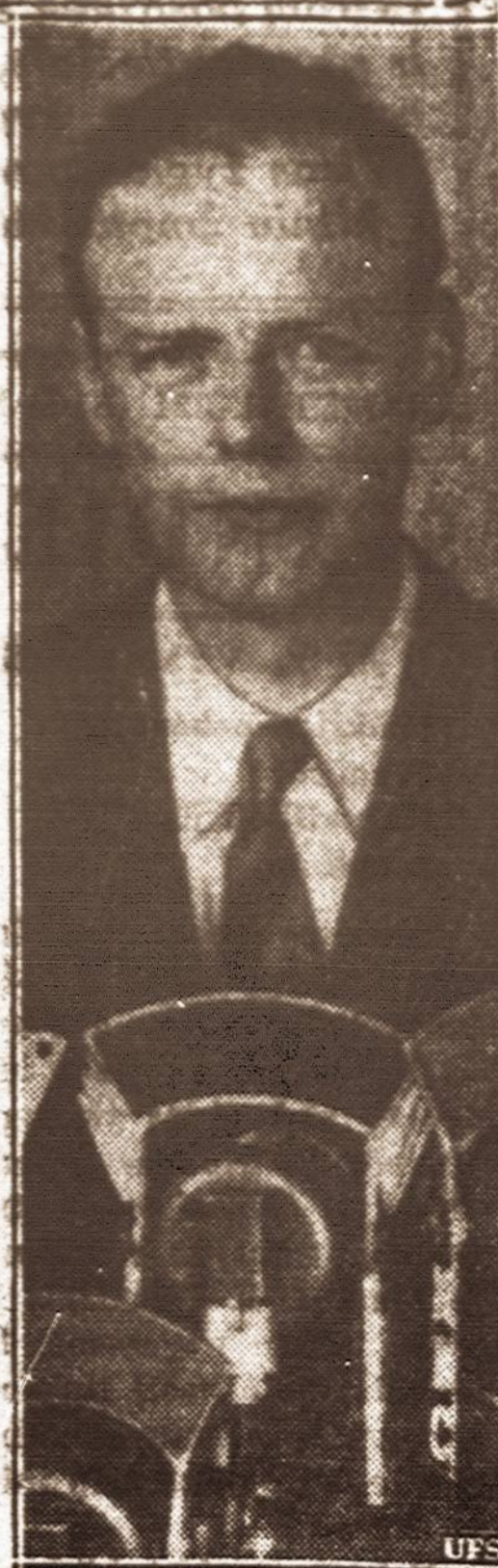
Perspėjo. — Pulk. Charles Lindbergh kalba per radijo iš Washington, perspėdamas Amerikos žmones, kad neatsargus žingsnis įvėls J.A.V. į karą.