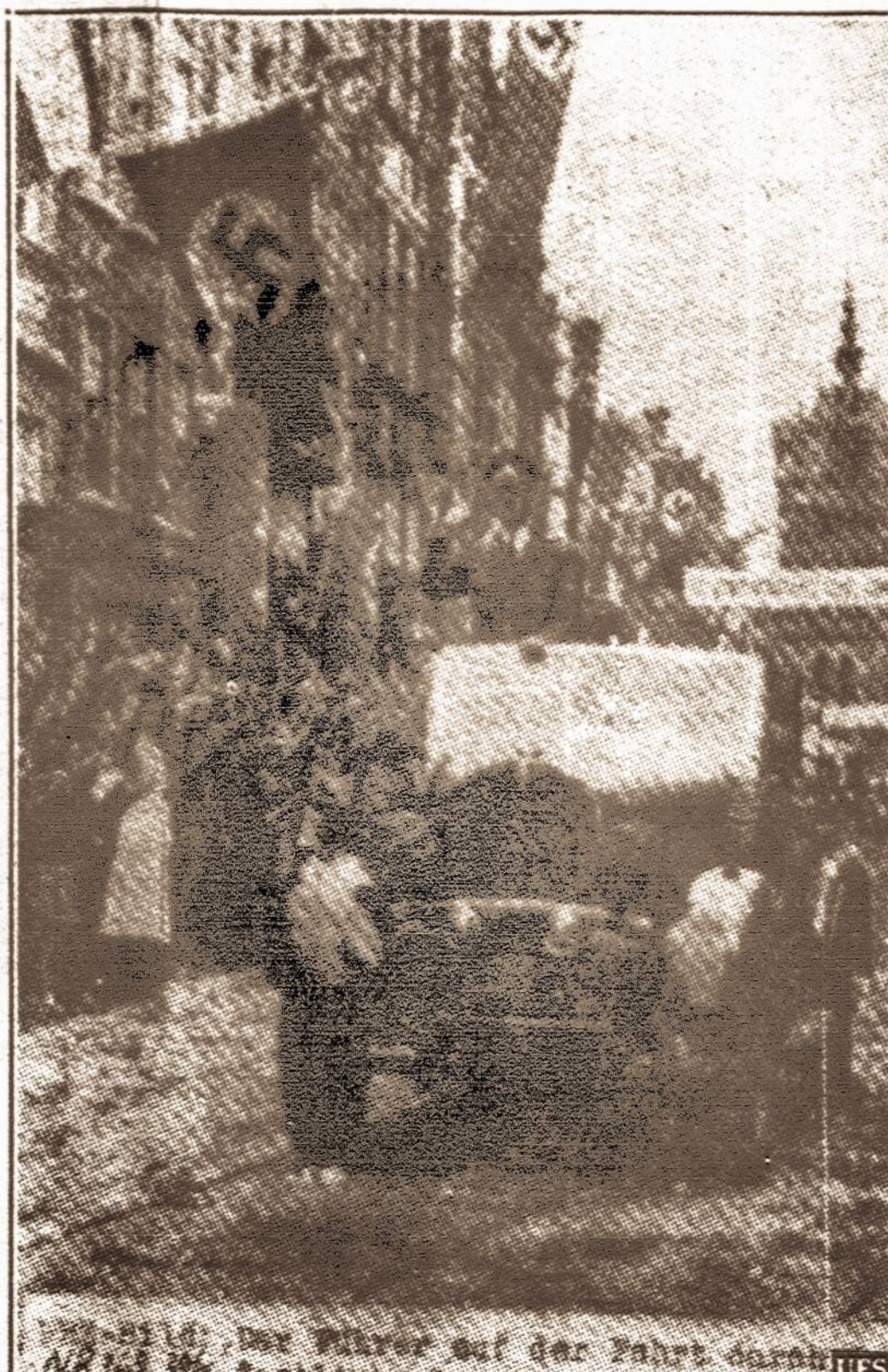
Penkios bombos už vieną. — Adolfas Hitleris sutinkamas vėliavomis pasipuošusiam Dancige. "Penkios nacių bombos alijantams, už kiekvieną alijantų bombą mums" — grąsino kartą Hitleris.

Kokia linkmė ši revoliucija eis — sunku pasakyti.