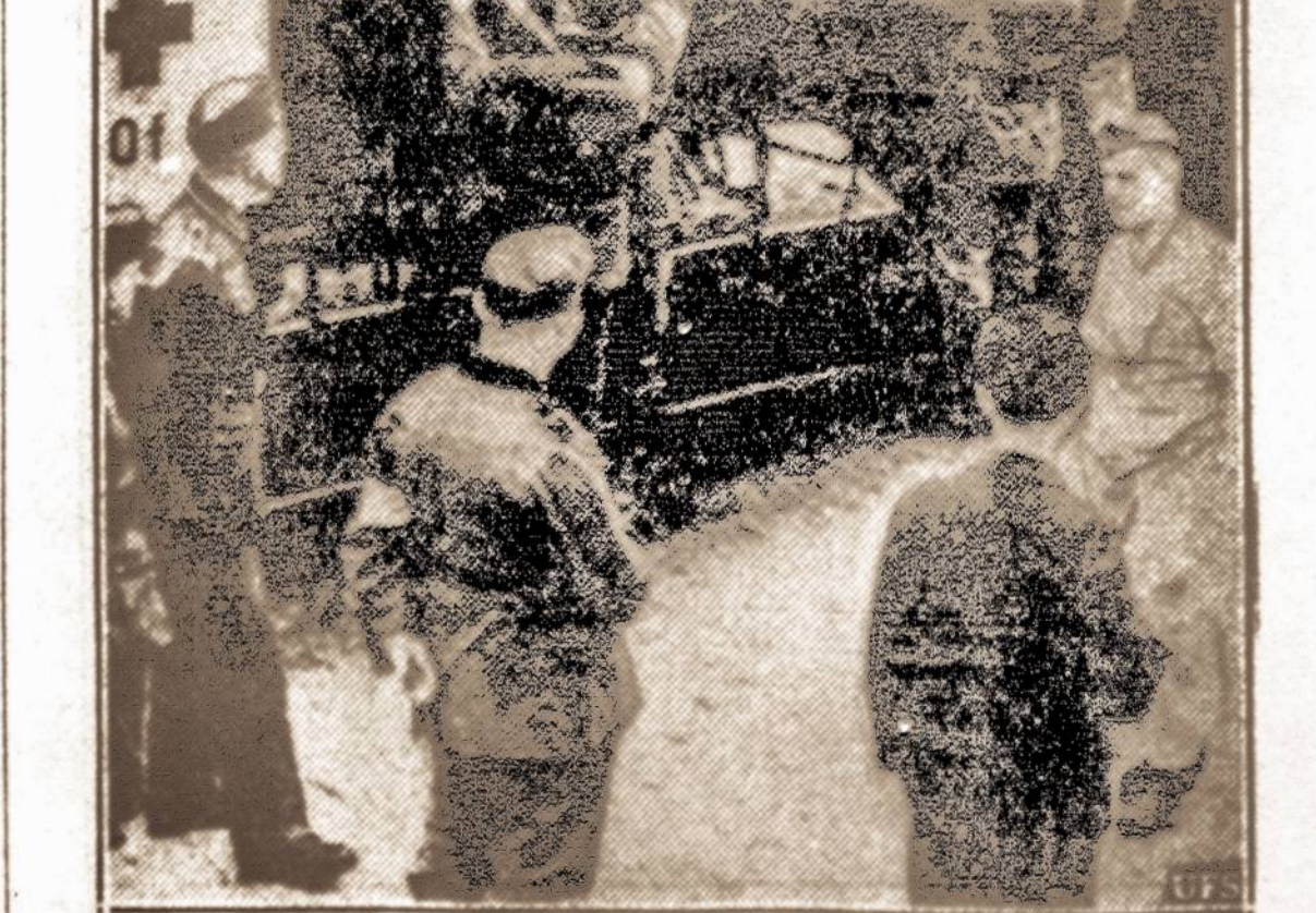
Sužeistas naciis. — Vokiečiai laiko didelėje paslaptėje apie skėčių sužeistųjų, bet nacių cenzūra leido ši vaizdą užsienio laikraščiuose atspausdinti.

Prancūzų karininkai sako, kad Prancūzija karas užklupo nevisai dar pasiruošusi, tačiau per keletą savaičių prancūzai sugebėjo susitvarkyti ir dabar visa prancūzų kariuomenė pilnai pasiruošusi mūšiams. Tai, esą ne 1914 metais, kai vokiečiai pradėjo slav prancūzų kariuomenę beveik iki pačio Paryžiaus.