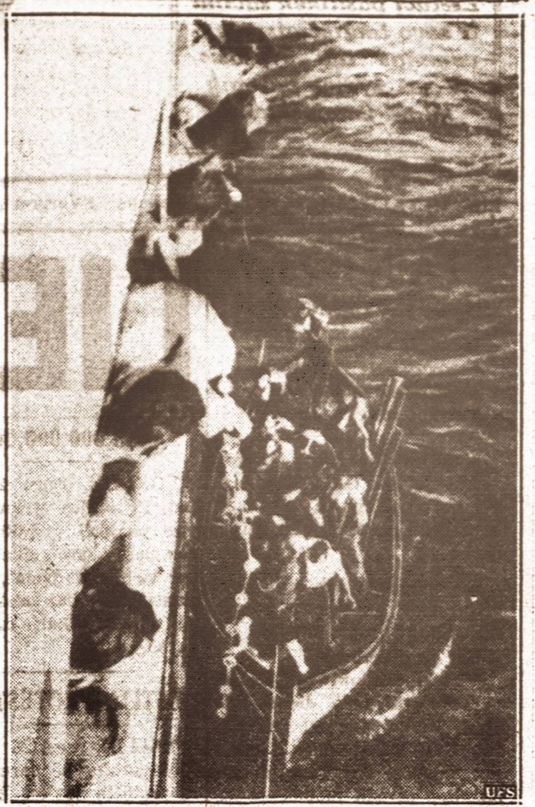
Išsigelbėjimas. — Britų p. rekybos laivo "Karifistan" įgula perlėpa į Amerikos laivą "American Farmer".