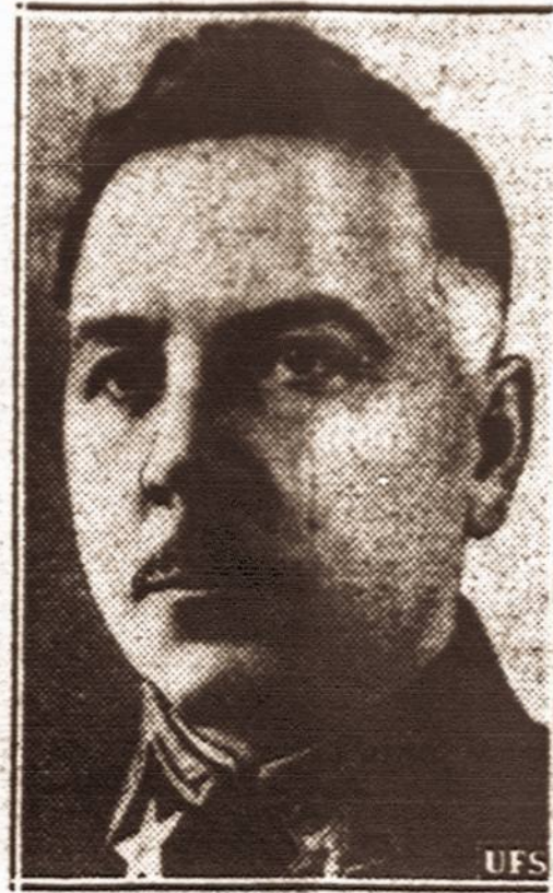
KL. VOROŠILOVAS.— Sovietų kariuomenės vadas, dalyvavęs derybose su Kaziu Urbšiu.

Bet palaukit. Kam čia per daug kalbėti. Pasaulio spauda jau kužda, kad ir Vokietijoj ir Sovietų Rusijoj jau žybcioja revoliucijos žiburėliai. Tai, ot, patys faktai dar geriau parodys, kas yra tas komunizmas ir nacionalsocializmas.