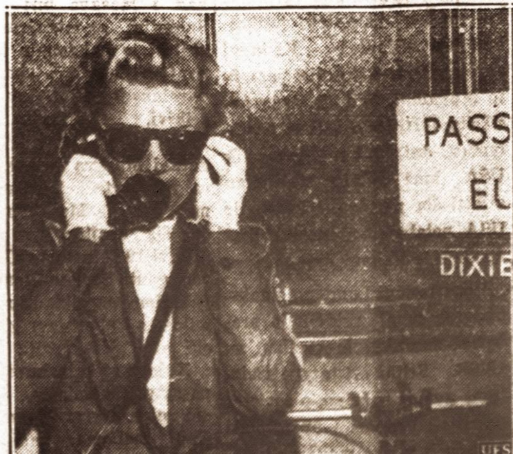
PRANCŪZIJON.—Kino žvaigždė Annabella išskrido transatlantiniu lėktuvu Europon, kad galėtų namon parsivežti savo tėvus ir dukrele.

krito trys anglų lėktuvai ir trys vokiečių, vėliau skrido dar vienas anglų lėktuvas. Pasilikęs vienas anglų žvalgybos lėktuvas kovai pasibaigus baigė savo uždavinį ir sužeistai į galvą žvalgu grįžo į bazę. Besileidžiant lėktuvui jis užsidegė, bet jaunais lakūnas išsokęs tuojau ištraukė savo sužeistą žvalgą ir, žinoma, foto nuotraukas, kurias tuojau perdavė savo vadui.