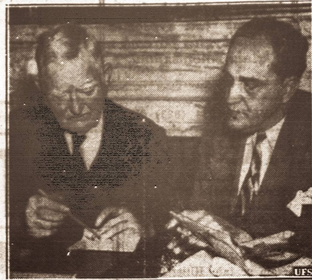
PASITARIA.—Vice prezidentas J. N. Garner pasitaria su senatoriu Sherman Minton kaslink neutralumo įstatymo pakeitimo reikalą.

Pasikalbėjimuose su anglų karo aviacijos vadais pastebėta, kad anglai dabartinius mūšius vakaruose laiko tik preliminariniais susisąjūmiais ir pozicijų paruošimais didesnės kovoms. Tačiau jie neabejoja, kad nežūrint ką vokiečiai ore bandys daryti, ir kiek karo lėktuvų siųs, angliai yra pasiruošę juos sutikti lygiai tokiais pat jėgomis, jei nedidesnėmis.