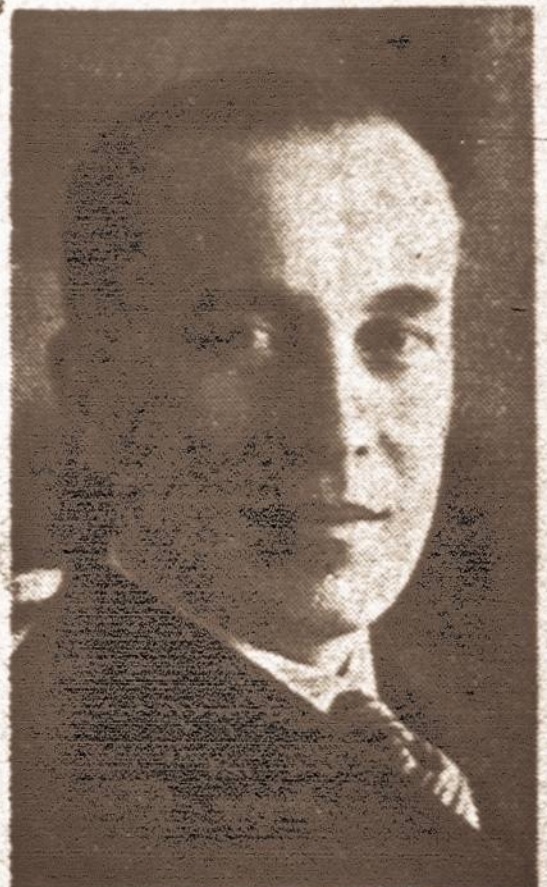
KAZYS URBSYS.— Užsienių Reikalų Ministras.

Kokių reikalavimus sovietai pastatys suomiams, kol kas dar nėra tikrai žinoma. Tačiau, manoma, kad sovietai mažiausia pareikalaus duoti jiems teisę užimti nekurias Suomijos oro ir jūrų bazes. Be