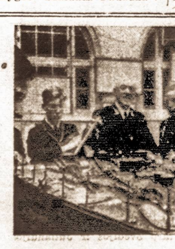
Jūrų kadetai. — Did. Britanijos laivynas turi puikias jūrų kadetus praktiškai sutrijuojant jūrų mokslus.

KAUNAS. — Žinoma rašytoja ir veikėja Sofija Čiurlionienė paaukavo per DULR užsienių lietuvių mokykloms 100 knygų "Dvylika brolių jaudvarniais" ir 30 knygų "Šventmarės".