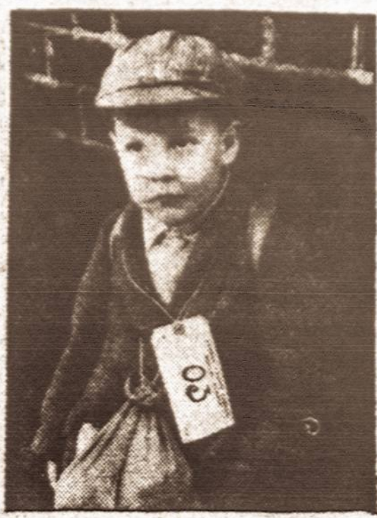
March of Time photo Atskyrė... — Šis jaunutis londonietis turėjo palikti savo tėvus Londone ir su kotele ir terbele ant kaklo keliauti kažkur toliau nuo Londono.

— Londone nakties metu įvyksta abai daug nelaimių dėl karo metu neapšviestų gatvių.