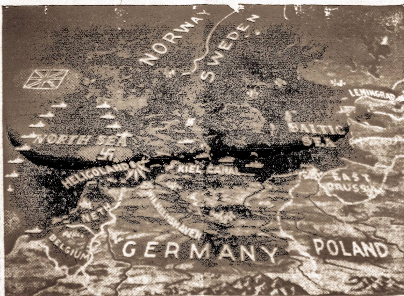
Jūrų karas. — Šis artis tintis žemėlapis parodo, kaip aliantai ir vokiečiai užbloka-vo šiaurės jūrą. Baltais taškeliiais pažymėtas sąsauris tarp Švedijos ir Jutiandijos pusiasalio parodo kur naciai prikišo daugybę jūrų minų. Tokios minos pluduriuoja ir netoli Heligolando salų. Britų užminuotos darys pažymėtos britų vėliava, o nacių — hakenkreucu.

LONDON, spalio 19 d. (INS). — Britų žvalgybinė aviacija šiandien vėl atliko pasekmingus skridimus virš šiaur-vakarinės Vokietijos.