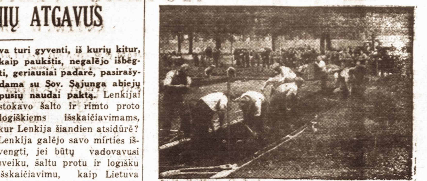
Kasa požeminius apkausus. — Sitapati tai Londono gyvenojai kasa gražiūose parkuose požeminius apkausus, kuriūose londoniečiai slepis nuo oro atakų. Jei načiai kada mėgins bombarduoti Londoną.