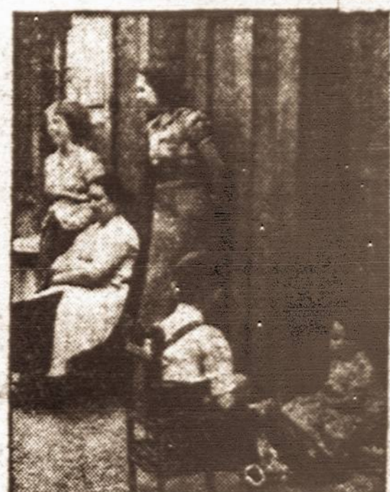
Nesibijo... — Šitie londoniečiai nenori apleisti savo namų ir vykty kur nors toliau už Londono, kur būtų saugiau gyventi laike karo.

HELSINGFORDS, spalio 20 d. (AP). — Sovietų armija jau užima savo postus Estijoje pagal pasirašytą sutartį tarp Estijos ir USSR. Ta proga naujasis Estijos ministras pirmirtininkas pareiškė, kad Estijos nacionalinė armija bus smarkiai padidinama. Šiaip, sovietų armijai užimant savo postus, jokių neramumų nebuvo. Kai kurie susirūpino dėl nepaprastai didelio sovietų karo laivų skaičiaus, kurie atvyko į Tallinną. Tačiau sovietai pasiaiškino, kad 18 karo laivų atvykimas esąs susijęs su kariuomenės provizijos pristatymu ir nėra koks uosto užblo-kavimas karo laivais.