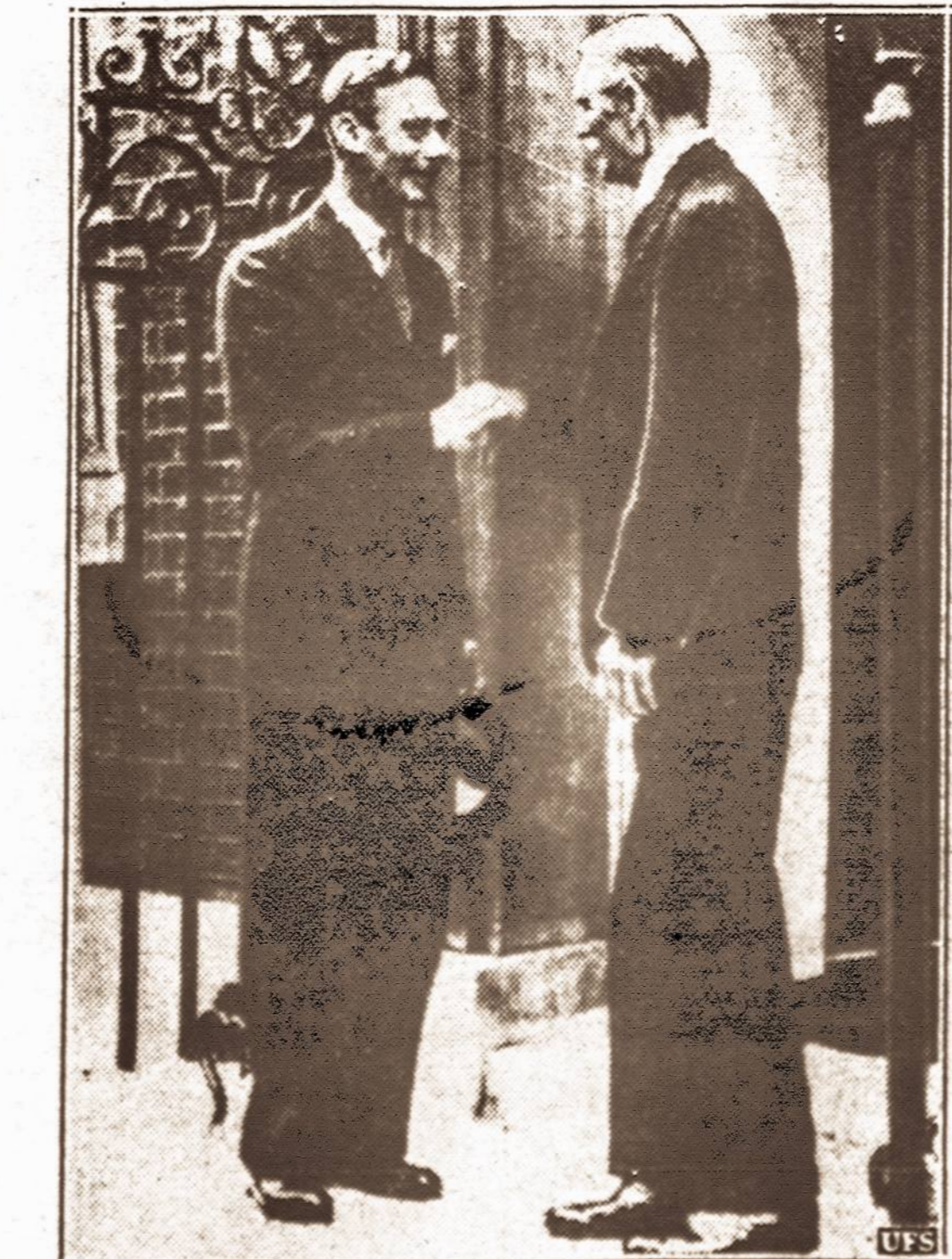
Karalius paaukė. — Karalius Jurgis VI sveikinasi su premjeru Chamberlainu, kurį karalius pasisaukė apitarti labai svarbius karo meto reikalus.

kad ir ištikimi Lietuvos interesams lietuviai taip aklaip pulyti į Maskvos glėbį. Visiems patriotingiems lietuviams pirmiausiai rūpi Lietuvos interesai, o ne Maskvos ar kieno kito. Patriotingi lietuviai buvo ir pasilikę ištikimi Lietuvai, nežiūrint kokiomis priemonėmis bandys komunistai jiems įbrukti Maskvos komunistinius mirdolus.