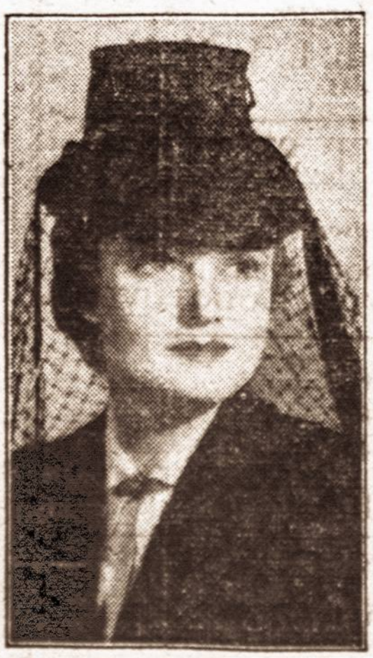
Anna Neagle, įžymiausia Anglijos kino artistė, su paskutinės mados skrybėlaite. Šydas e. as padarytas iš vilnų.