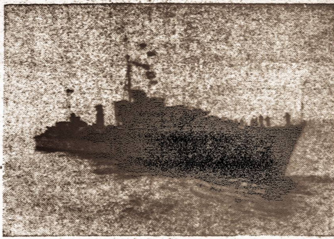
Naikintumai. — Šitokio tipo britų naikintuvai gali pasiekti 45 sausumos mylių per valandą greitį ir yra baisiausias nacių submarinams ginklas.

ANKARA, spalio 23 d. (AP). — Nors Turkija pasirašė sutartį, kuri apima Turkijos kaip militarinius taip ir ekonominius santykius su alijantais, tačiau naciai vis dar tebeveda derybas su turkais dėl platesnių prekybinių santykių išvystymo su Turkija.