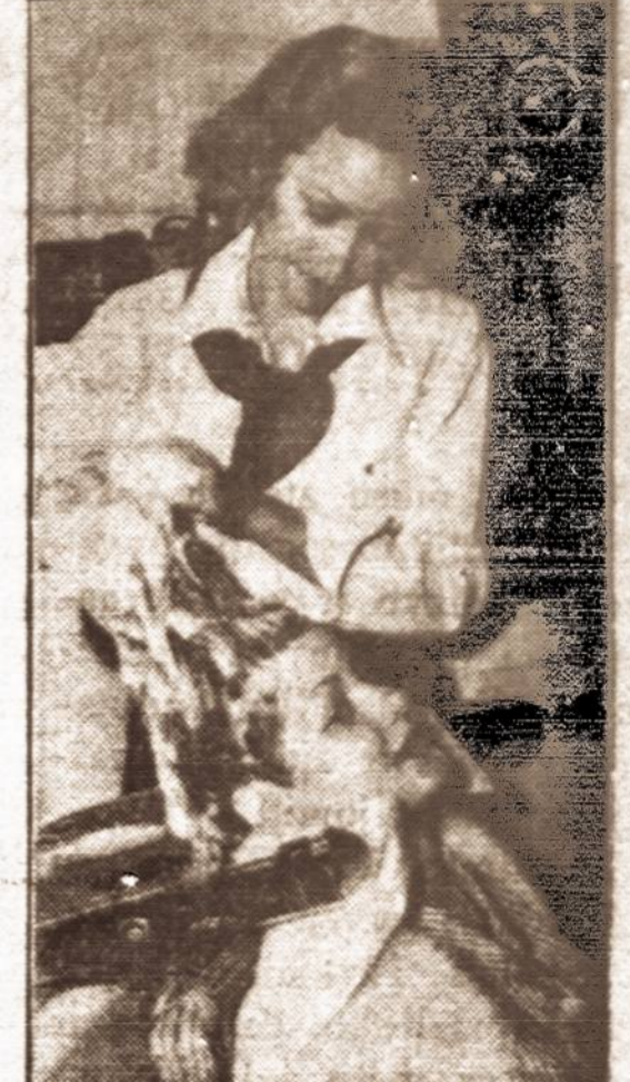
Preš pasirodant. — Lucille Ball, RKO Radio artistė šitaip turi vargti kol jos kirpėja sutaiso jos plaukus taip, kaip jie turėtų atrodyti laike pasirodymo prieš jos garbintojus...

Viena Amerikos aukštoji mokykla savo studentėms patiekė įdomią ankieta: "Kiek laiko studentė praleidžia savo gražinimuisi?" "Kiek ji išleidžia tam tikslui pinigų?" Rezultatai buvo nuostabūs. Būsimosios šeimininkės ir motinos kosmetikams išleidžia 25% savo pajamų, o prie veidrodžio išėdi 60 valandų per mėnesį. Tai buvo slaptas, bet nuosiirdus prisipažinimas. Statistika rodo, kad didžiausias pajamas ir pelną turi "grožio pramonė". Visas pasaulis nori būti gražus. — Iš Orano į Ispaniją grįžo 150 respublikonų milicininkų. — Per įvykusį Smirnoje žemės drebėjimą žuvo daugiau kaip 200 žmonių.