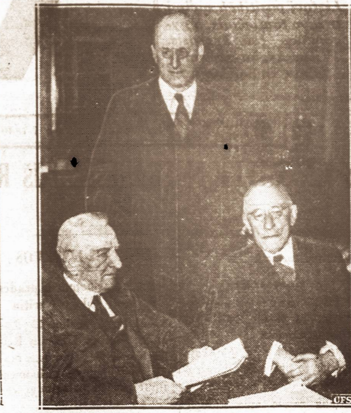
Tariasi apie finansus. — Senatorius C. Glass, izdo sekretorius Morgentau ir jo tėvas H. Morgentau, tariasi apie U.S.A. finansinius reikalus, kai Europos karas atrodė, kad tęsis ilgai.

Prasidėjo skystojo kuro taupymas. Auto susisiekimas aprėžtas. Vežikų svajoti laikai atėjo. Nežinia, ilgam ar trumpam laikui. Bet tuo tarpu konkurentams blogiau. Ir vežikai linksmesni sėdi ant savo sėdynių. Ir net arkliai jų atrodė linksmesni. Ar tai šeiminkinų nuotaika ar tai papildomas gorėrus avizų juos gerai paveikė.