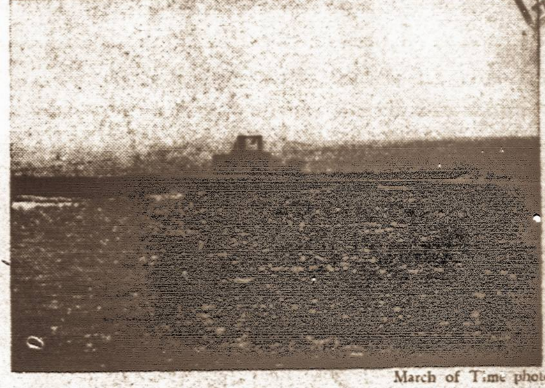
Jūros pabaisa. — Britų naujausios mados submarinas, kuris automatiskai suseka kur yra priešos submarinai.

HELINGSFORS, Suomija, spalį 24 d. (UP). — Kai suomių delegacija dar negrįžo Maskvon baigti pasitarimus su sovietais, Suomija smarkiai ruošiasi visokiems netikėtiniams, kaip tai dabartinės vyriausybės krizės galimūmi ir taip toliau.