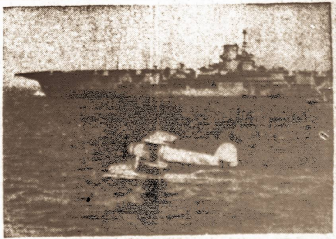
Aerodromas ant vandens. — Britų naujausios konstrukcijos lėktuvnėis ir šalia j o kariskās hidroplanas.

BERLIN, spalį 24 d. (INS). — Vokiečiai mėgina palaikyti gerą ūpą Vokietijos žmonių tarpe, skelbdami, kad naciai pasekmingai puolė britų laivyną ir išstūmė prancūzų armiją iš Vokietijos teritorijos. Vokiečiai, nežiūrint šitų raminiųų, jaučiasi labai nusimine.