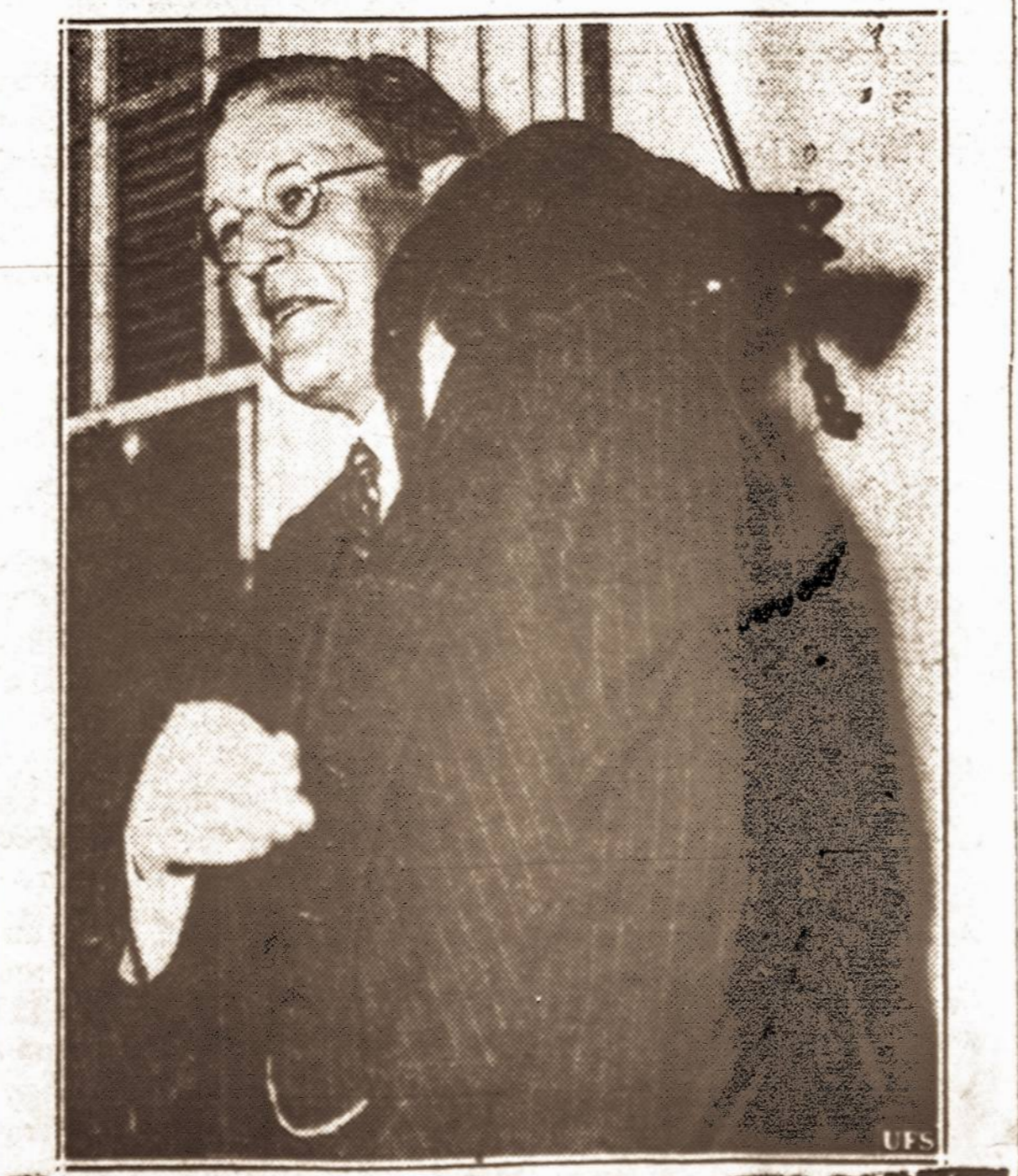
Netiki prietarams. — Ju oda katė prietaringiems žmonėms reikiama nelaimė. Tačiau, naujasis britų ambasadorius Amerikai, įteikęs kre dencialus prezidentui, sutiko juoda katę ir ją taip ant peties kurį laiką nešiojo.

Iš Estijos vis pranešama, kad nežiūrint spaudoje paskli-