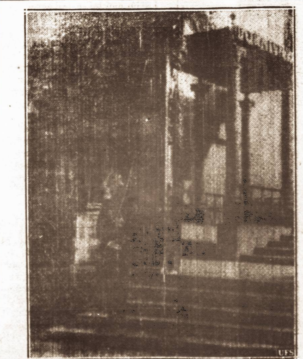
Prie Pilsudskio grabo. — Nacių sargybinis prie Pilsudskio grabo. Lenkai vadi na šį vokiečių žygį biuriu ciznmu.

Atsivėlgiant į gyvenimo reikavimus, įstatymo projektas numato išimčių, kuomet bus leidžiama įsigyti ir mažesnius kaip minimaliam ūkiui nustatytą žemės plotus iš stambesnių ūkių.