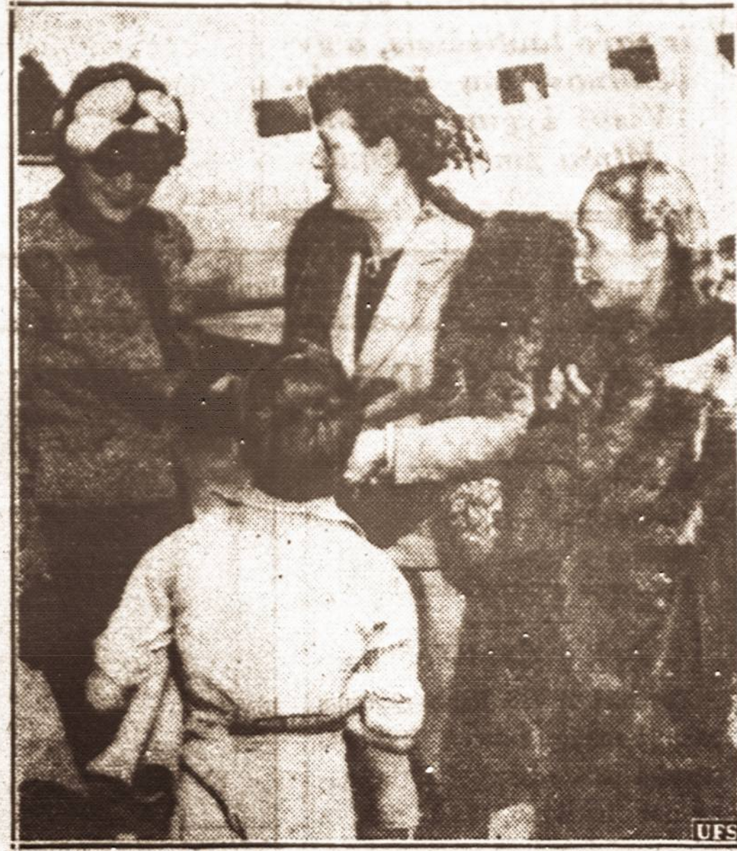
Oru tiesiog į Reno. — Kino žvaigždė Miriam Hopkins, dešinėje, tik ką prieš išskridimą į Reno, kur galima greitai gauti divorsai. Ji nori divorsuoti Anantolo Litvak, filmų direktorių, Kairėje — Key Francis.

Tad sujungtų ginklų rūšių pratimai — visų pirma vadų mokykla. Kareivis čia pakartoja ir įsitaukia ir tą darbą, kurį pratinosi dirbti atskirų ginklų rūšių pratimuose. Tik apystovos čia panašesnės į tikro karo apystovas. Smulkiuose pratimuose daug kas tenka patičiam kareivini įsivaizduoti. Čia gi dūzgia lėktuvai, kaukia ropodami tankai, laksto greitai tankeliai, vengdami pakliūti "ant sargų" savo priešui orlikonui. Kritiškuose kauptynių momentuose pakyla dūmų uždangos, bromaceono dujų debesys priverčia dirbti uždėtomis dujokaukėmis. Pionieriai skubiai stato tiltus, lieptus, vielių klūtis, ruošia pravažiamumus per balas artilerijai ir gurguolėms. Ryšininkai skubiai vynioja plienines vielas. Jų garbė reikalauja, kad kiekvienas vadas, vis tik sustojęs kur nors lauke, tuoj gautų į rankas telefono triubelę. Bet nesitenkinama vien tik telefonu, nes telefoną gali priešai artilerijos sviedinių nutraukti (pratimuose gi nutraukia neįtraliūs karininkai, vadinamieji