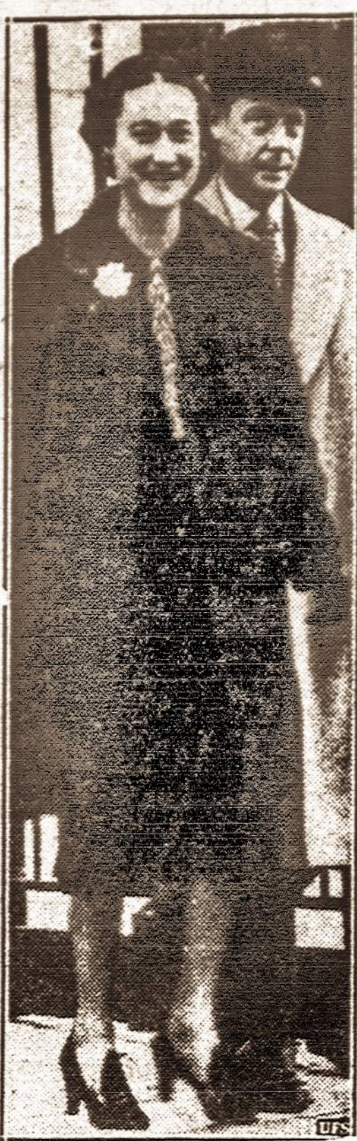
KARALIŠKOJI PORA — Windsoro kunigaikštis su žmona prieš pat išvykimą į frontą.