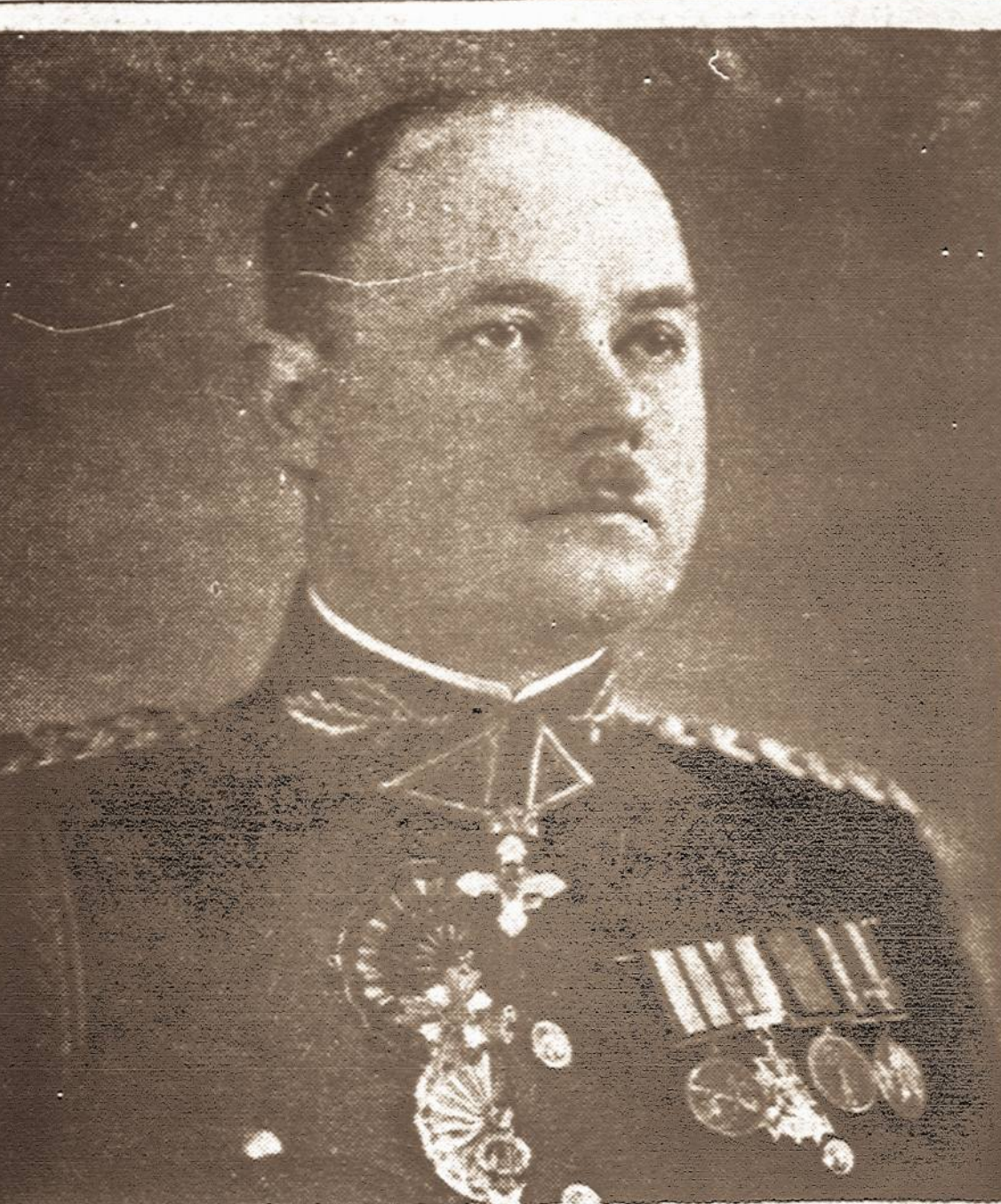
Gen. Jonas Černius, Lietuvos Ministras Pirmininkas