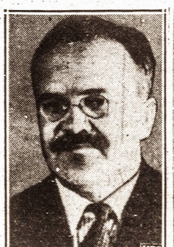
V. Molotovas, SSSR Užsienių Reikalų Ministras.