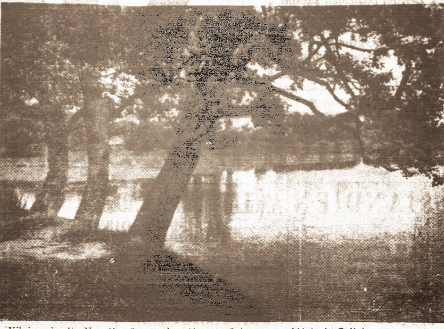
Vilniaus krašto Naručio ežero pakrantės, puošnios svyruoklais berželiais.

Didžiojo karo metu lakūnai neturėjo tokių preciziškų įrankių bomboms mėtyti. Iš 100 numestų bombų taikinį tepasiekė maždaug tik 20 bombų. Šiais laikais lakūnai prietaisų dėka bombas daug taikliau mėto.