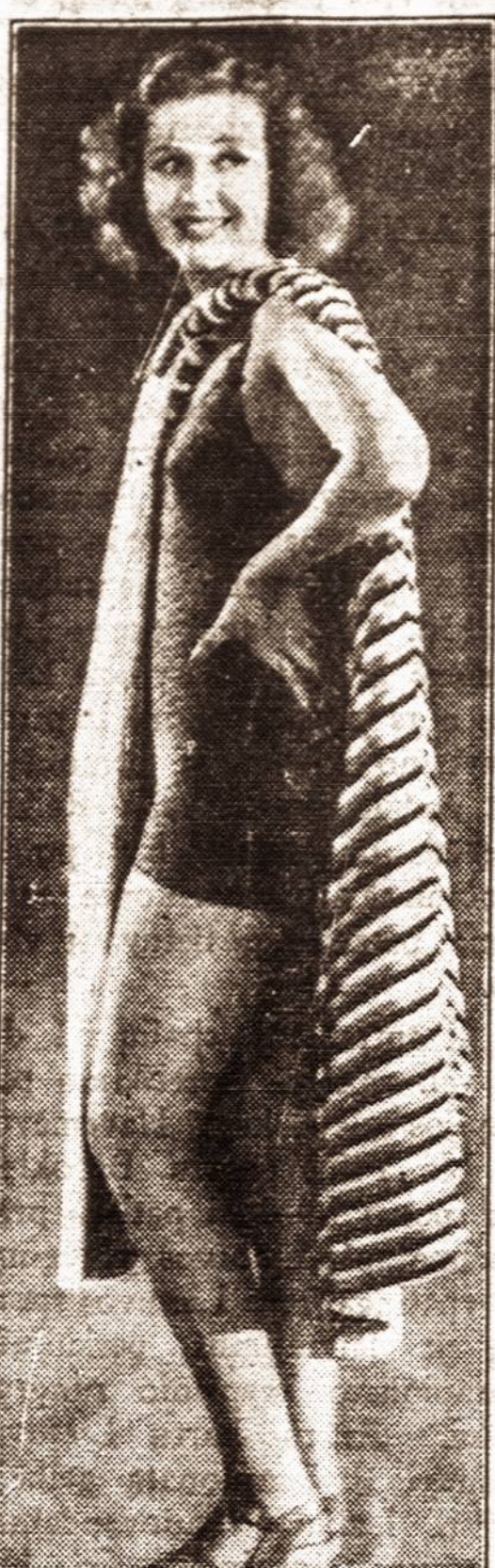
Maudymosi kostiumas. — Filmų aktorė Lynne Roberts rodo vėliausiajį Floridos maudynių kostiumą.

ti tarp rankų, dėti paruošto kamsalo. Tada užlenkti, gerai apspaudyti kraštus, suformuojant pailgą apskritus kukulius. Virti pusdytame vandeny. Paduoti su tirpytu sviestu.