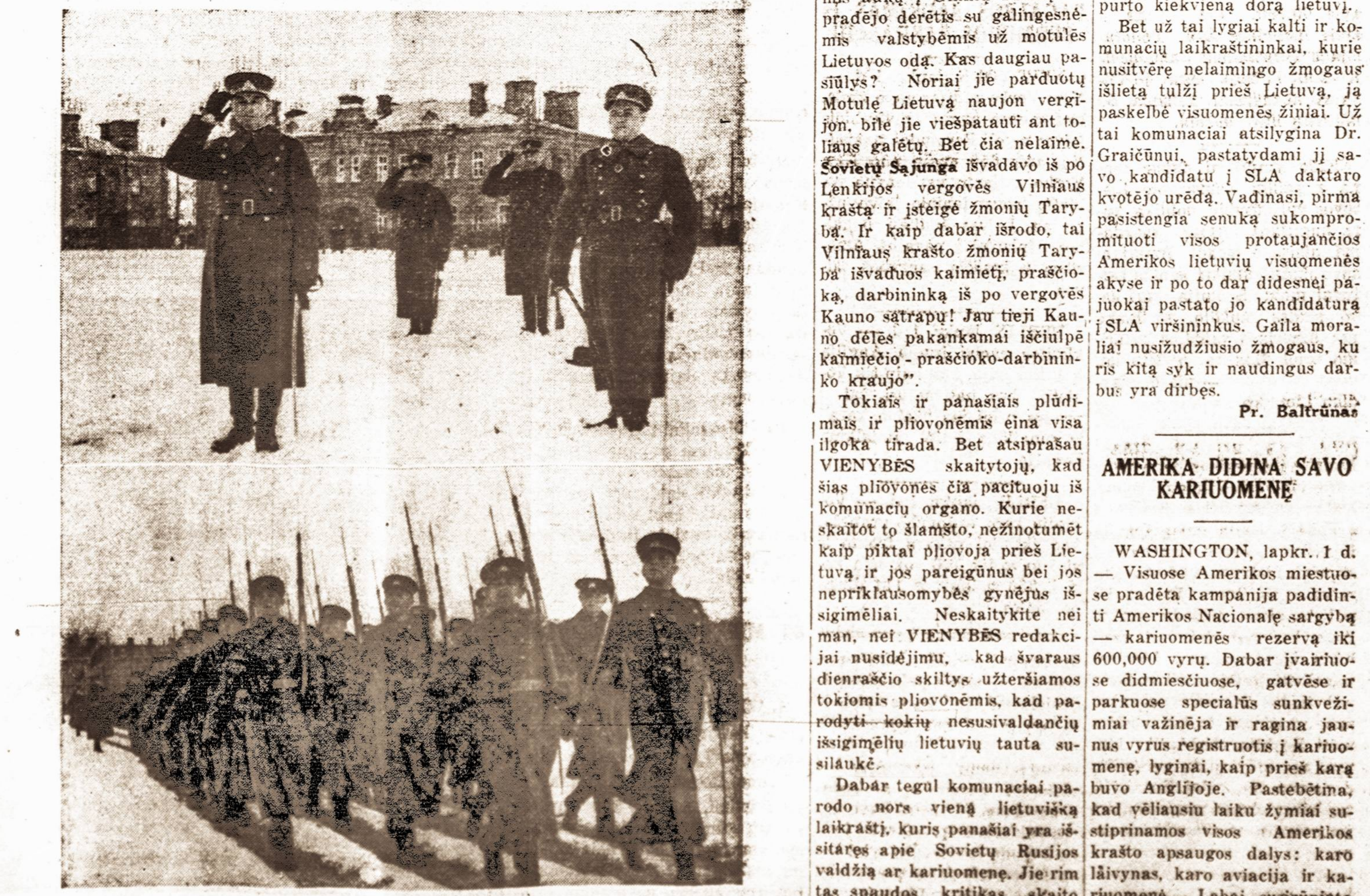
Penktojo Did. Lietuvos Kunigaikščio Kestuėjo pulko kuopa žygiuoja iškilmės maršu. Viršuje kariuomenės vadas gen. Raštikis (antras iš dešinės) ir pulko vadovybė priima parada

— Visuose Amerikos miestuose pradėta kompanija padidinti Amerikos Nacionalę sąrgybą — kariuomenės rezervą iki 600,000 vyrų. Dabar įvairiuose didmiesčiuose, gatvėse ir parkuose specialūs sunkvežimiai važinėja ir ragina jaunus vyrus registruotis j kariuomenę, lyginai, kaip prieš karą buvo Anglijoje.