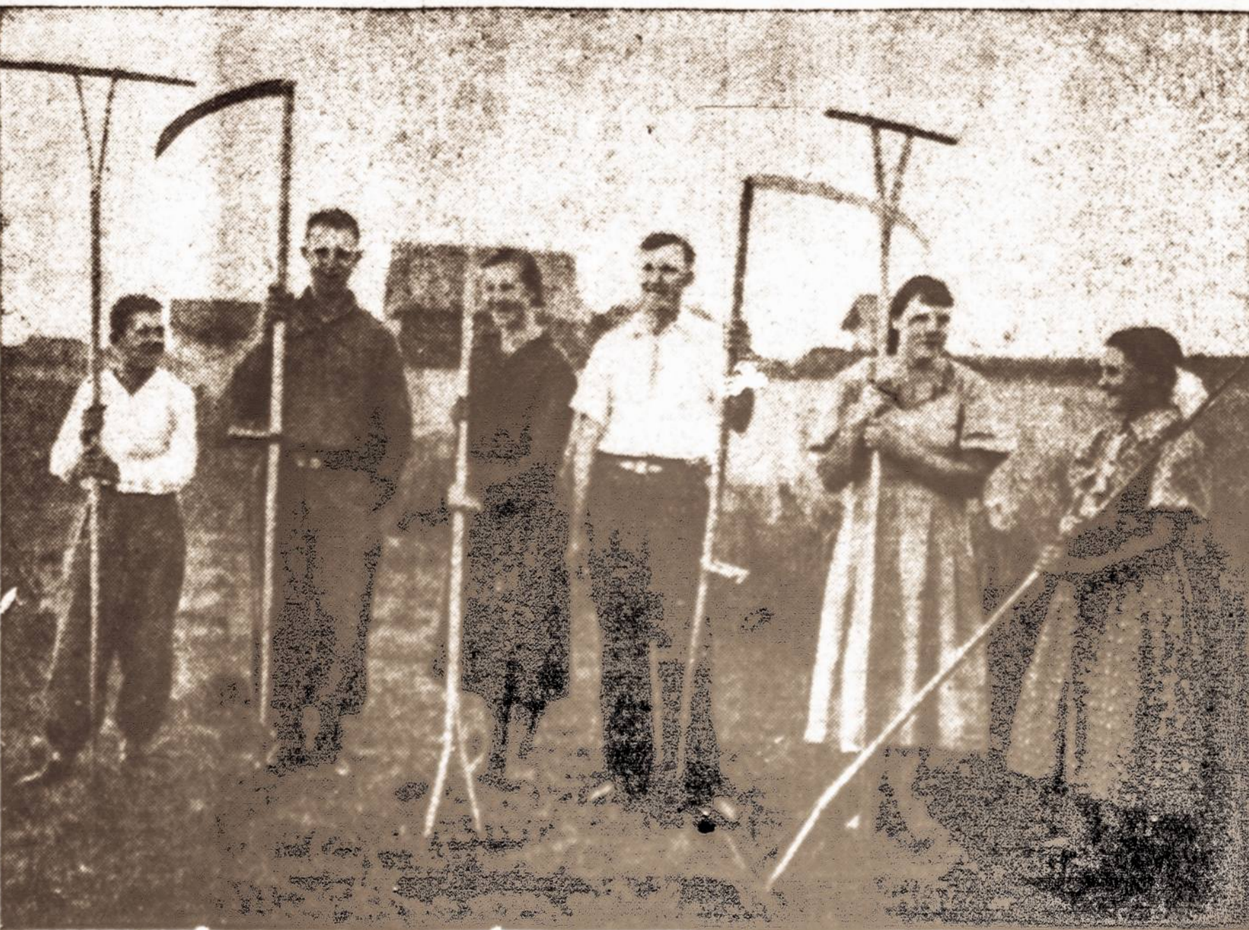
Vilnių vaizdas. — Vilniaus krašto lietuviai mokėsi, vasaros atostogų metu, padeda savo tėveliams dirbti laukų darbus, kartu stiprindami ir savo sveikatą gamtos prieglobsty.

Washingtonas kol kas nuo bet kokių komentarų dėl tos kalbos susilaikė.