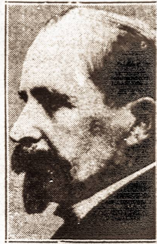
Suomijos Prezidentas Kyosti Kallio

KAUNAS. — Leščių, Perne-ravos valsc., klebono šeimininkė per audrą buvo išėjusi į laukus parsinešti paliktus daiktus, tačiau ją pakėlęs nepaprastai stiprus vėjas ir nusviedė net keliolika metrų toliau. Moteris sunkiai sužeista.