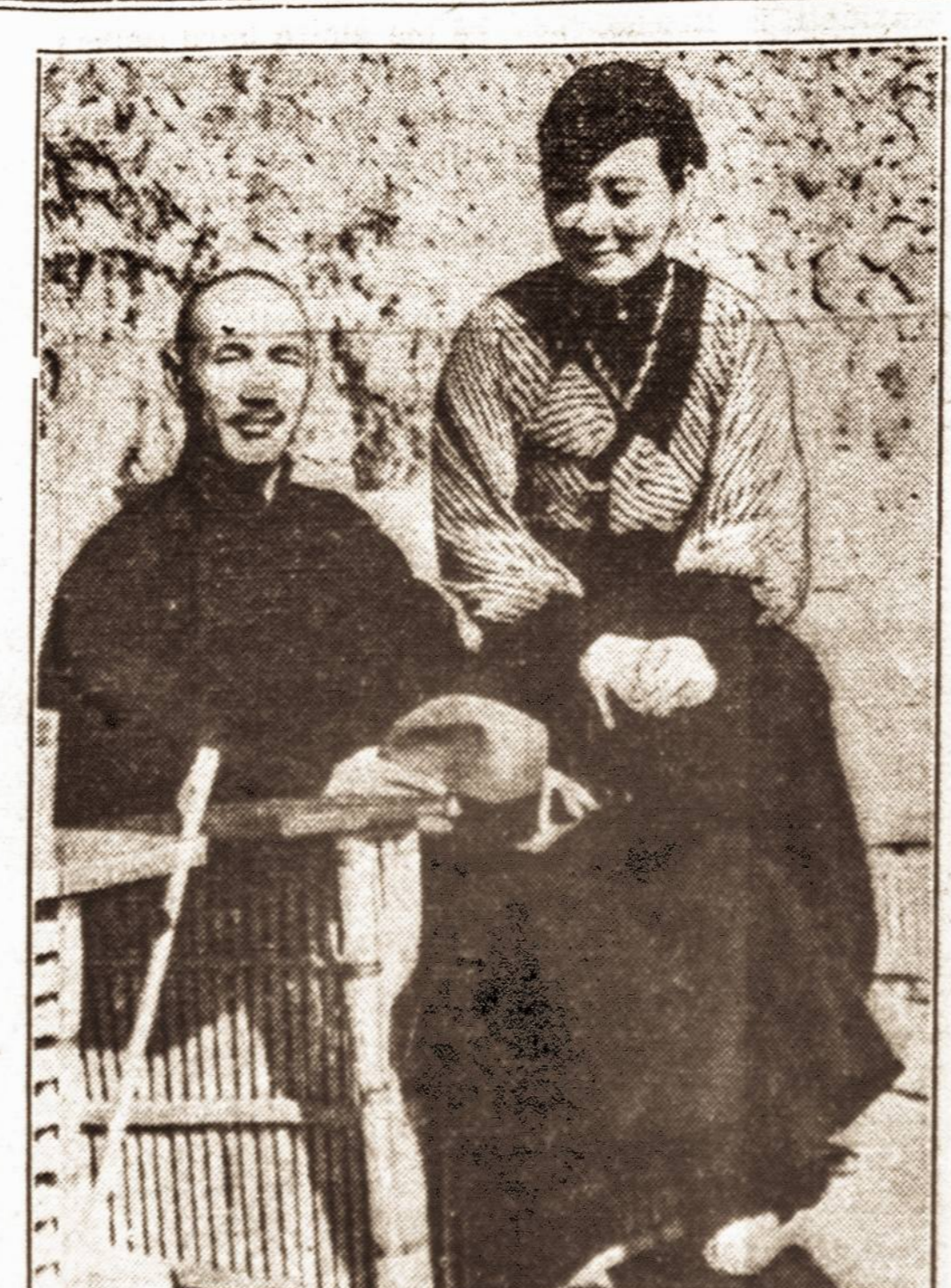
Kinija kariaus. — Generolas Čian Kai Šekas, Kinijos kariuomenės vadas, šiomis dienomis pareiškė, kad Kinija kariaus su Japonija iki galo. Paveiksle šale jo sėdi jo žmona.

SKIEMONYS. — Neseniai Skiemonių miestely mirė mažiūnas sav. lenkas. Jis klausydamas radijo pranešimus apie Lenkijos užkariavimą ir padalinimą taip susijaudino, kad nesirgęs ir mirė. Buvo jam sesė, apie 80 metų amžiaus.