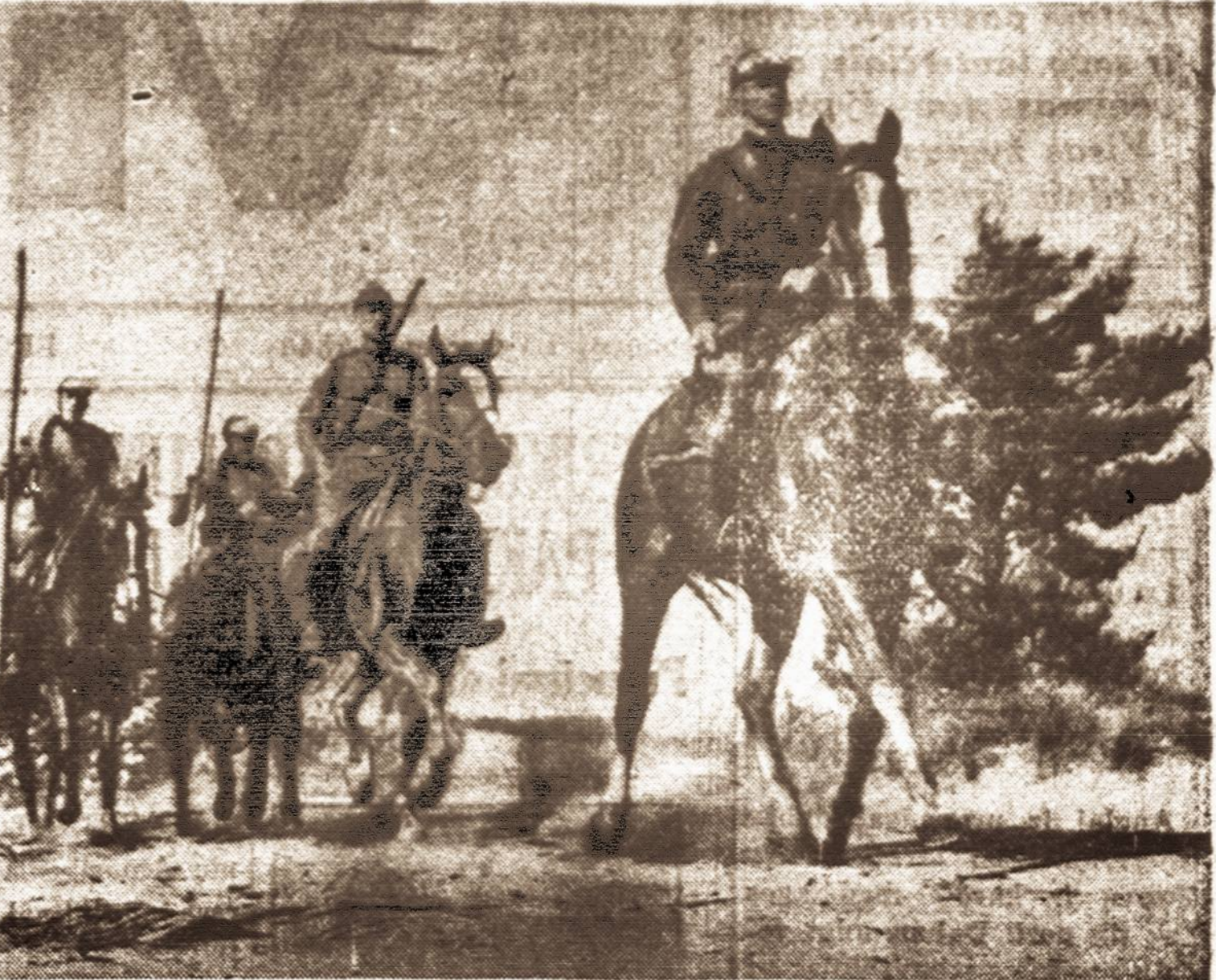
Lietuvos šaunųjų raitelių žvalgų būrys. Jie dabar budriai saugoja Lietuvos sienas.

Sovietai gražina mums Vilnių, bet budėkime, kad užtai nepaimtų visos Lietuvos.