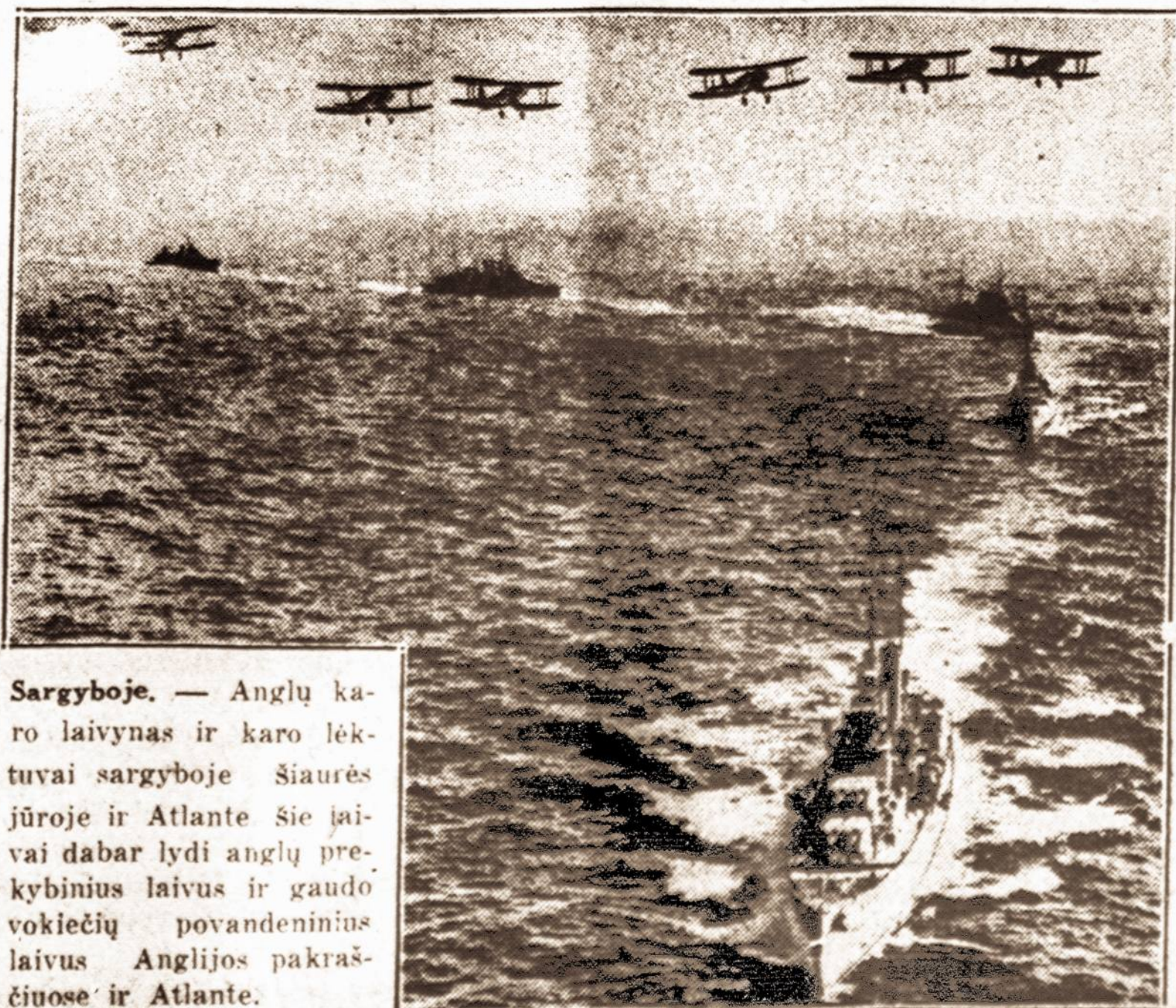
Sargyboje. — Anglų karo laivynas ir karo lėktuvai sargyboje šiaurės jūroje ir Atlante siejimai dabar lydi anglų prekybinius laivus ir gaudo vokiečių povandeninius laivus Anglijos pakraščiuose ir Atlante.

LONDON. — Anglijos admiralteto žiniomis, anglų karo laivai jau pastebėjo ir seka vokiečių paimta Amerikos prekybinį laivą "City of Flint", kuris dabar iš Rusijos plaukia į Vokietiją. Anglai laivą jau seniai seka. Norvegijos pakraščiuose, tačiau jo neužpuolė. Jeigu laivas neišplauks iš Norvegijos teritorialinių vandenių, tai anglai prižadėjo jo neliesti. Manoma, jei viskas eis tvarkoje, tai "City of Flint" pasieks Baltijos jūrą rytoj.