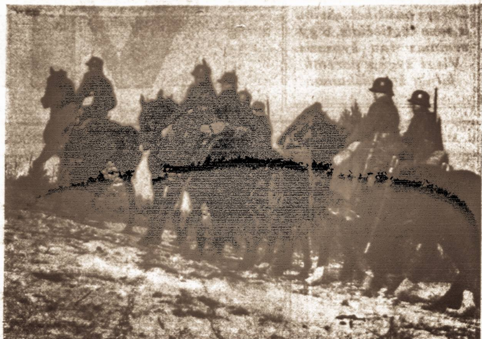
Ant bėrų žirgelių, viešuoju keleliu, jōja mūs broiečiai į Vilniaus mīsetelį.