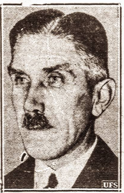
Franz Von Papen

ROMA, gruod. 8 d. — Italijos vyriausybė pakartotinai pažymi, kad Italijos Vokietijos santykiai yra nepasikeitę ir toliau bus palaikomi draugiški.