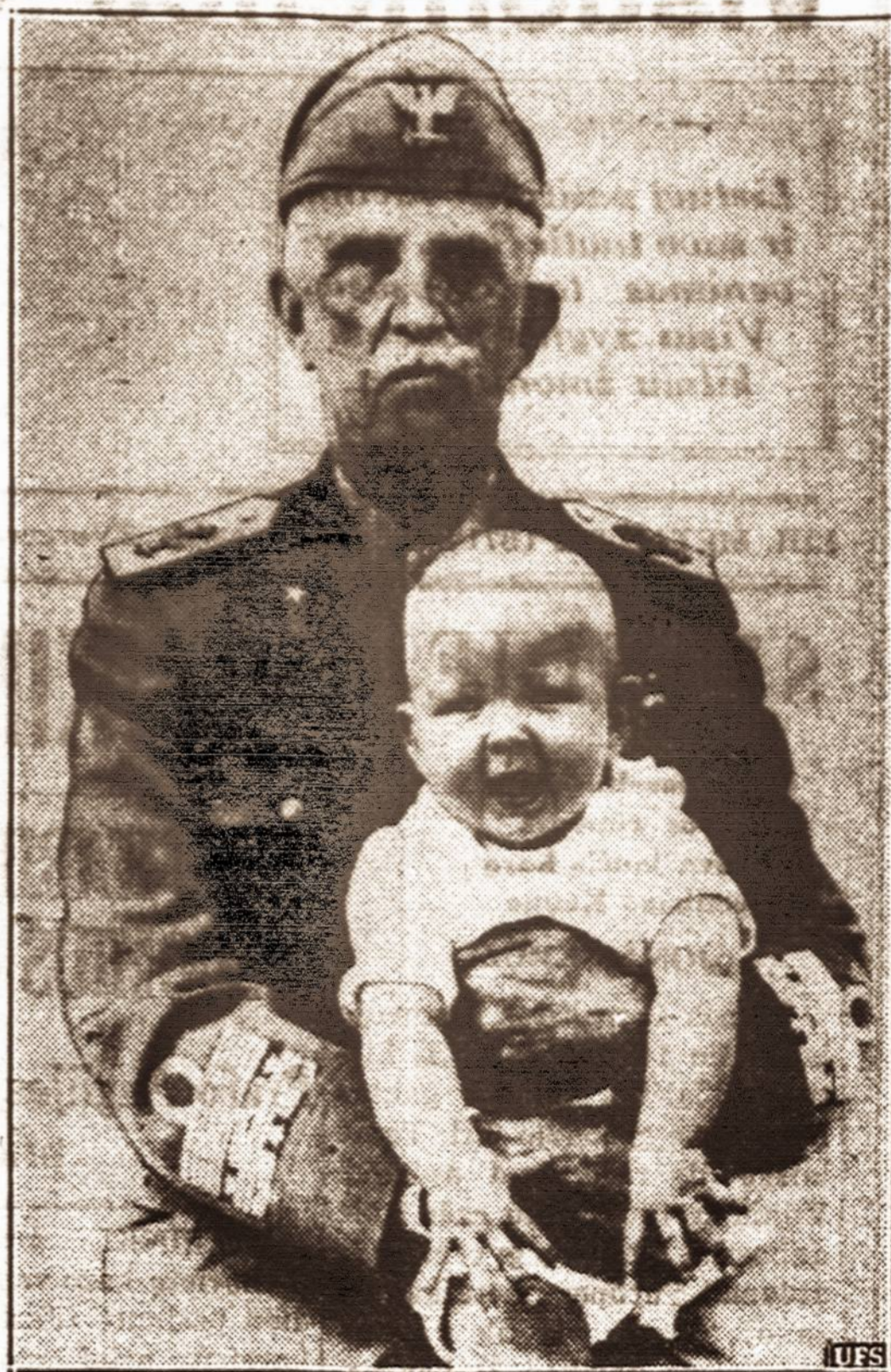
Italijos karalius ir jo anūkas. — Italijos karalius Victor Emmanuel ir jo anūkas. Italija dabar siūnia pagalbą Suomijai, bet pareiškia ištikimybę Romos Berlyno ašiai.

Projektas sudarytas labai kruopščiai, jame numatyti visi sunkumai, kurie gali atsirasti tunelį po jūros dugnu kasant. Parengiamieji darbai jau bulis yra inteligentais, jo profesijos ir pavardės negaliu skelbti, ir manydamas, kad jis yra sunkioje materialinėje būklėje, pasiūliau jam kreiptis į atitinkamas Lietuvos valdžios įstaigas dėl tarnybos. Jis man atsakė: "Kad mano asmeniškai reikalai man nerūpi. AS