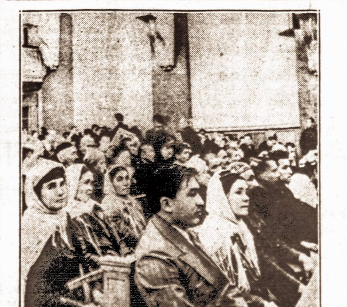
Raudonajam Parlamente. — Vaizdas iš Sovietų Sąjungos Parlamento sesijos, didžiojoje Kremliu Rūmuose. Mas. kvoje.