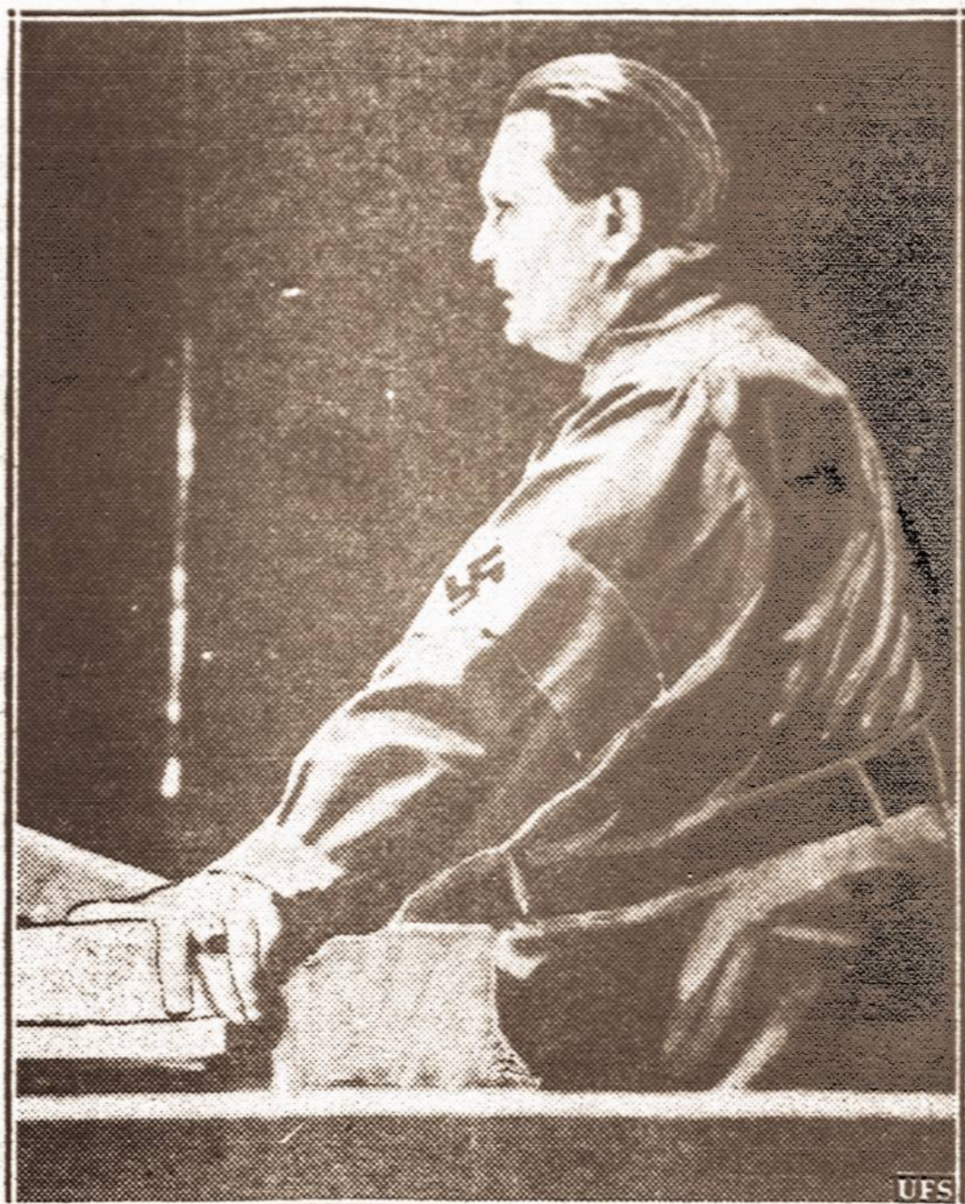
Hitlerio vietininkas. — Maršalas Hermann Goering, Vokietijos Aviacijos Ministras, kurį Hitleris, išvykdamas į rytų frontą, įvardino savo vietininku, jeigu jis žūtų kare.