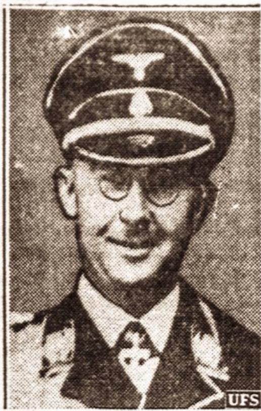
Supyko — Nacių Gestapo policijos vadovas Heinrich Himmler, kuris susipyko su Aviacijos Maršalu Goeringu

Jau anksčiau buvo paskelbta, kad VIENYBĖS leidėjai ir dabartinis jos štabas pasiryžę toliau leisti Amerikos tautinei visuomenei dienraštį VIENYBĖ.