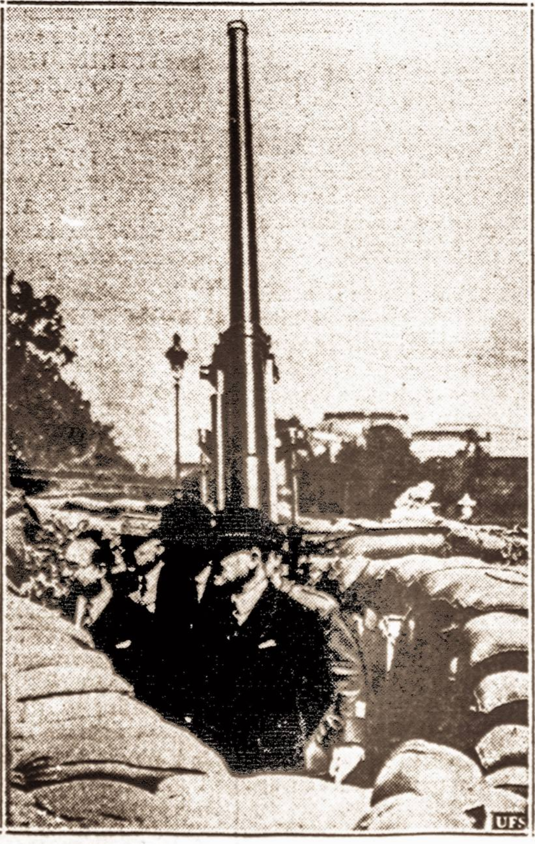
Apžiūri armatą. — Prancūzijos Prezidentas Lebrun, vakary frontė apžiūri vieną prancūzų priešlėktuvinę armatą.

VILNIUS. — Vilniaus Vytauto Didžiojo gimnazijos mokiniai priėmė rezoluciją, kad lietuvių Birutės gimnazijai būtų gražintos patalpos, iš kurių 1920 m. lenkai išmetė ir gautę lietuvių mokinius ir patys ten įsirengė lenkišką Oržeskiėnės gimnaziją.