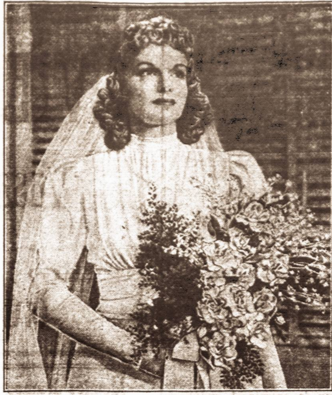
Nuotaka — Šitaip atrods 1940 metų nuotakos, jeigu jos norės dėvėti vėliausios mados vestuvinių aprėdalu.

Yra skelbimų, kur moteris stengiasi prilygti vyrą, kad turėtų stambią sumą pinigų ir kitokiais būdais juos vilioja, bet yra ir tokių, kurios atvirai pasisako, beveik nieko neturincios be jaunatvės, per tuos skelbimus daugelis susipažįsta, sudaro šeimą ir randa savo gyvenimo laimę.