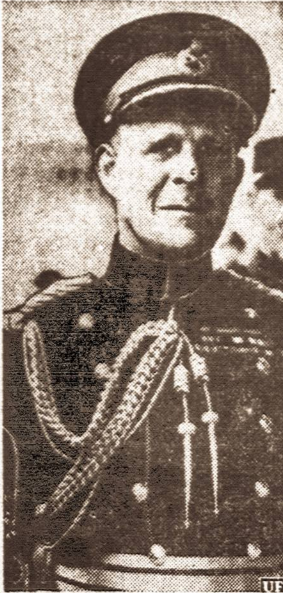
Viscount Gort Anglijos kariuomenės vadas

WASHINGTON, sausio 6 d. — Amerikos Kongresas daro žygių kuogreičiausiai praveisti įstatymą paskolinti Suomijai $60,000,000 karo reikalams.