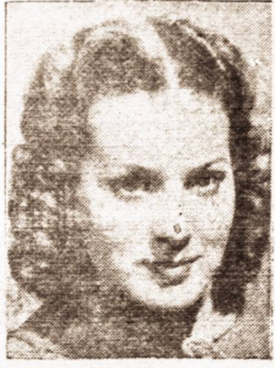
Filmų artistė Maureen O'Hara, kuri vaidina filmoje "Hunchback of Notre Dame" vėliausiu laiku labai pagarsėjo kaip žymi artistė