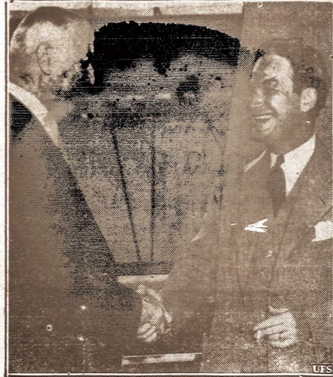
Republikonas ir demokratas — Šiais metais Prezidento rinkimuose šie du politikieriai vadovaus rinkimų kampanijai. Kairėje James A. Farley demokratų vadas, dešinėje John D. M. Hamilton, republikonų vadas.

MASKVA, sausio 10 d. — Vėliausiu laiku Maskvoje siaučia nepaprastai dideli šalčiai. Kai kuriomis dienomis šaltis siekia net 31 laipsnių žemiau zero. Tokių didelių šalčių Maskvoje jau seniai būta.