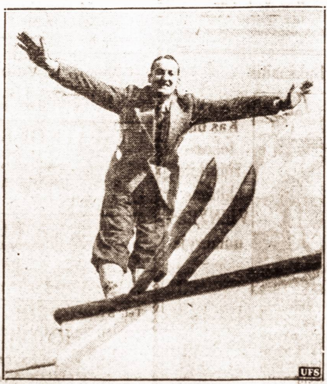
Pasliūzininkas — Amerikoje vėliausiu laiku labai populiarėja žiemos sportas pasliūzėmis. Kas savaitė tūkstančiai miestiečių specialiais traukiniais vyksta į provinciją pasportuoti.