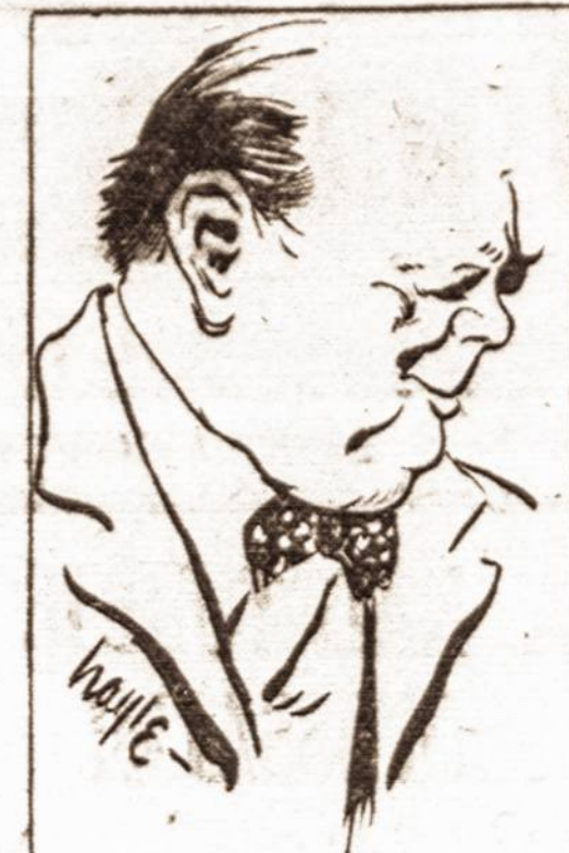
Vadas. — Winston Churchill, dabartinis Anglijos karo laivyno Ministras, kuris numatomas skirti visų Anglijos karinių jėgų ministru ir vyriausioju vadu.

Šviežiai sukastose bulvėse yra daugiau vitamino, negu tokiose, kurios pastovi rūšiuose keletą mėnesių. Nuo Graf Spee buvo nuimti 36 negyvi jūreiviai ir daugiau 60 sužeistų. Kreiseriu Exeter pasiekus uostą, nuo jo irgi buvo nuimta daugiau šimtas sužeistų ir nemažai mirusių.