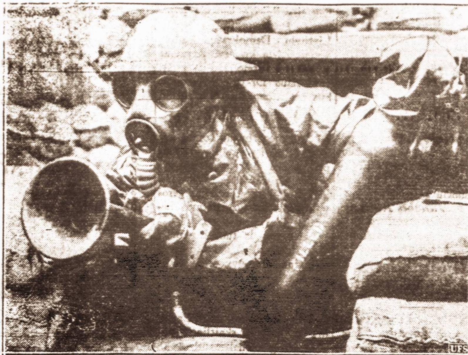
Pasiruošęs — Kalbama, kad šį mėnesį vokiečių karo aviacija gali pradėti bombardavimus Anglijos miestuose. Čia matyti anglų kareivis apkasė sargyboje viename Londono parke. Jų pareiga sekti vokiečių karo lėktuvus.

Tiesa, prieš du metus, kuomet Hitlerio išlaisvinto Jurgio Dimitrovo nauji teizai jau buvo gerokai jo agentų praveisti įvairiose darbininkų organizacijose, ypač komunistų kontroliuojamos masinės draugijos ir net kai kuriose anglo-saksų kultūrinuose rateliuose. Maskvos partija pradėjo kilti į aukštį, užimdama vis tvirtesnes ir svarbesnes pozicijas. Maskvos agentai, pa-