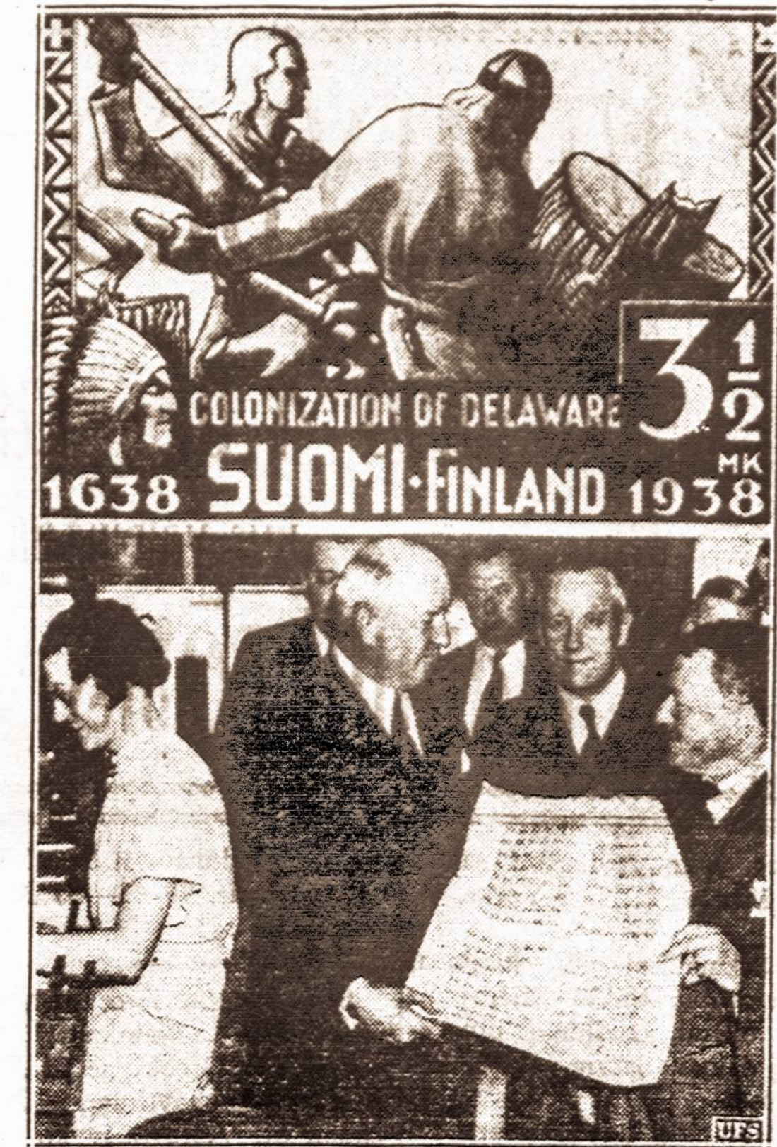
Amerika ir pirmiau simpatizavo Suomijai. — 1938 m. Jungt. Valstybės išleido specialius pašto ženklelius minėti suomių kolonizavimui Delaware. Suomija irgi išleido tam minėjimui ženklelius, kaip parodyta viršų. Apačioj — pastų viršinin kas Farley žiūri į tų ženklelių pirmąjį lakštą.

Taigi, esant nors mažiausiam reikalui, malonėkite kreiptis į VIENYBĖS administraciją, o mes Tamstoms su mielu noru visada patarnausime ir pasidavinsime turimomis žiniomis ir patarimais.