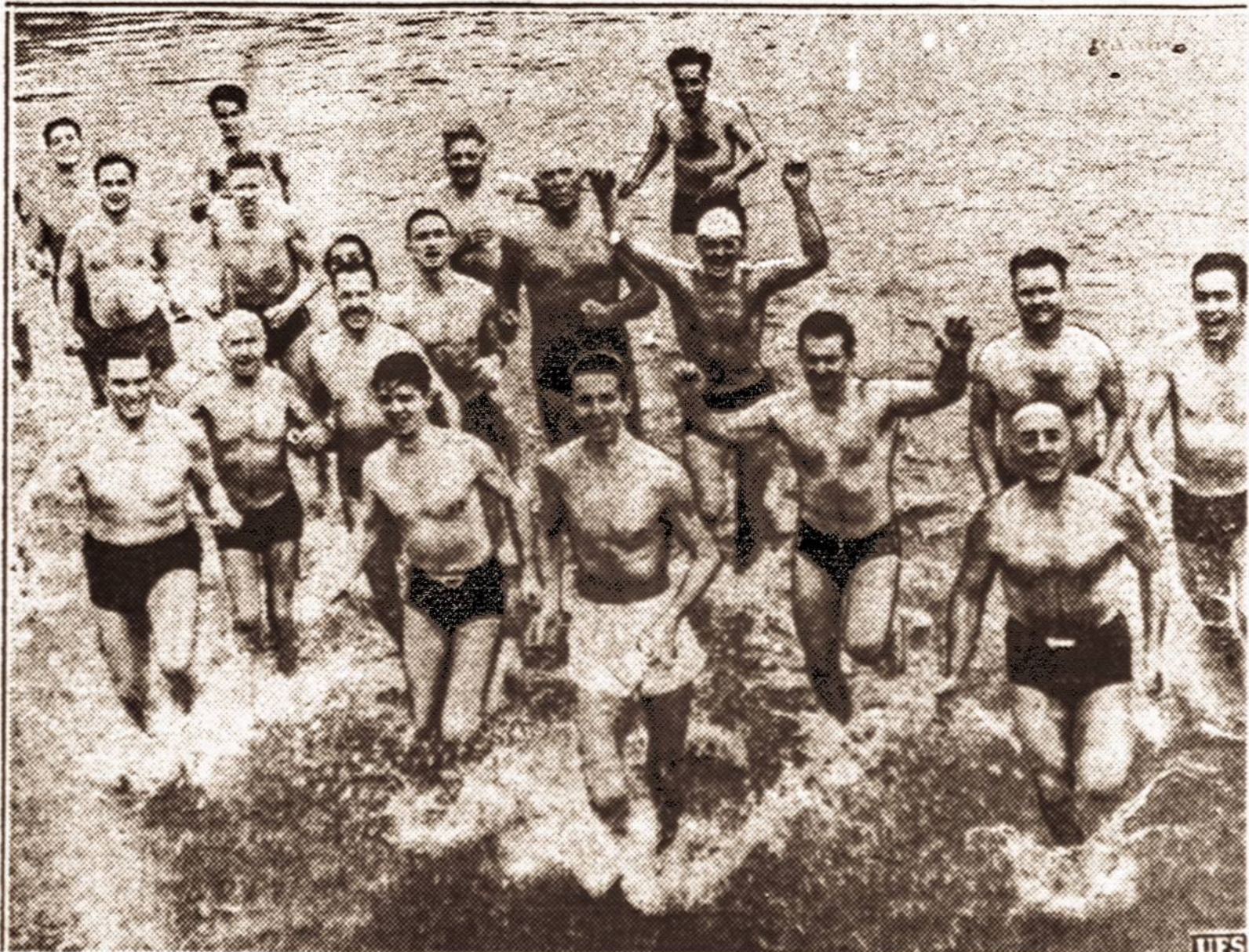
Nebijo šalčio — San Francisco, Cal. neseniai sudarytas vadinamas "Dolfinų klubas", kurio nariai žiemą ir vasarą eina maudytis į jūtas. Nors žiemos metu Ramusis vandenynas atšala, bet ne taip šalsta, kaip Atlantas. Čia goja yra vadinamas "Atšiaurės meškų klubas, kurio nariai taip pat žiemą maudosi Michigano ežere.

VILNIUS. — Įvykusiame Varėnos valsčiaus ir miestelio gyventojų susirinkime visų pareikšta padėka Lietuvos vyriausybei už dedamus rūpesčius ir prašyta lietuviškų mokyklų Pučkarnės, Buivydonių, Kuršių, Lieponių ir kt. kaimams. Čia yra šeimų, kuriose po tris ir keturis narius yra sėdėję lenkų kalėjimuose už lietuvišką veikimą.