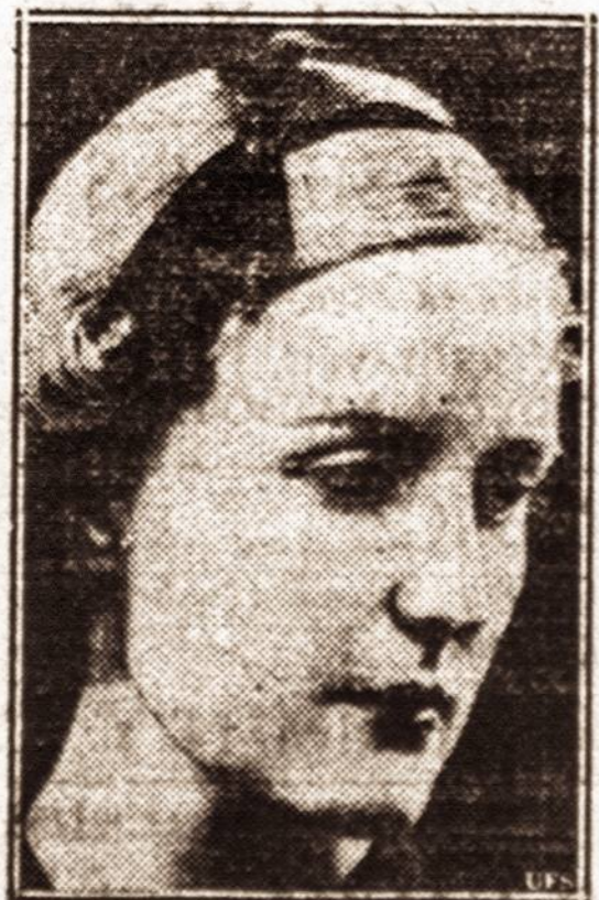
Gydosė namie — Anglė Unity Freeman-Mitford, anglų aristokratų dukterė, didelė Hitlerio gerbėja, kuri neseniai grįžo iš Vokietijos sužeista, dabar gydosė savo tėvo namuose Anglijoje.

BILLETAI Į ŠOKIUS: VYRAMS 50 CENTŲ; MOTERIMS IR MERGINOMS 25 CENTAI