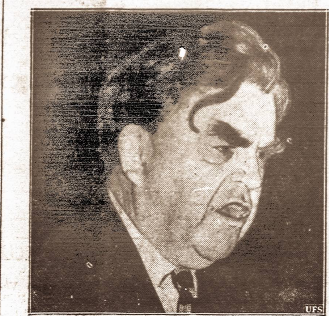
John L. Lewis

ALYTUS. — Kalėdų antrą dieną Alytus buvo atidarytas naujas pastatas, sanatorija turi dvi dides medines vilas "Gražina" ir "Birute" ir 36 namelius, kur vasaros metu gyvena ligoniai. Žiemą Alytaus sanatorijoj yra 150 lovų, o vasaros metu iki 230. Tai yra moderniausia Lietuvoje sanatorija. Alytaus šilėlis, kuriame sanatorija randasi, yra skaitoma geriausia sanatorijoms vieta, nes visiškai izoliuota nuo miesto ir nepaprastai sausas.