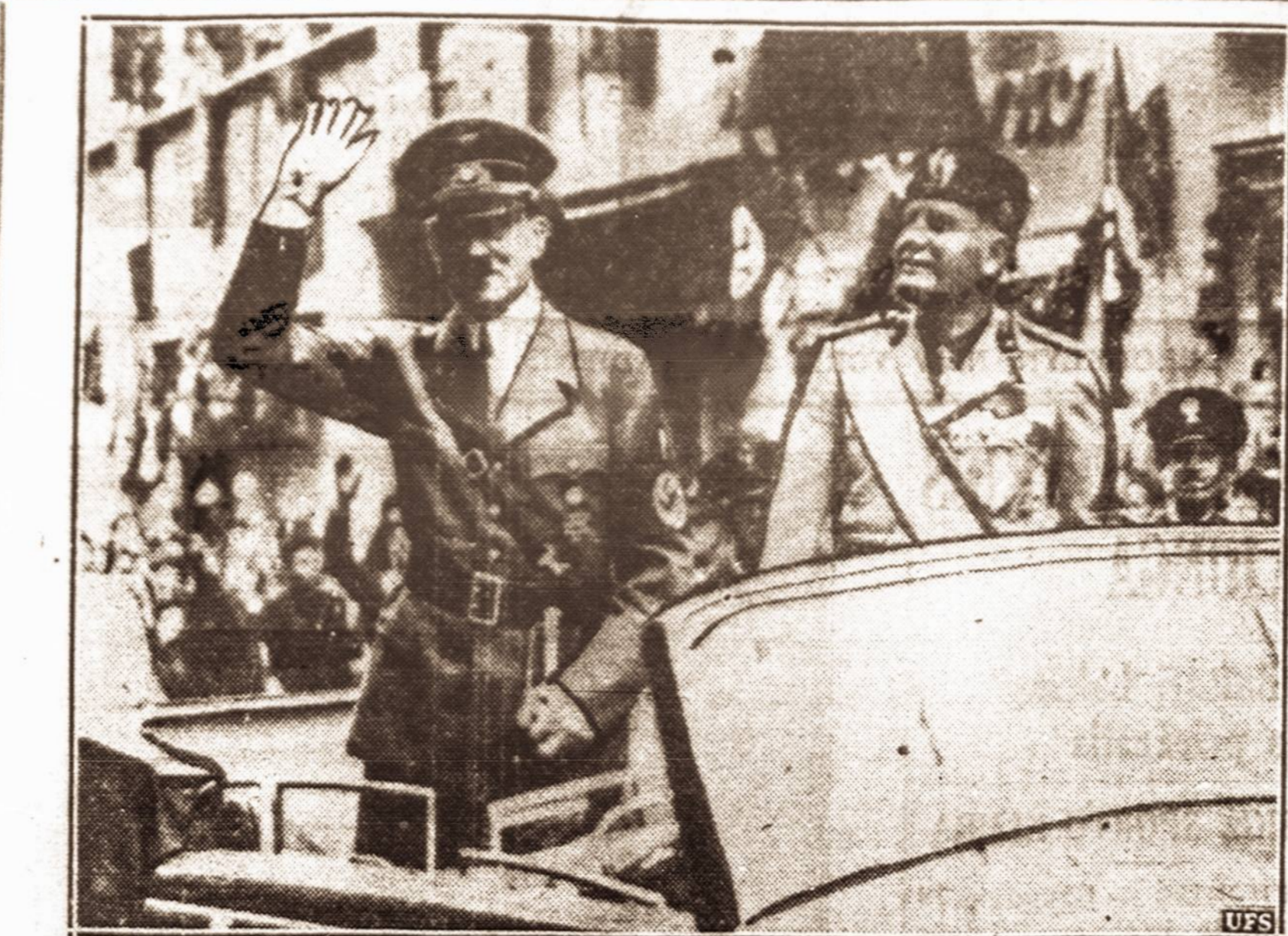
Ar jie vėl susitarė? — Vokietijos Kancleris Hitleris ir Italijos diktatorius Mussolini, kai jie buvo atvirai draugai ir kai Hitleris lankėsi Romoje.

Konstatavęs energingą lenkinimo pasekmių atitaisymo darbą, laikraštis priduria, kad su štepmu susidomėjimu yra laukiamas Vilniaus krašte bažnytinio klausimo išsprendimas.