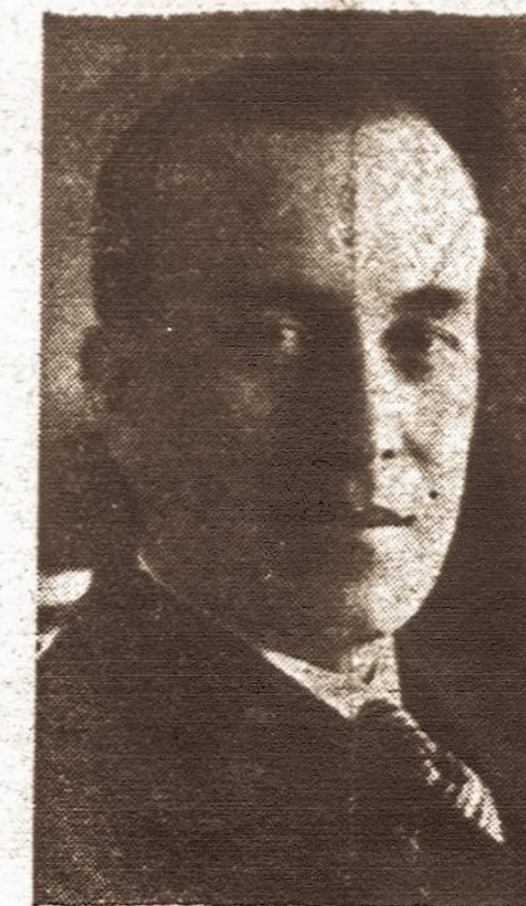
Kazys Urbšys Užsienių Reikalų Ministras