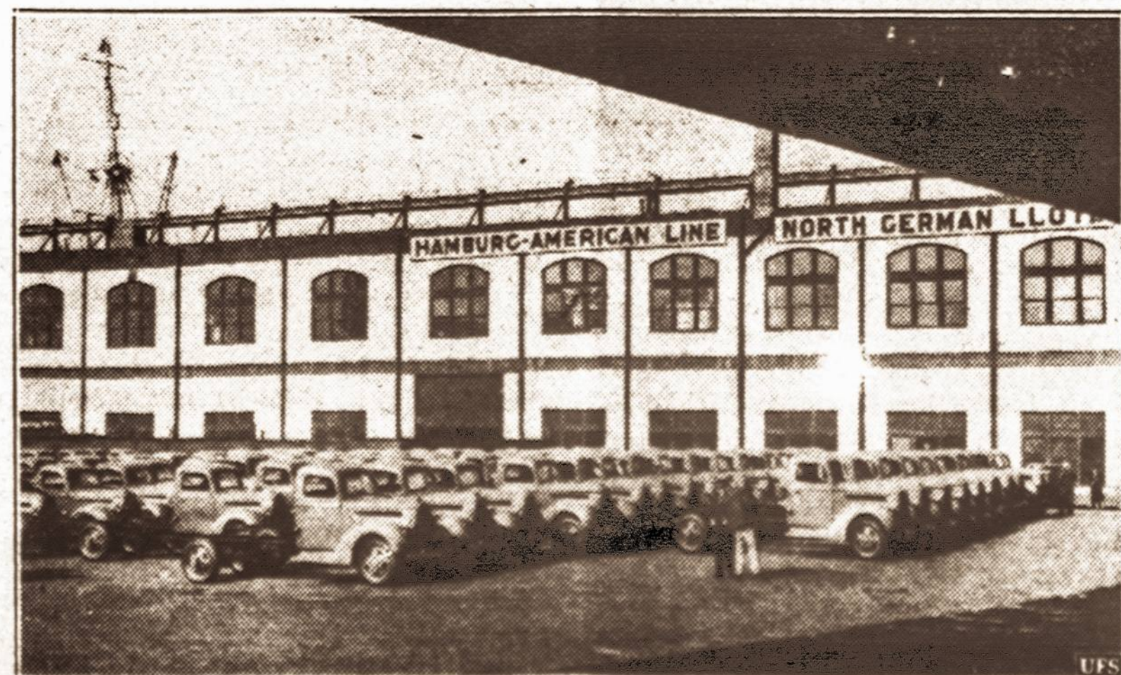
Didieji Vokiečių Dokai, per kuriuos buvo gabunami į Vokietiją tūkstančiai Amerikos automobilių. Karas tą biznį sustabdė.

KAUNAS. — Po Naujų Metų ir Lietuvą palietė didelė ir matyti, pastovi šalčių banga. Trijų Karalių išvakarėse ypatingai padidėjo speigai palaipsniui tebekyla ir sausio 8 ir 9 d. pasiekė 33 laipsnių didesnį teritorijos dalyje, o Vilniaus krašte net iki 35 laipsnių Celsijaus žemiau nulio. Dėl didelių pusnių susisiekimas ypatingai autobusais yra žymiai ap sunkintas. Dėl speigų sustojo mokslas mokyklose. Meteorologijos pranešimai skelbia, kad tokie šalčiai truksią ilgą laiką.