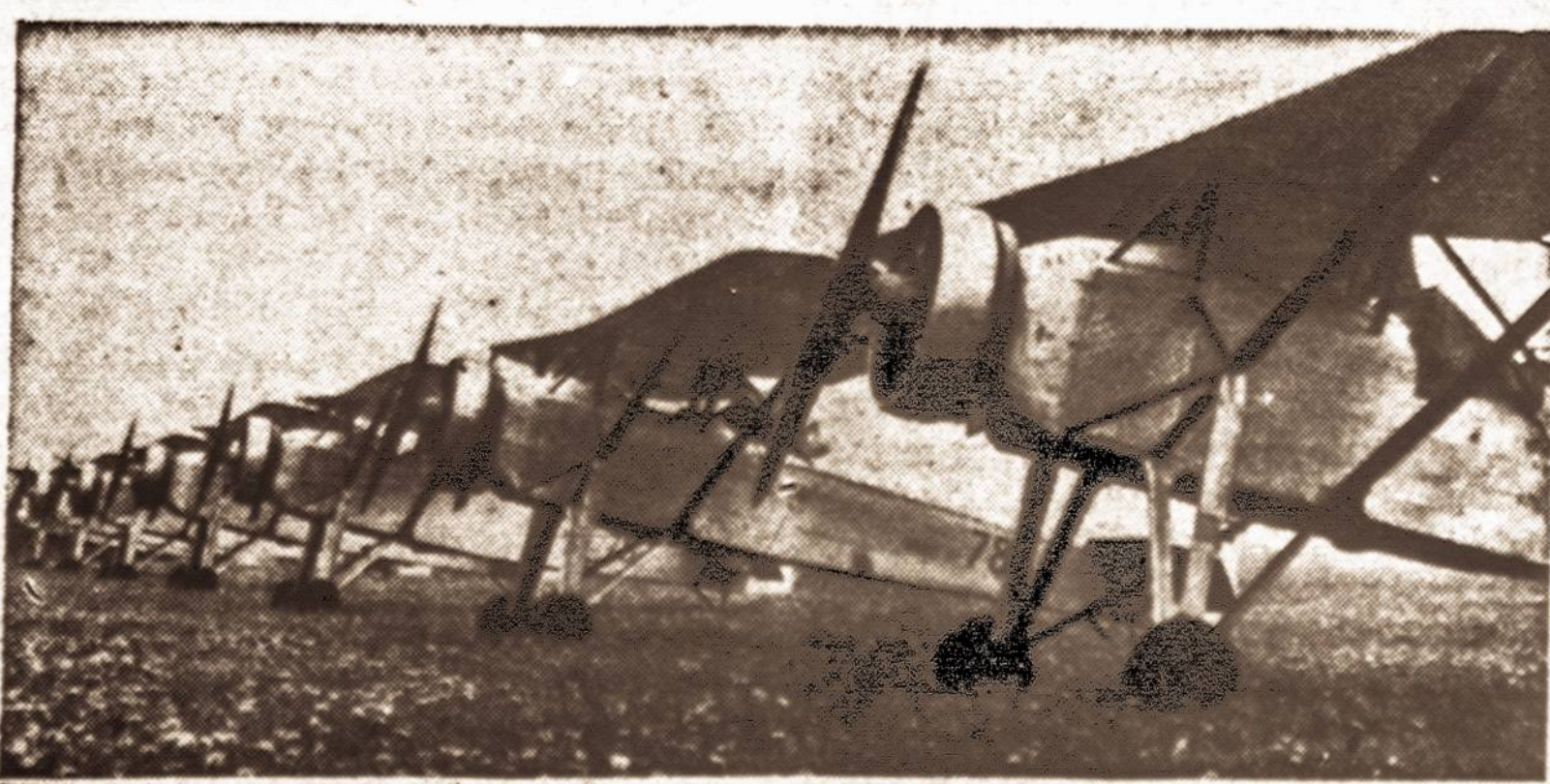
LIETUVOS KARO LĖKTUVAI pasirėngę ginti šalies neliečiamybę.

VILNIUS. — Sovietų Sąjungai atitekusiose srityse yra likę dideli kiekiai Vilniaus krašto pirkliams priklausa, jų užpirkti miško kiekiai. Dedamos pastangos, kad vilniečių užpirktoji medžiaga iš tų sričių būtų perleista į Vilnių, kas pusantrų iki pusės metų kalėjimo.