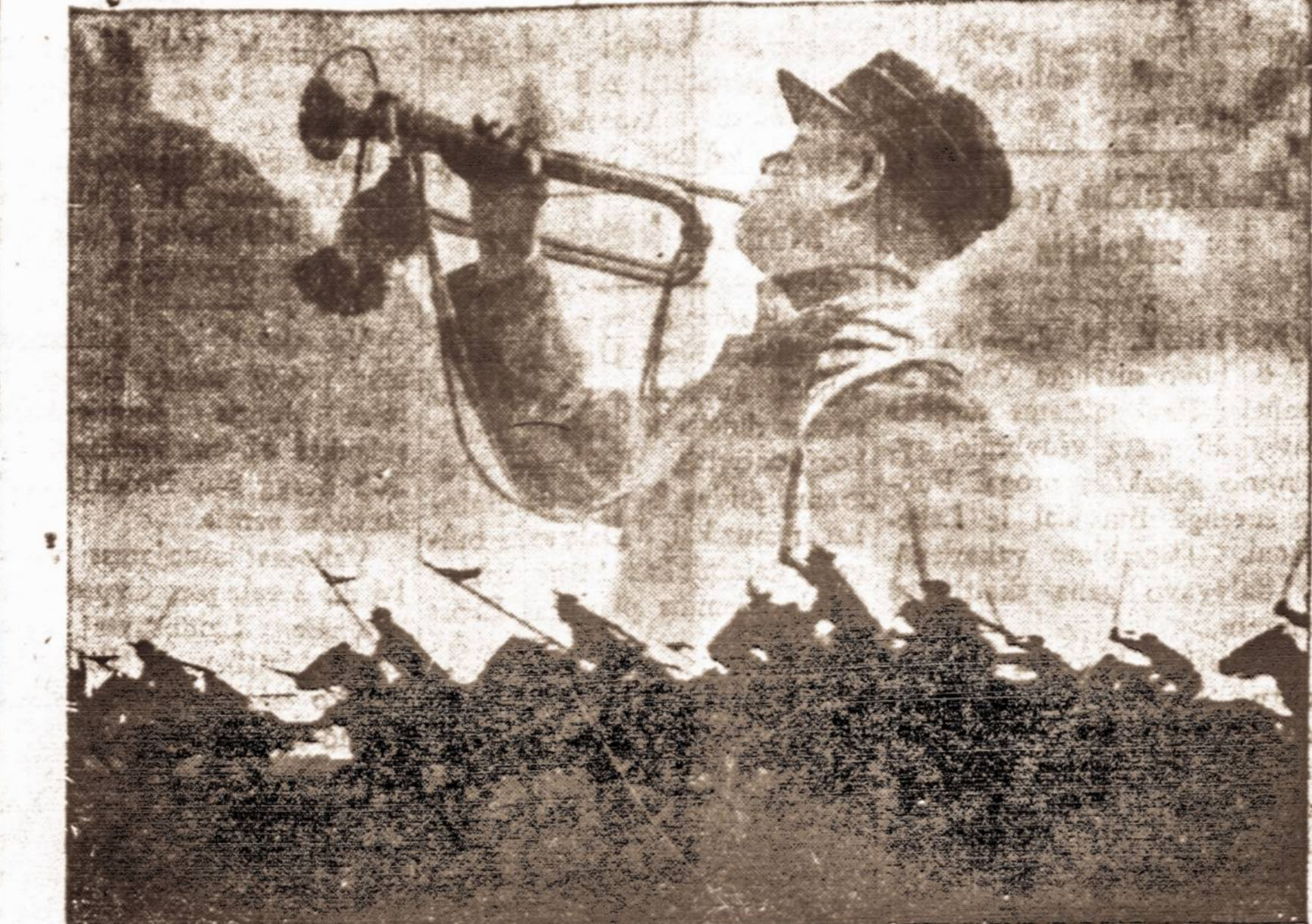
Pirmyn juodberiai! — Nekartą Lietuvos raiteliai ant savo juodberių šitaip gynė Lietuvos nepriklausomybę nuo įvairių Lietuvos priešų.

Kitas svarbus punktas tai padėti Lietuvai pernešti ekonominę šios padėties našta. Priešai tiksliai paliko Lietuvai Vilnių, bet pasiliekė sau visą Vilniaus teritoriją, kaip tik tikslo sudaryti ekonominius sunkumus. Prie to dar jie pri-varė tikstančius vadinamų pabėgėlių iš buvusios Lenkijos, kad Lietuva dar daugiau pasunkinti. Karo belaisviai ir pabėgėliai maitinti Lietuvai kaštuoja da milijonai litų į mėnesį. Nekalbant apie paties Vilniaus ekonominę būklę be Vilnijos teritorijos. Priešai tiksliai Lietuvai apsunksino, kad suklyptų. O mūsų pareiga at-eiti į talką.