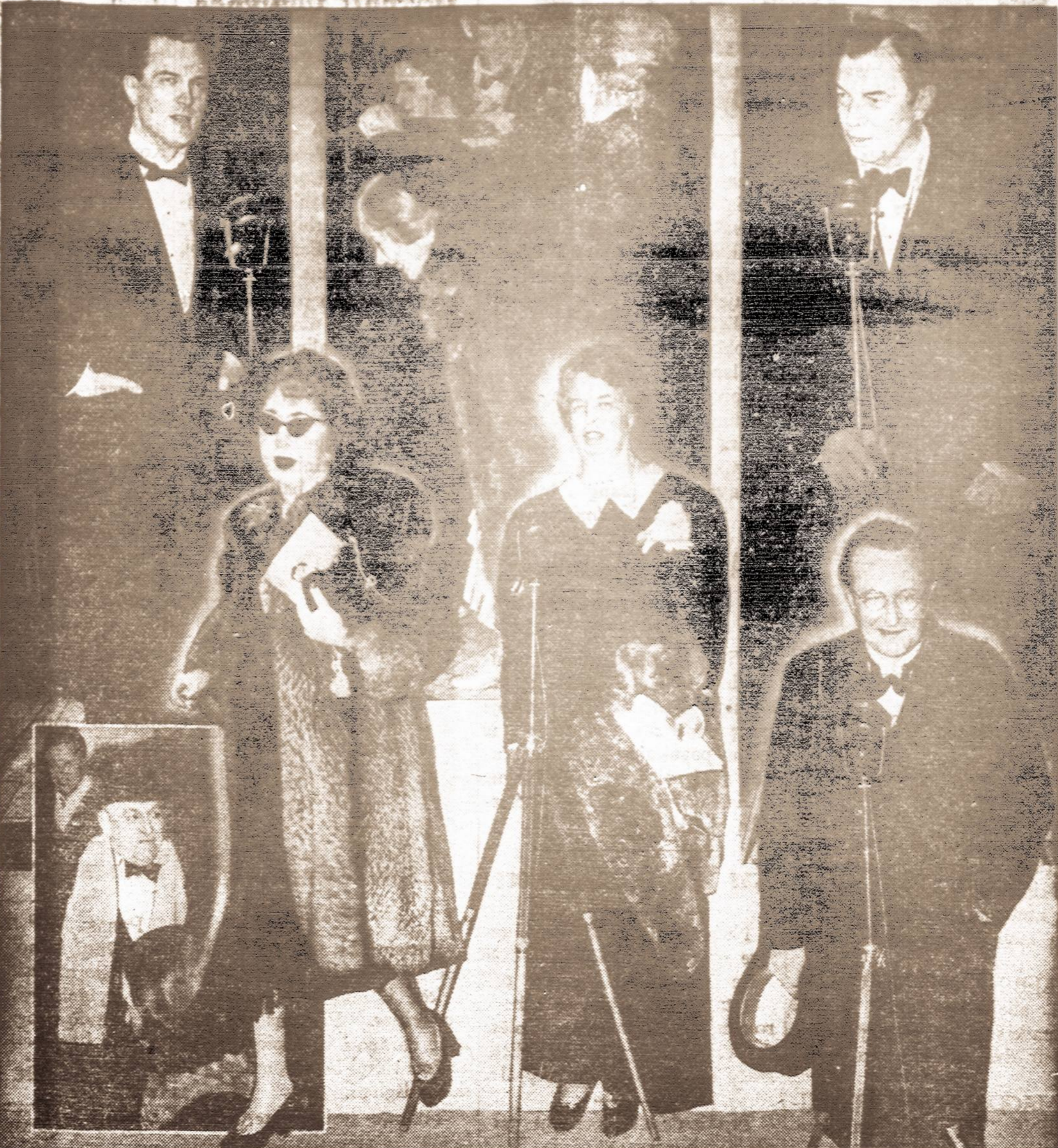
Washingtono įžymybės. — Viršų kairėje populiarių kariaujančios Suomijos Pasiuntinys Washingtono Hjalmar Procope, viršų centre Mrs. Alice Roosevelt Longworth, viršų dešinėje Federalinis Valstybės Gynėjas Robert H. Jackson, apačioje kairėje Aukščiausio Teismo teisėjas Owen J. Roberts, centre Mrs. Evalyn Walsh McLean ir prezidento žmona Mrs. Franklin D. Roosevelt, apačioje dešinėje Anglijos Pasiuntinys Washingtono Lord Lothian.

Gavikas. Labai mėgiamas todėl, kad moterys bendrai mėgsta visus elegantiškus apgavikus. Ypatinai tuomet, jei jie padeda apgauti kitus.