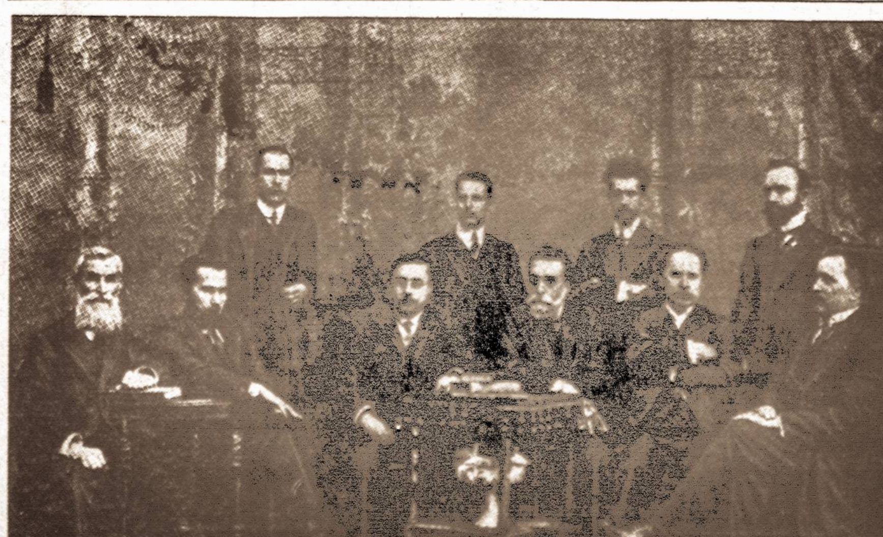
Pirmieji Nepriklausomos Lietuvos valstybės vyrai.

Sis įvykis sukėlė didelio sąjudžio visuose diplomatinuose sluoksniuose. Vokiečiai pasiuntė strpų protestą Anglijai už laūžymą Norvegijos neutralumo. o Norvegijai — už nesilaikymą neutralumo ir leidimą Anglijos laivams šeiminkauti savo vandenyse. Gi Anglija peikia Norvegiją už leidimą Vokietijos pagelbiniame karo laivui su karo belaisviais naudotis jos neutralumu. Norvegija, Vokietijos verčiama, reikalauja, kad anglai grąžintų visus paimtus iš Altmarko savo žmones ir atlygintų už nuostolius, ko Anglija ir nevaldininkai peržiūrėjo laivą,