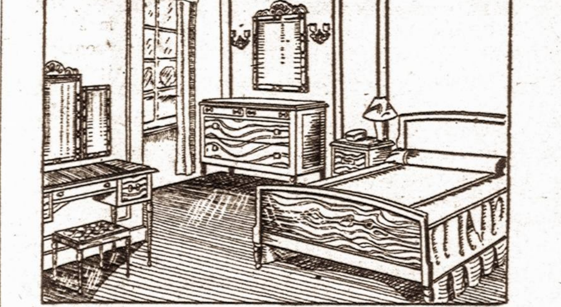
Taip nupigintomis kainomis parduodame įvairius rakandus. Pasirinkimas didelis.

BEDROOM SETS — PARLOR SETS STUDIO COUCHES—KITCHEN SETS DINETTE SETS, MATRASAI IR SPRINGSAI