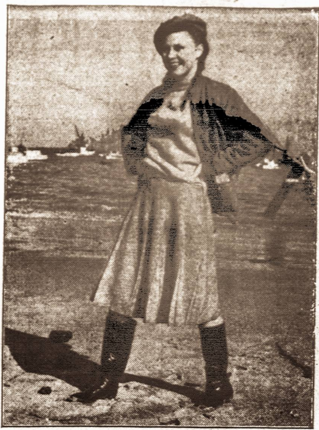
Filmų artistė Ginger Rogers vaidina filmoje „Primrose Path.“ Čia mes ją matome vilkint filmoje vilkinčių kostiumu.

Kitu atveju pakalbėsime ir apie kitus specialius vakarus, kurie įvyko pastarąją savaitę. Bazarietis.