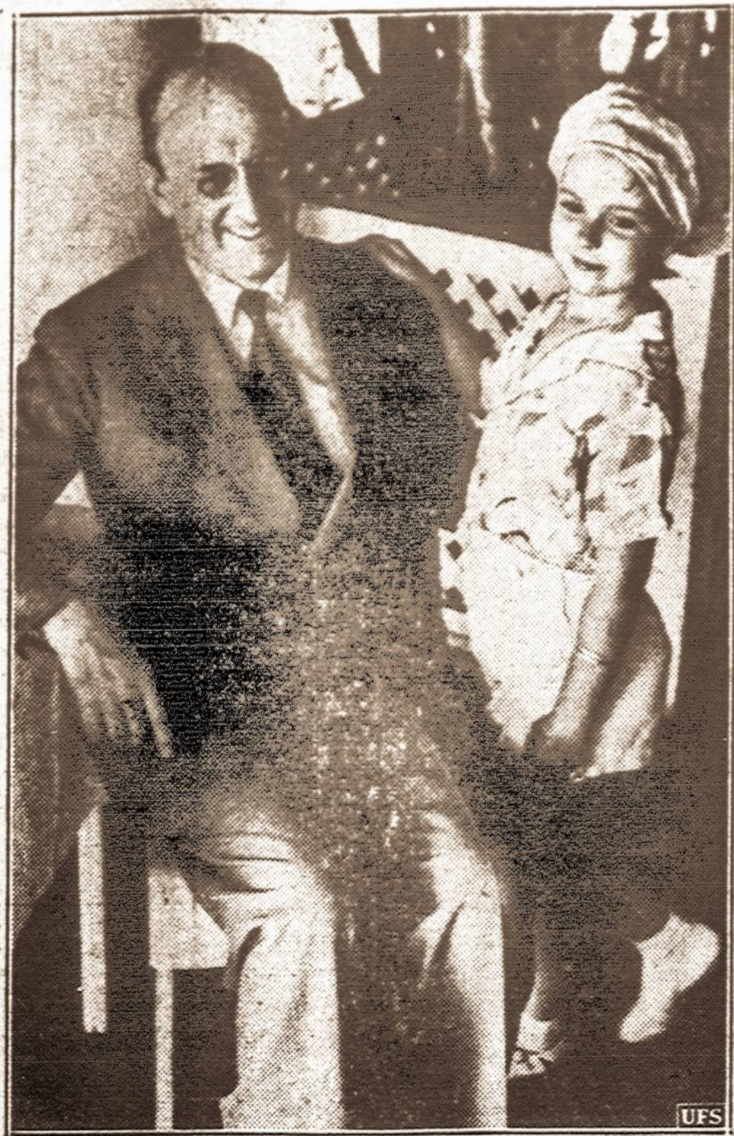
Du turtuoliai. — Atostogaudamas Honolulu salose Jungtinių Valstybių Izdo Sekretorius Henry Morgenthau susitiko su jaunuole fimų aktore Shirley Temple, kurios gabumai įvertinami nemažiau už visą šios respublikos išdą.