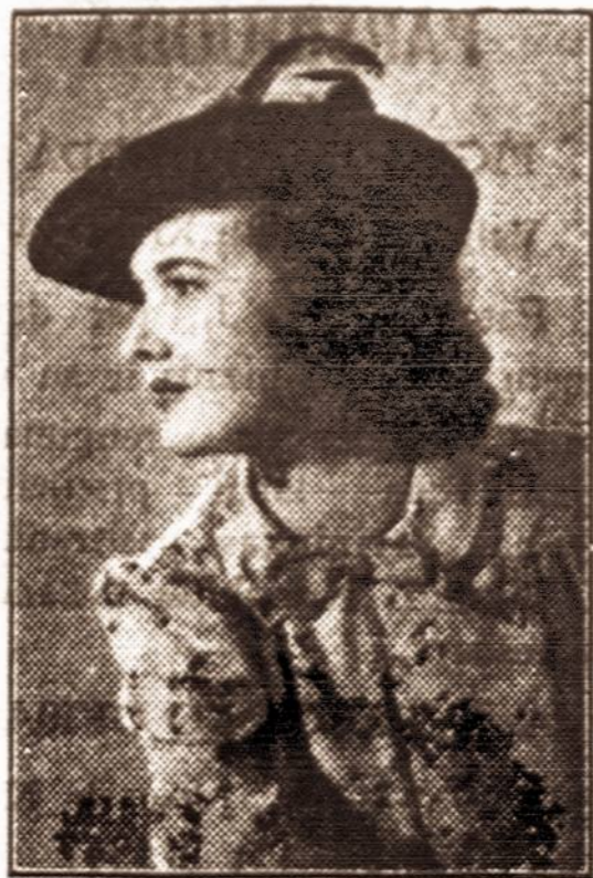
Nauja sportinė jakutė.

Yes, Spring should be the season of Youth. But for millions of young Europeans now marching, there will never be any Spring... they will never enjoy Youth... Let us all, all of us who are able to enjoy our youthful days as nature intended, raise our voices and pray: "May the wanton destruction of Youth across the sea soon cease... May the Youth of the world never again be exploited by blood-thirsty, power-drunk madmen!"