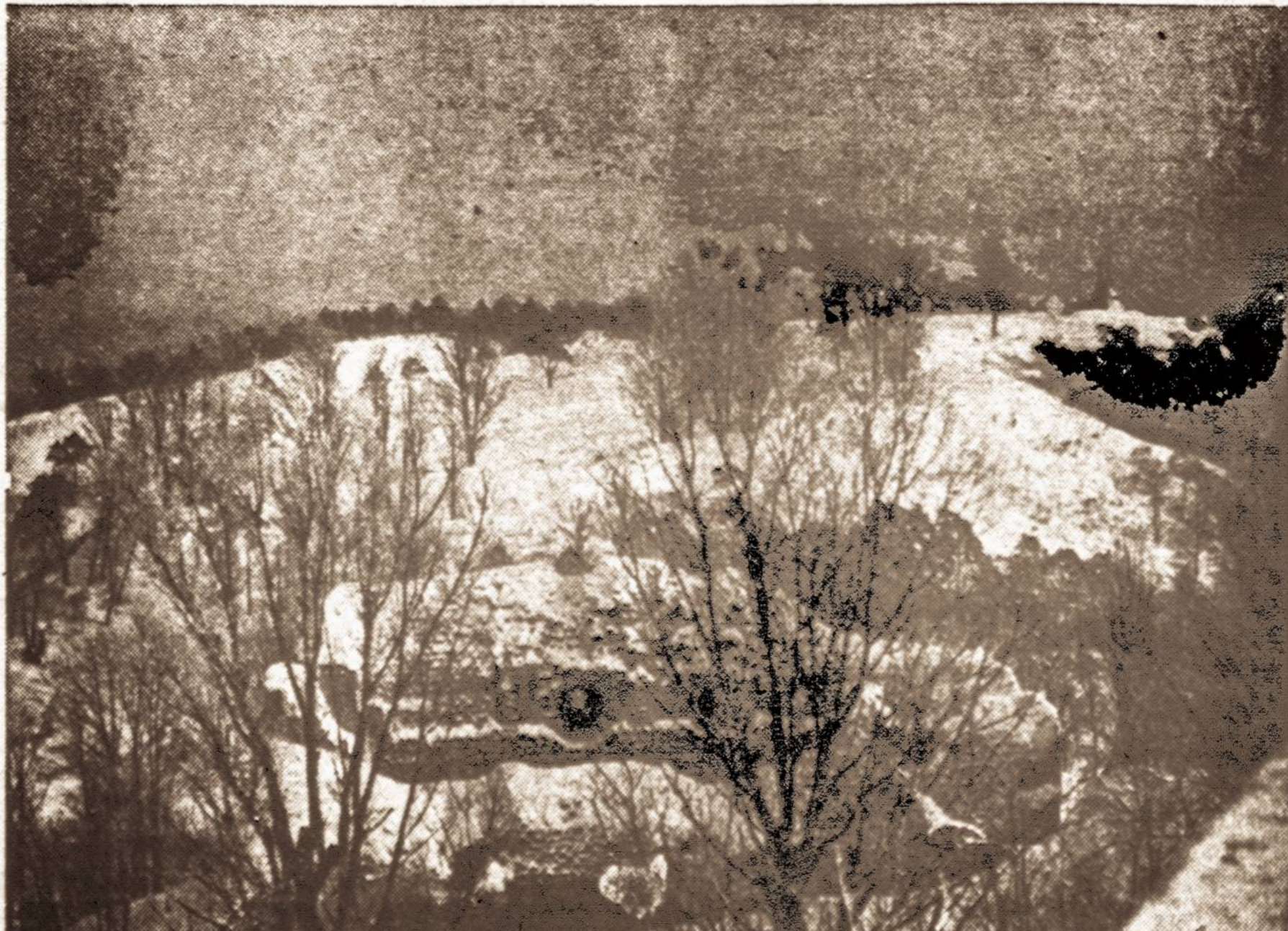
Vilniaus kalneliai, sveikinamieji! — Reginys iš Gedimino pilies kalno į Trijų Kryžių kalną gilesios žiemos metu. Priešakyje matyti Gedimino pilies rytinio fasado griuvėsiai, toliau — kitapus Vilnelės upės slėnio — Trijų Kryžių kalnas ir Trys Kryžiai (dešiniam kampe viršuje) Toje vietoje rusai žudė 1863 metų sukilimo dalyvius.

VILNIUS. — Vilniaus Prekybos Rūmų patalpose įvyko brangiųjų kailių aukcionas, šešioliktasis Vilniuje iš eilės ir jau antrasis Lietuvoje. Vilnius yra iš senovės žymus kailių prekybos miestas Europoje ir bendrai pasaulyje. Įvairių įvairiausių brangių kailių išstatė visi kailių prekybos namai, kurių Vilniuje yra labai daug. Pirklių ir prekybos agentų buvo ir iš užsienių. Nežiūrint karo Europoje, kailių prekyba buvo gyva, bet populiariausias dabar yra sidabrinės lapės, kurių kailiai ir Vilniaus aukcione buvo gausiai perkami.