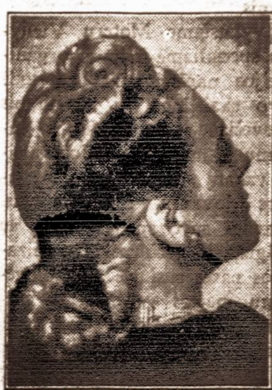
Naujas plaukų garbinavimas

Norint, kad vaikas norėtų daugiau būti lauke ir norėtų judėti, reikia jam duoti malonų užsiėmimą. Visų mėgiamausias yra rogutės. Didelė tėvų klaida draust važiuoti rogutėmis iš baimės, kad nesudaužytų, nesulažytų kojos, rankos. Vaikai turį juk miktintis ir išėkyot prisirinkusią energiją. Nereikia leisti ten, kur