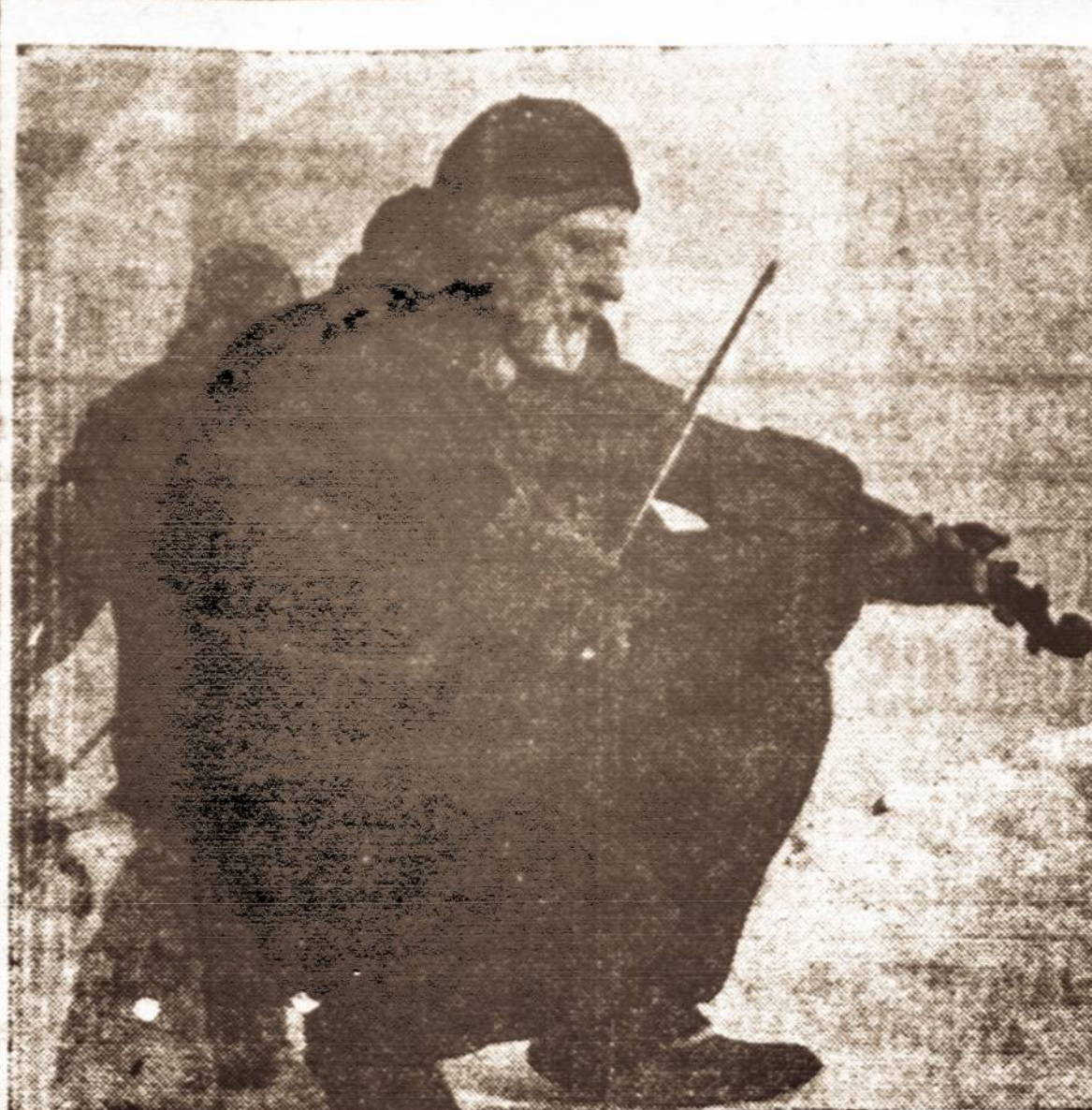
Smuikininkas prie Vytauto Didžiojo Katedros Vilniuje.