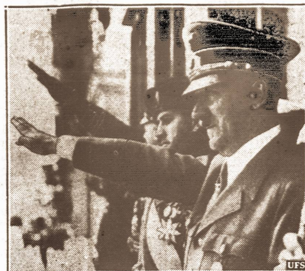
Adolf Hitler Nacių diktatorius susitiko su Italijos fašistų vadu Benito Mussolini pasitarti apie Europs politiką.

KRIUKAI—Šakių apskr. — Kriukių miestelis plečiasi, vasarą privažiuoja daug vasarotojų. Statoma daug naujų namų, tik be jokios tvarkos, nes miestelis dar ligi šioliai neįtyt planuotas. Kadangi tai veik vienintelė vasarvietė visame šakių apskr., tai reikėtų kuo greičiau išplanuoti, kad nors kiek pagerėtų miestelio išvaizda. Daug nusiskundimų yra dėl pašto agentūros pavadinimo, nes didelė dalis korespondencijos nusiunčiama į Kriukus šiaulių apskr., nors adresas būna aiškiai parašytas, kad Kriukai—Šakių apskr. Reikėtų arba pavadinimas pakeisti, arba atydziau skirstyti. Nors jau daugelį kartų buvo ir skundžiamasi tuo reikalu, bet vis nuolat kartojasi tokie nusiskundimai. Atsitinka ir nemalonumų dėl skubių laišku suvėlinimo.