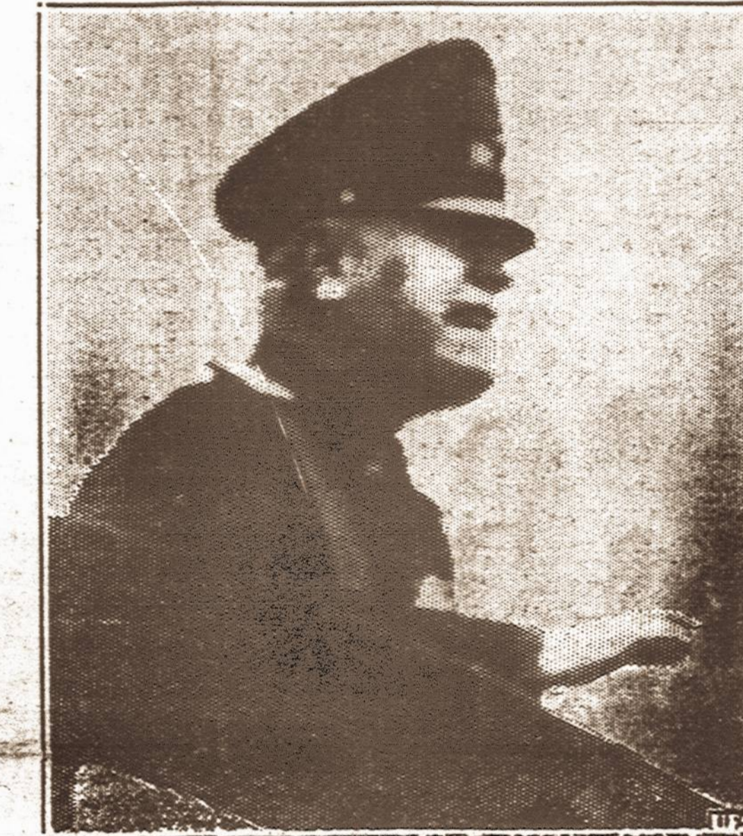
Benito Mussolini Fašistų diktatorius vakar kalbėjosi su nacių diktatorium Hitleriu Italijos pasienio miestelyje