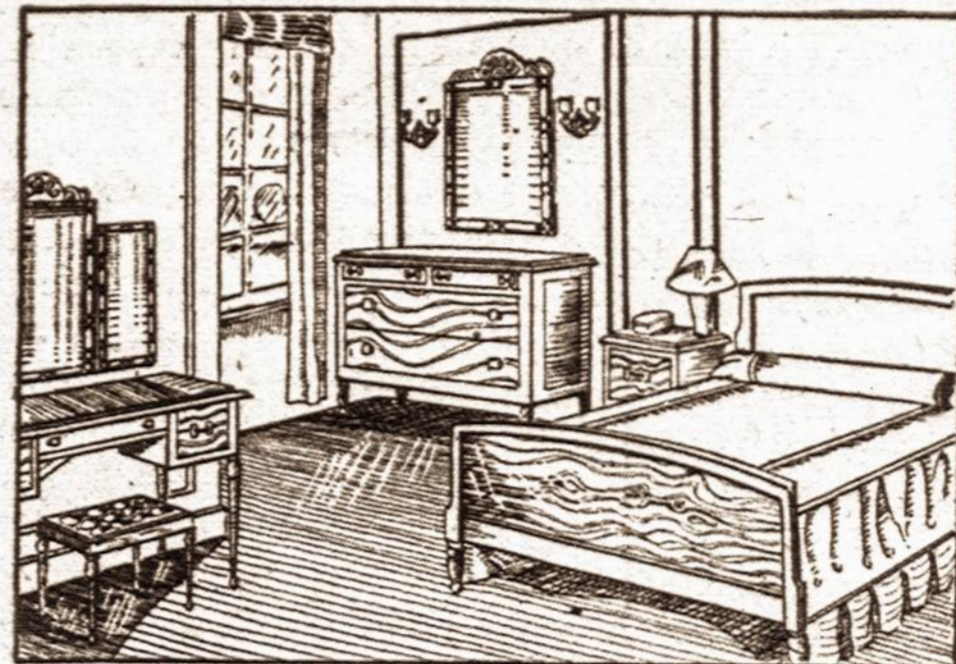
Taip nupigintomis kainomis parduodame įvairius rakandus. Pasirinkimas didelis.

BEDROOM SETS — PARLOR SETS STUDIO COUCHES — KITCHEN SETS DINETTE SETS, MATRASAI IR SPRINGSAI