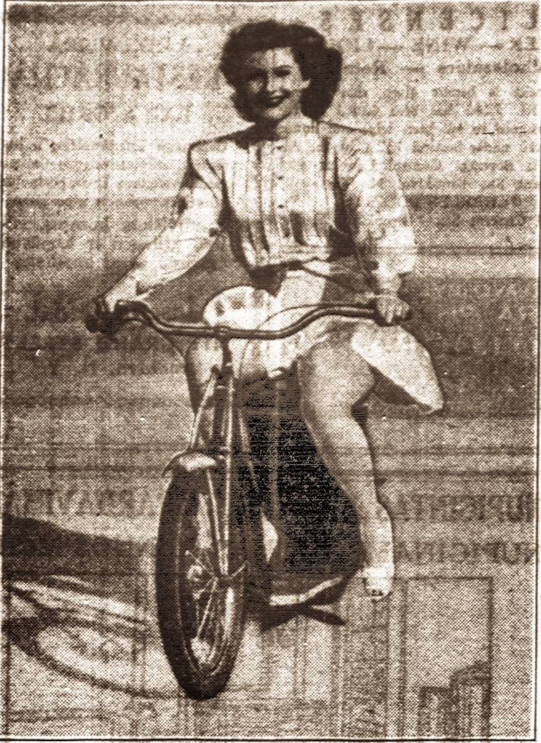
Lucille Ball, filmų artistė, kas rytą išvažiuoja pasivažinėti dviračiu. Sako, jos sveikata to reikalauja.