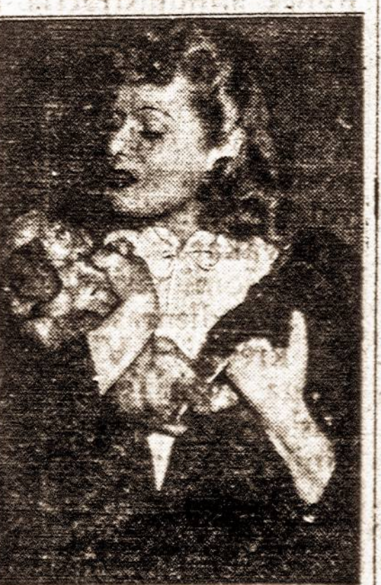
Anna Neagal RKO artistė. Ji netrukus vaidins filmoje "Irene".

1 svara višienos ir 1 svara višienos kaulų smulkiai sukaptoti ir apkepti svieste su smulkiai sukaptotomis daržovėmis ir lauro lapais. Įdėti truputį milo, ipliti buljono, pamiduro, košės ir stiklinę raudono vyno, virti valandą, perkošti, įdėti išvirtus sūriame vandeny plonus makaronus ir paduoti.