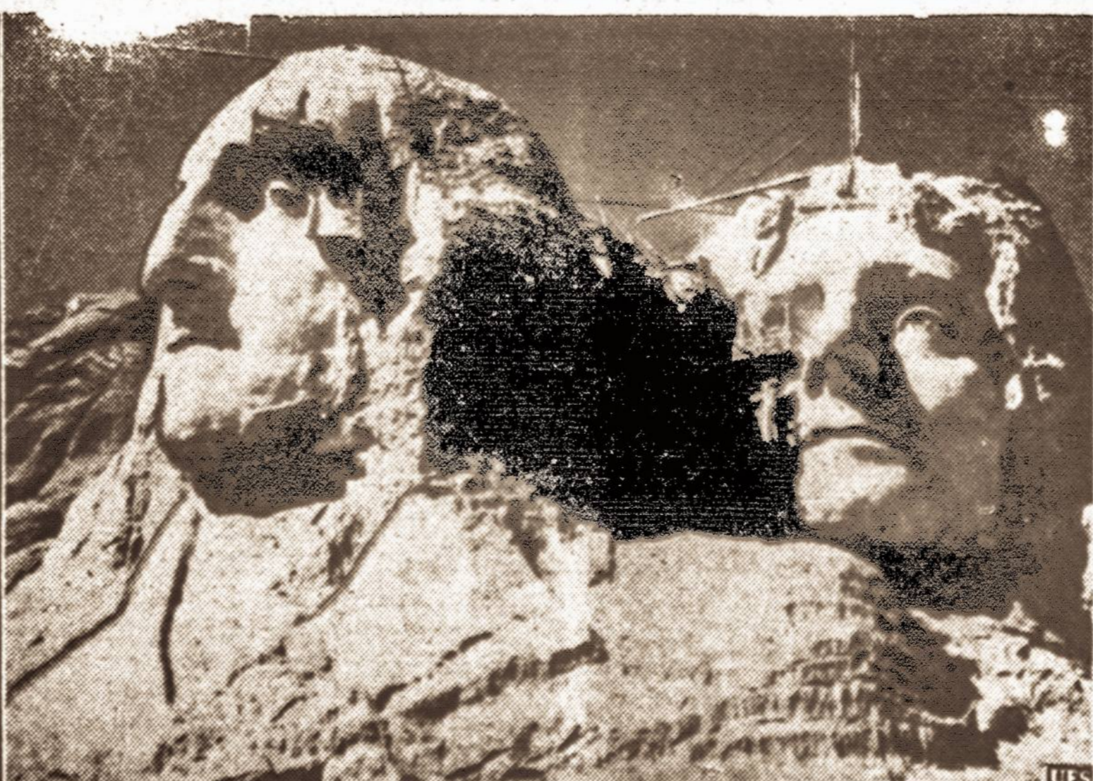
Amžini paminklai. — South Dakotos Juoduosiuose Kalnuose milžiniški granito kalnai aptašomi taip, kad vaizduotų Amerikos prezidentus. Čia matome du akmeninius kalnus paverstus į prezidento Washington ir prezidento Jeffersono galvas.

VILNIUS. — Vilniaus lietuvių kooperatyvas "Rūta" jau turi įsteigęs Vilniaus mieste 20 krautuves ir 12 Vilniaus krašte, viso 32 krautuves. Kooperatyvas savo veikimą žada dar plėsti, be kt. apriupina duona Vilniaus miestą.