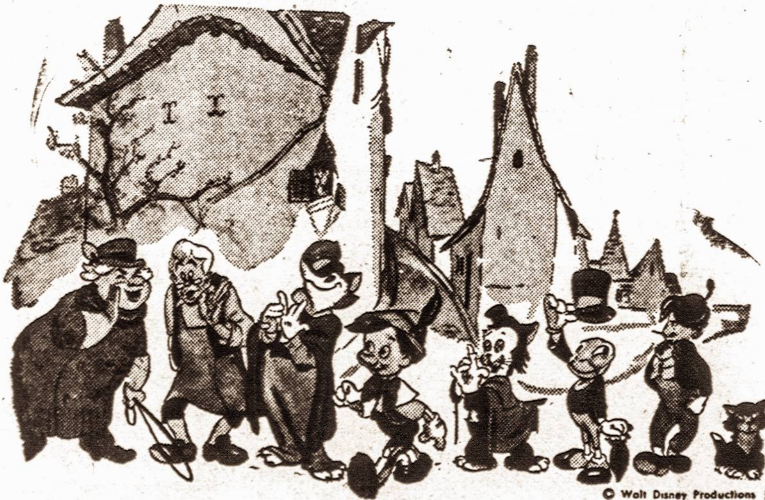
Po "Snow White" filmos, turiniu ir mintimi panaši filma yra "Pinocchio," kurią da- bar matome demonstruojant didesniuose Brooklyno teatruose.

Viel ko laidotuvių direktoriai išnuomuoja automobilius įvairioms reikloms