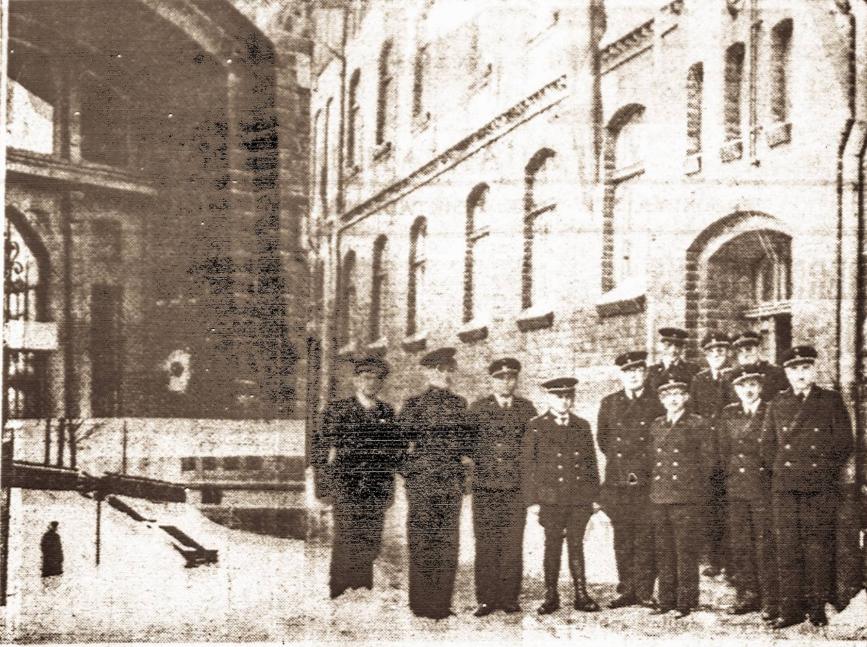
Lietuvos laisvoji zona Klaipėdos uoste. — Klaipėdos Uosto bendrovės ir laisvosios zonos muitinės patalpos. 1. Įėjimas į Klaipėdos Uosto bendrovės patalpas. 2. Laisvosios zonos muitininkai ties iškelta Lietuvos vėliava prie muitinės patalpų. 3. Sargyba prie įėjimo į laisvąją zoną.

Paskutinėmis žiniomis, į prekybos registrą yra prašydintos 3,593 firmos. Tarp jų vienasmenių įmonių 2,934, pilnųjų bendrovių 506 ir akcinių bendrovių 139. Pagal verslo sritis tarp jų yra: prekybos firmų 2,800, pramonės firmų 593, mišrių 120, kredito 15, kiti 65.