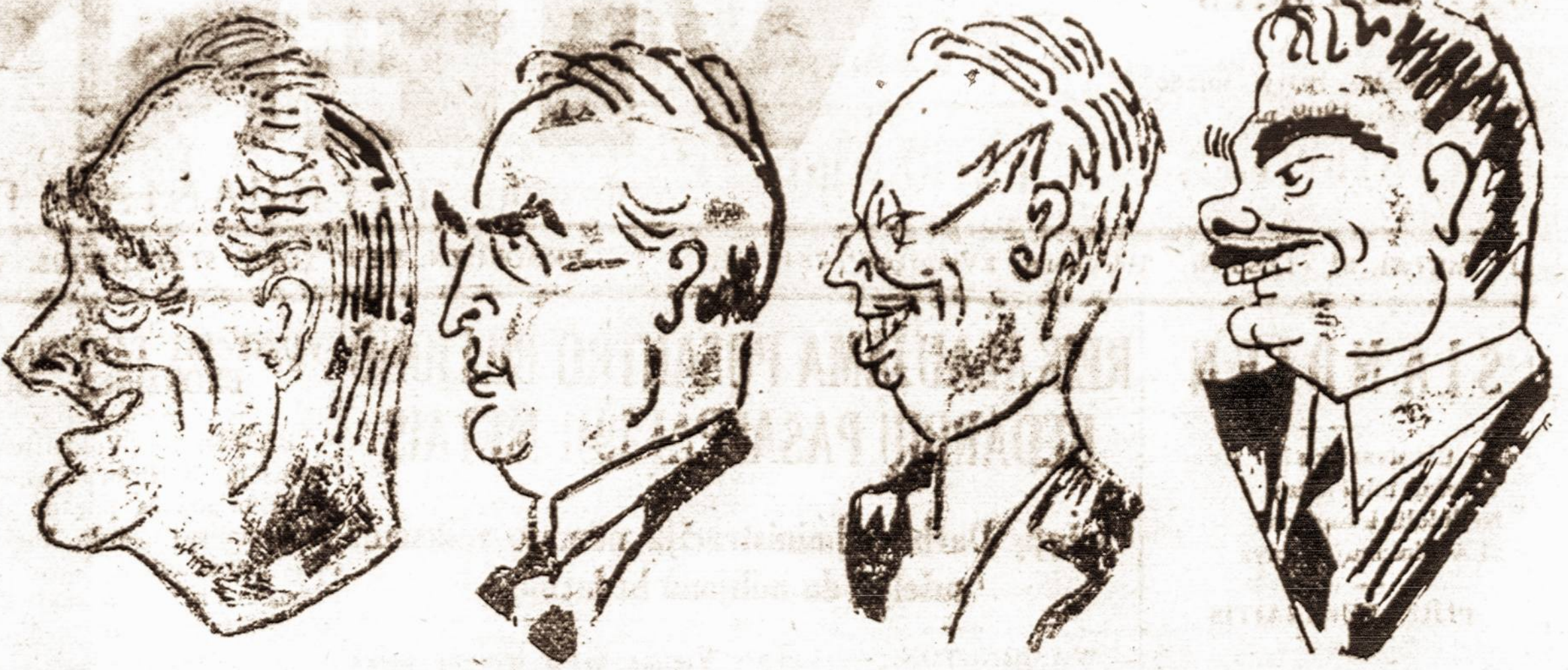
Roosevelt Vandenberg Taft Dewey Kuris iš jų? - Keturi aspirantai į Jungtinių Amerikos Valstybių prezidentus. Dewey ir Rooseveltas laimėjo Wisconsin valstybėje. Dewey taip pat populiarus New Jersey ir New Yorke.

Modernišk. Je, rusai iš atimos iš Suomijos teritorijos sudarė naują respubliką karelių-suomų respubliką ir sako, kad jie turės užtektinai daug darbo sukurti "modernišką respubliką."