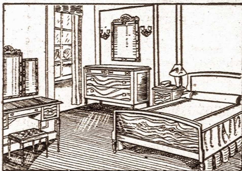
Taip nupigintomis kainomis parduodame įvairius rakandus. Pasirinkimas didelis.

BEDROOM SETS - PARLOR SETS STUDIO COUCHES - KITCHEN SETS DINETTE SETS, MATRASAI IR SPRINGSAI