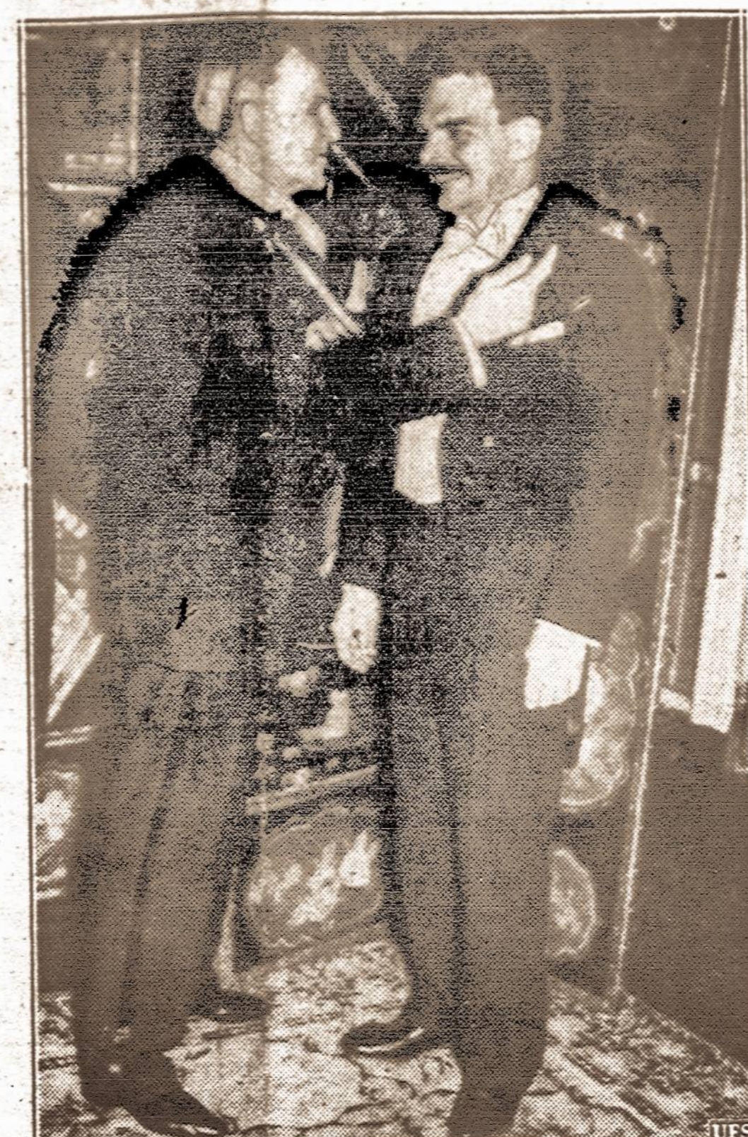
Biznis ir politika.—Žilagalvis automobilių gamintojas Henry Ford kalbasi su kandidatu į Amerikos prezidentus Thomas E. Dewey.

KAUNAS.—Šiomis dienomis duotas leidimas statyti kreidos fabriką. Anksčiau buvo duotas leidimas įsteigti žemės ūkio mašinų fabriką. Pramonės ir Prekybos departamentas nurodoma, kad dar vis yra visa eilė šakų, kurioms reikalingos savos, vietinės įmonės, fabrikai. Visi, kas turi tam noro, kapitalo ir reikalingo supratimo, bei prityrimo, gali gauti leidimus tokioms įmonėms steigti.