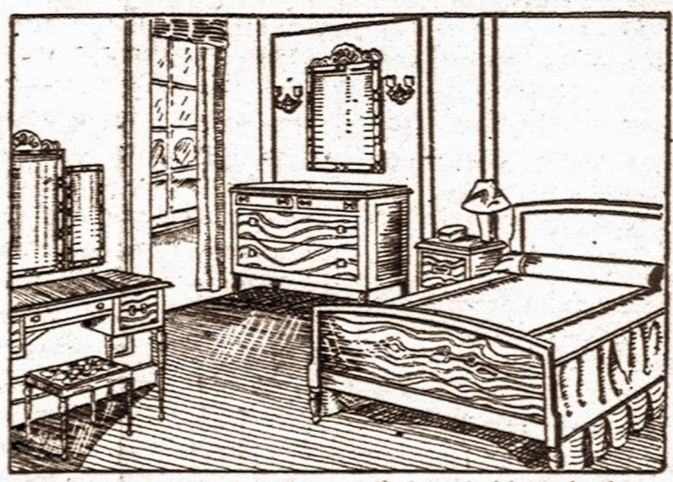
Taip nupigintomis kainomis parduodame įvairius rakandus. Pasirinkimas didelis.

BEDROOM SETS — PARLOR SETS STUDIO COUCHES—KITCHEN SETS DINETTE SETS, MATRASAI IR SPRINGSAI